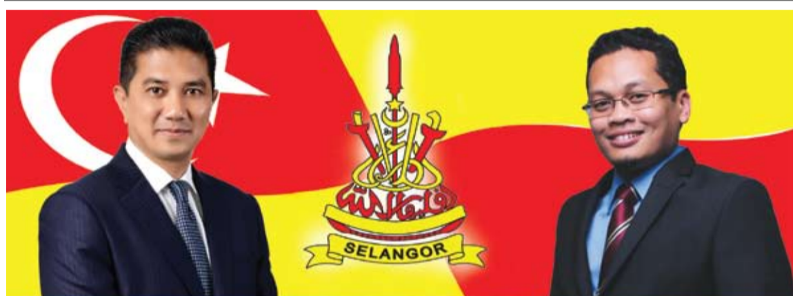
YAB Tuan Mohamed Azmin Bin Ali Dato' Menteri Besar Selangor