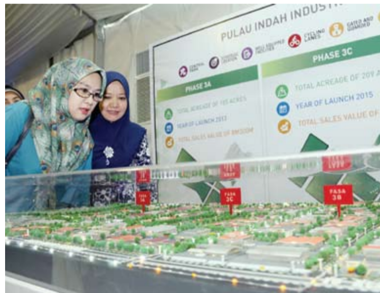
Program penghijauan taman industri bagi memastikan bahan kitar semula dapat digunakan semula