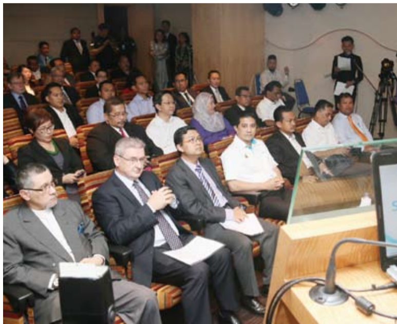
Kerajaan Selangor diberikan penerangan berkenaan operasi SYABAS semasa lawatan ke ibu pejabat syarikat itu