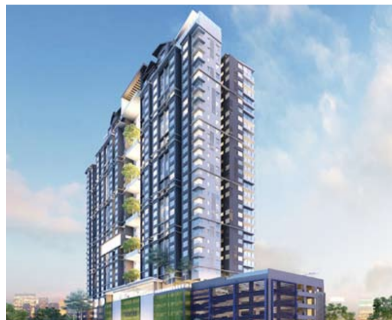
Model bangunan The Louvre 36 tingkat yang menjadi pertikaian penduduk sekitar Kajang

"Diingatkan, apa yang kita tidak terima adalah jika terdapat unsur rasuah dan salah guna kuasa dalam memberikan kelulusan ini. Kita tidak berkompromi," katanya.