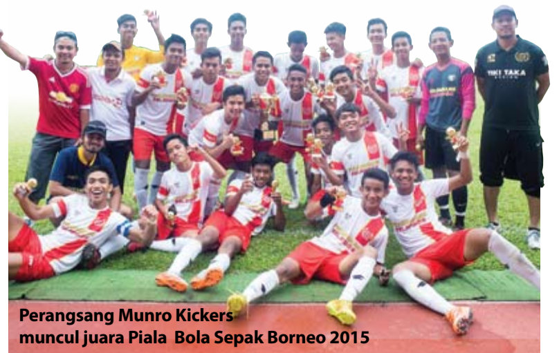
Perangsang Munro Kickers muncul juara Piala Bola Sepak Borneo 2015

Pelaksanaan Kem Pembangunan Bakat Sukan merangkumi pemilihan, latihan dan pembangunan ahli sukan muda berumur di antara sembilan sehingga 12 tahun oleh jurulatih profesional.