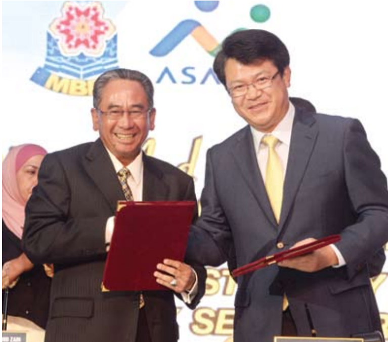
Kerjasama Asan dan Petaling Jaya memantapkan hubungan dua hala bagi kemakmuran ekonomi bersama