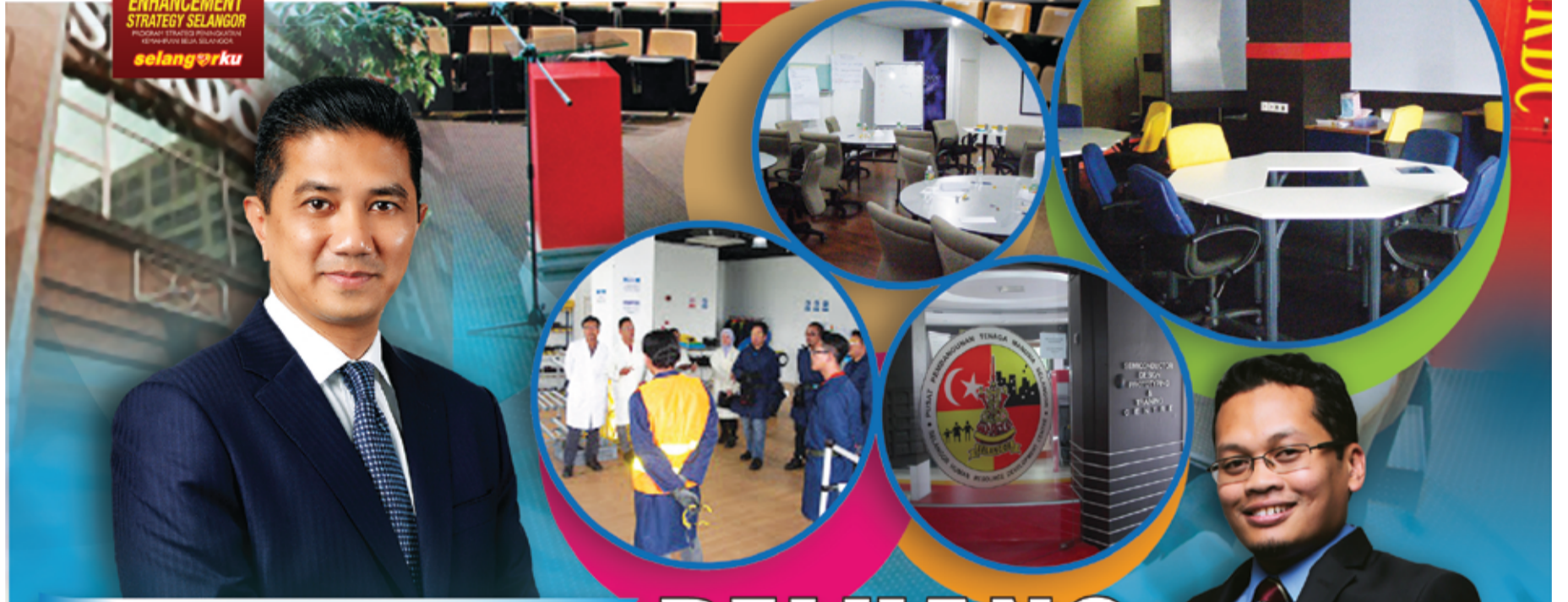
YAB Tuan Mohamed Azmin bin Ali Dato' Menteri Besar Selangor

YES : YOUTH ENHANCEMENT STRATEGY SELANGOR (Program Strategi Peningkatan Kemahiran Belia Selangor)