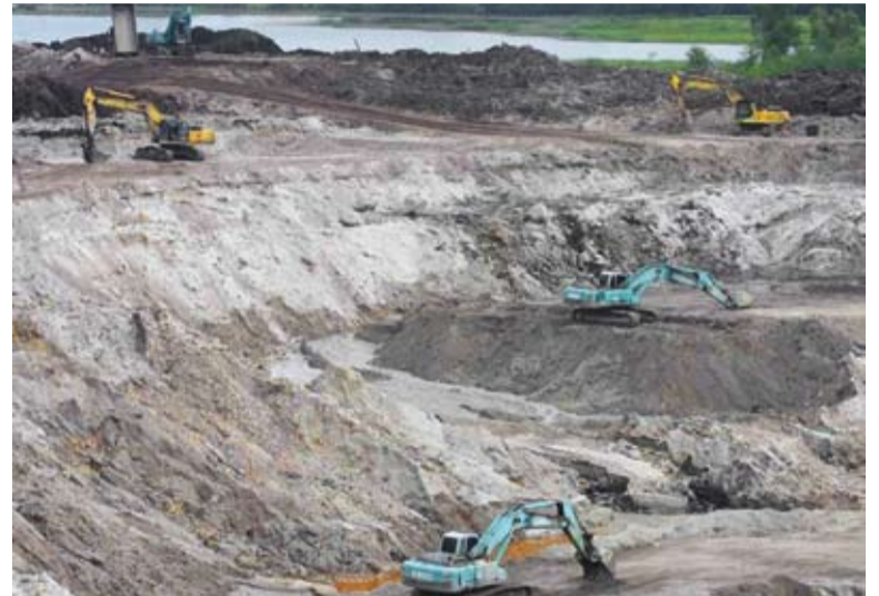
Kumpulan Semesta Sdn Bhd (KSSB) menyumbang dividen berjumlah RM44.5 juta

"Garis panduan diputuskan untuk pelaksanaan pendekatan ini ketat dan telus supaya perjalanan pengurusan lebih bertanggungjawab kerana ia milik rakyat," katanya menjawab soalan tambahan daripada Yeo Bee Yin (DAP-Damansara).