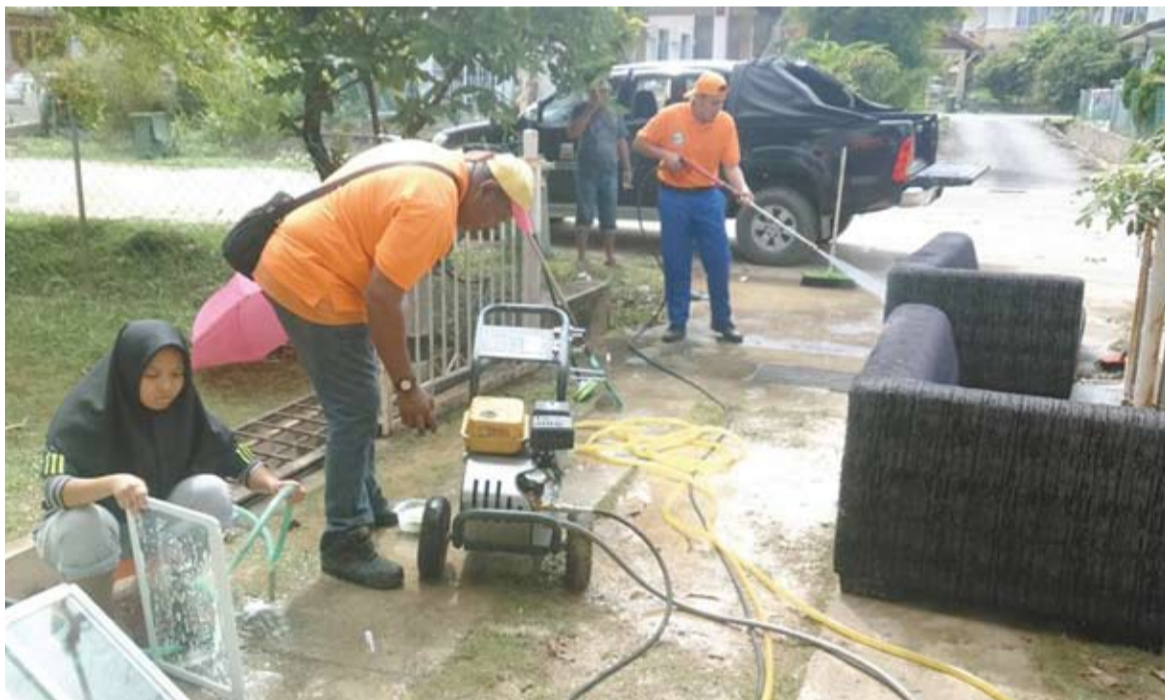
PANTAS Selangor menggerakkan pasukannya memberikan bantuan kepada mangsa banjir di Puncak Alam

ini kali kedua berlaku dalam tahun ini. Kita mahu semua pihak terbabit dapat menyegerakan kerja pengorekan dan pembersihan," katanya.