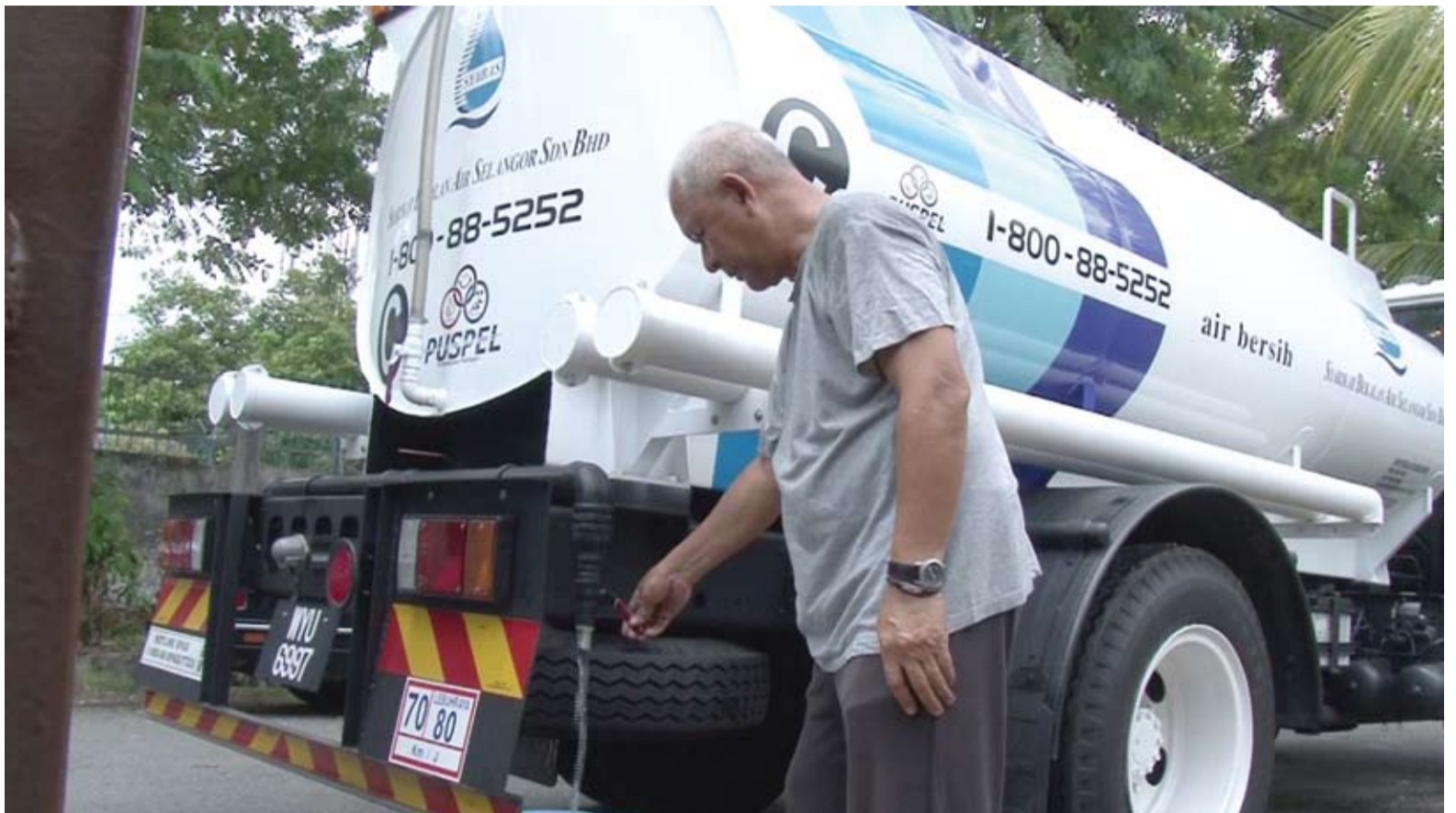
Air Selangor sudah melihat peruntukan untuk memperbaiki kawasan yang selalu mengalami paip pecah supaya gangguan berkurangan

SPAN kemudiannya akan mengadakan perbincangan bersama beberapa pihak dan selepas itu sama pelan kami diluluskan atau tidak, Kerajaan Negeri perlu me-