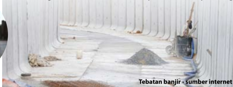
Tebatan banjir

Selangor dijangka menerima taburan hujan luar biasa antara 500 hingga 800 milimeter sehingga hujung tahun ini.