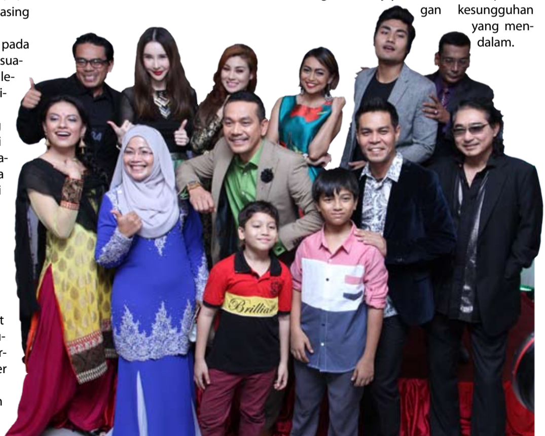
Antara barisan pelakon dan kru produksi ketika tayangan perdana Chowrasta

Apa yang lebih penting adalah intipati utama yang cuba diketengahkan pengarah dalam Chowrasta iaitu bagaimana penindasan harus dihapuskan tidak kira bangsa dan kejayaan boleh dikecapi dengan kesungguhan yang mendalam.