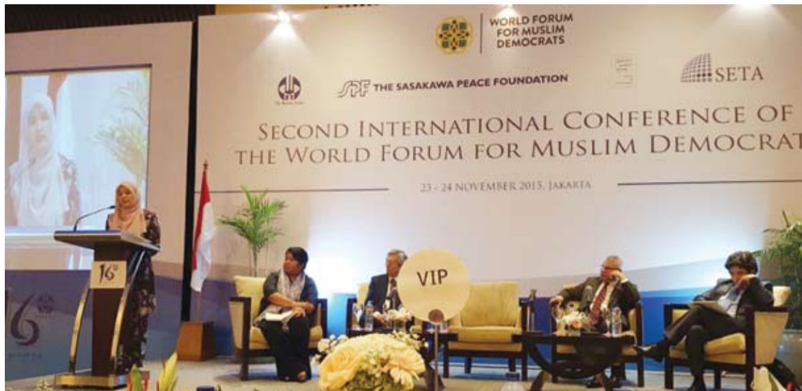
Persidangan Forum Dunia untuk Muslim Demokrat kali kedua di Hotel Le Meridien, Jakarta

Mohamed Azmin kemudian mengadakan kunjungan hormat ke Pejabat Gabenor Jakarta di Jalan Medan Merdeka Selatan, Gambir, Indonesia.