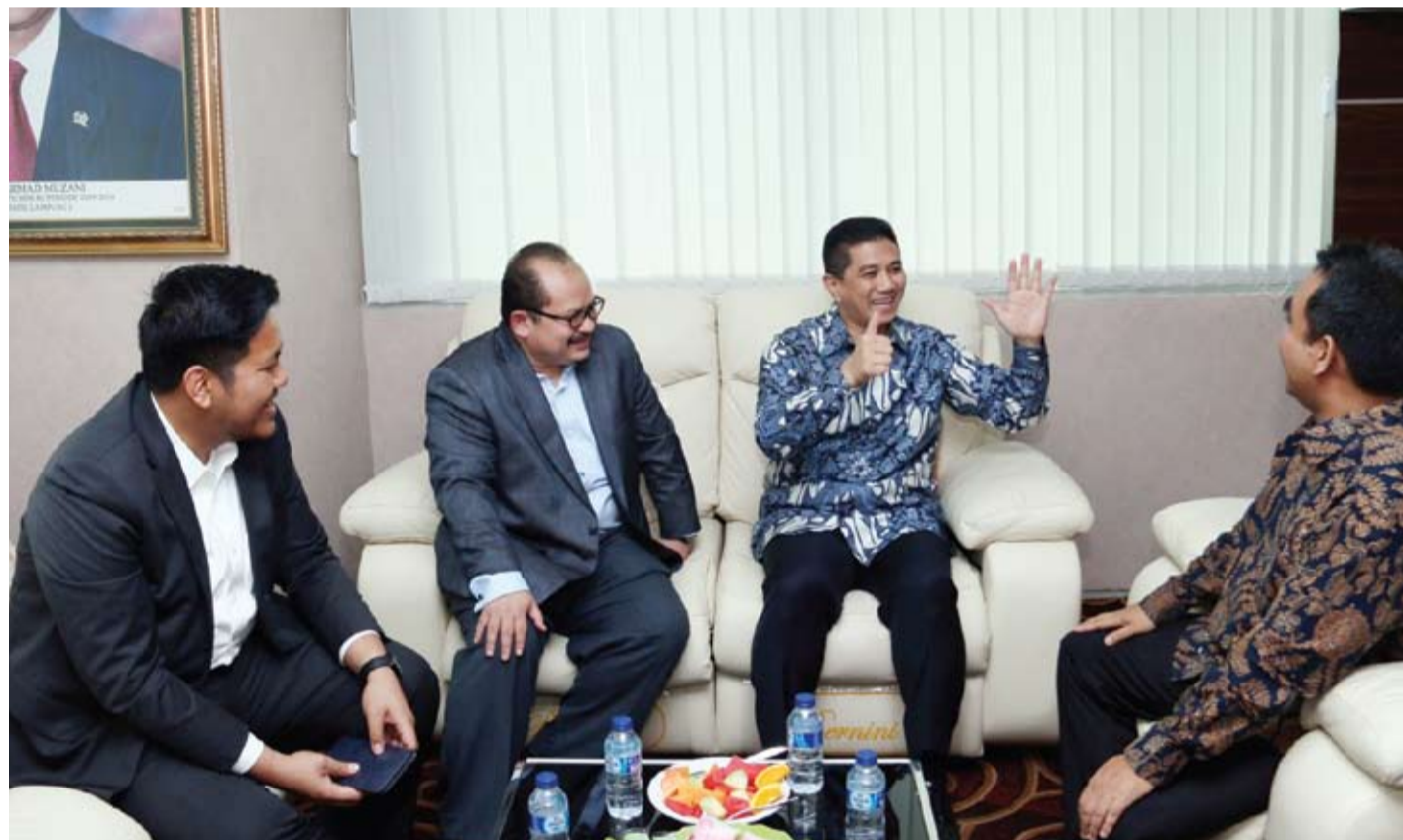
Mohamed Azmin sempat berjenaka dengan Ketua Paksi Parti Garindra, H Ahmad Muzani