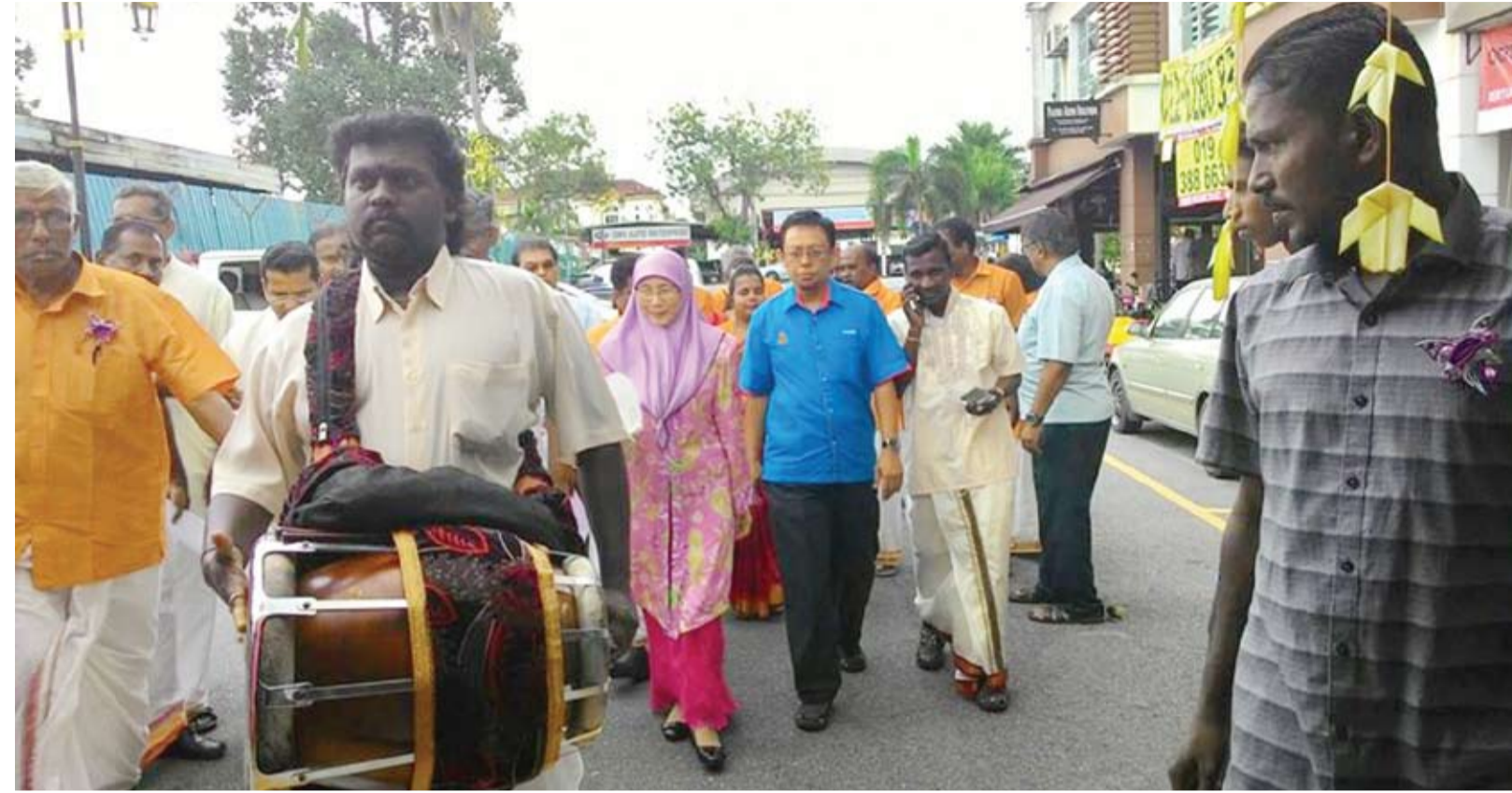
▶ Adun Kajang, Datuk Seri Dr Wan Azizah Wan Ismail merasmikan sambutan Deepavali DUN Kajang