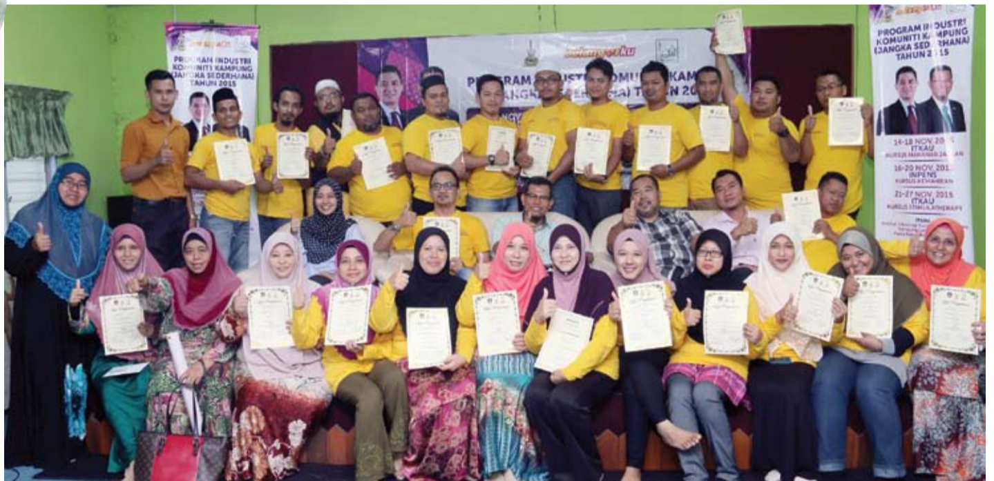
Sebahagian usahawan desa yang menerima sumbangan Jangka Sederhana RM8,000 setiap seorang

KUALA KUBU BAHRU - Seramai 95 peserta kursus Program Industri Komuniti Kampung (Jangka Sederhana) 2015 menerima peralatan memulakan perniagaan bernilai RM8,000 setiap seorang selepas menamatkan kursus.