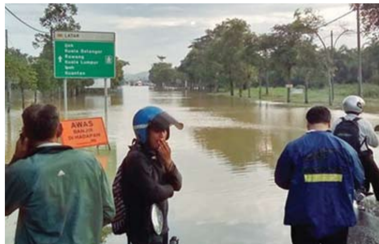
Gambar sumber internet

Pada November 2014, kadar taburan hujan adalah 120mm sehingga 250 mm dan kadar taburan hujan itu mencecah kepada 320mm bulan ini.