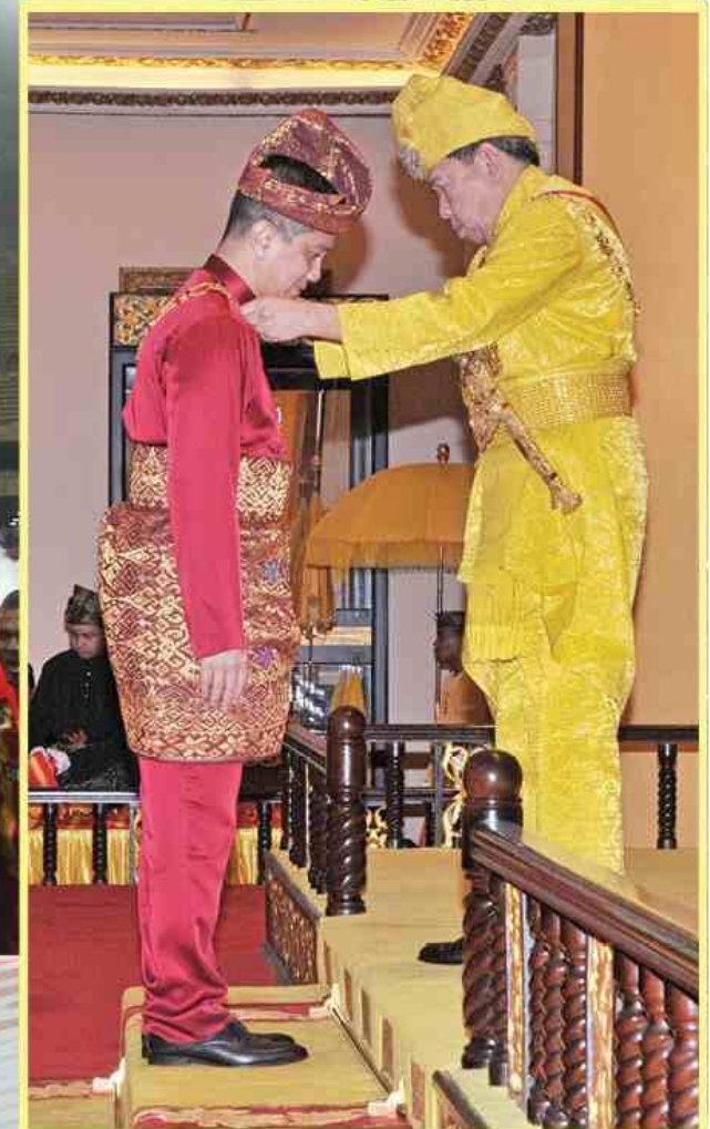
DYMM SULTAN SHARAFUDDIN IDRIS SHAH menganugerah Darjah Kebesaran Seri Paduka Mahkota Selangor (S.P.M.S.), Darjah Kelas Pertama yang membawa gelaran Dato' Seri kepada Menteri Besar, Mohamed Azmin Ali sempena Hari Keputeraan ke-70 baginda di Balairung Seri, Istana Alam Shah, pada 12 Disember lalu