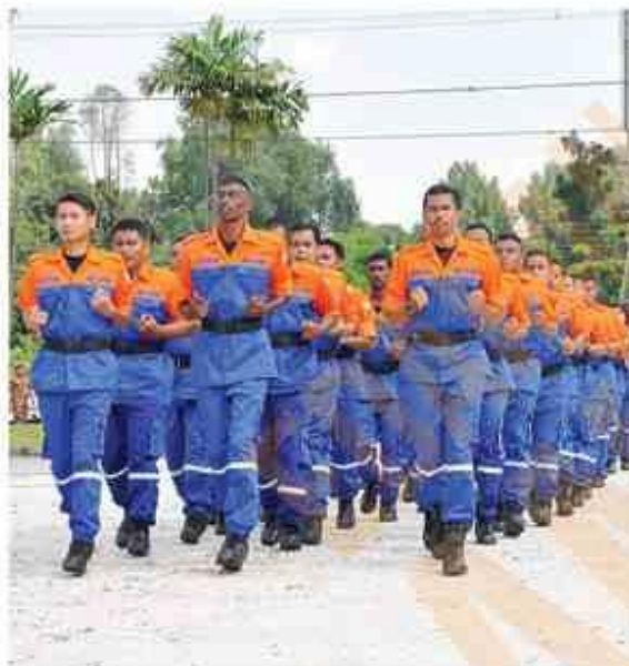
Pasukan PANTAS PBT sedang membuat persiapan fizikal sebelum turun padang membantu mangsa banjir

"Mudah-mudahan lebih banyak lagi inisiatif dan usaha yang dapat dilakukan bagi memperbaiki perjalanan hidup golongan OKU pada masa akan datang."