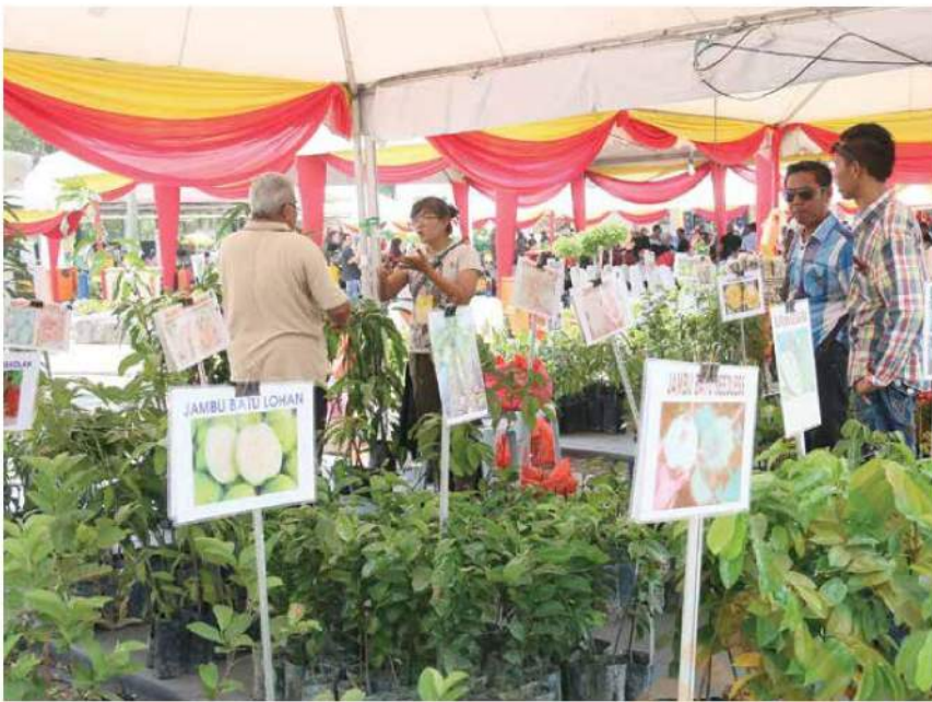
Pelbagai tanaman buah-buahan tempatan dijual pada harga berpatutan