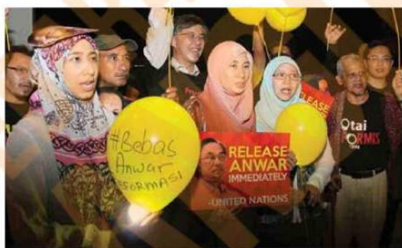
Pelbagai pihak mendesak agar Anwar Ibrahim dibebaskan segera

war menuntut kerajaan membenarkan Anwar melakukan pembedahan di luar negara kerana tidak percaya kepada sistem negara ini yang berterusan menafikan rawatan disyorkan doktor pakar.