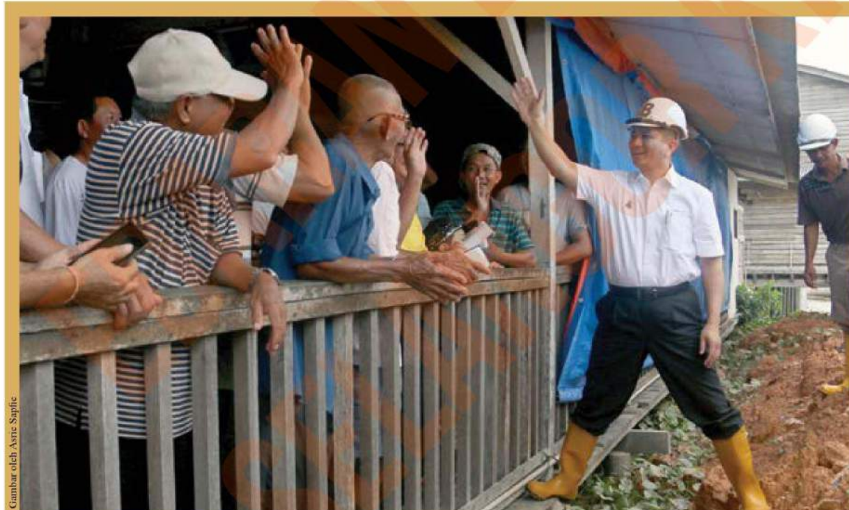
Mohamed Azmin bertanya khabar penduduk kawasan jeti nelayan Tanjung Sepat 2 ketika merasmikan Majlis Pecah Tanah Jeti Baru bagi mengakhiri masalah jeti yang berlarutan di kawasan itu lebih 20 tahun.

Antara projek menangani masalah banjir adalah di Johan Setia, Telok Gadong, Pandamaran dan Kapar selain penambahbaikan sistem saliran di Kampung Melayu Sungai Buloh dan Kampung Tasik Permai, Hulu Langat.