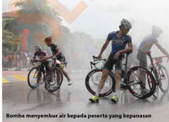
Bomba menyembur air kepada peserta yang kepanasan

Acara itu mendapat penyertaan lebih 800 peserta yang memerlukan mereka melalui Pulau Indah, Banting, Bandar Enstek, Sepang dan kembali semula ke Pulau Indah.