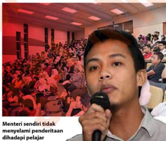
Menteri sendiri tidak menyalami penderitaan dihadapi pelajar

"Harga teh ais, nasi lemak, teh oh ais dan mee segera naik dalam tempoh 10 tahun. Dalam tempoh 10 tahun kebelaka-