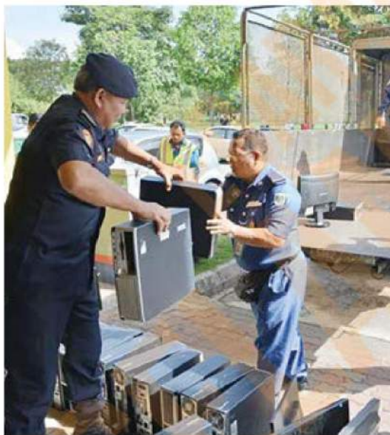
Penguatkuasa merampas pelbagai jenis barangan.

"Sikap menjaga kebersihan di ruang niaga masing-masing sangat penting bagi mengelak jangkitan penyakit yang boleh menjejaskan kesihatan pengunjung di samping mewujudkan suasana ceria di pasar berke-