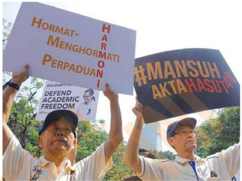
Rakyat berkumpul di ibu kota membantah pelaksanaan Akta Hasutan