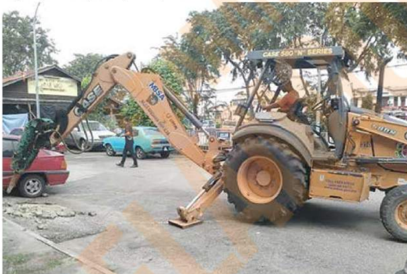
MBSA giat menjalankan Operasi Pecah tanjakan yang disalahgunakan bagi tujuan perniagaan.

Dalam tempoh sama, sebanyak 88 kompaun atas kesalahan membiak jentik-jentik Aedes dikeluarkan dengan kadar RM500 setiap satu.