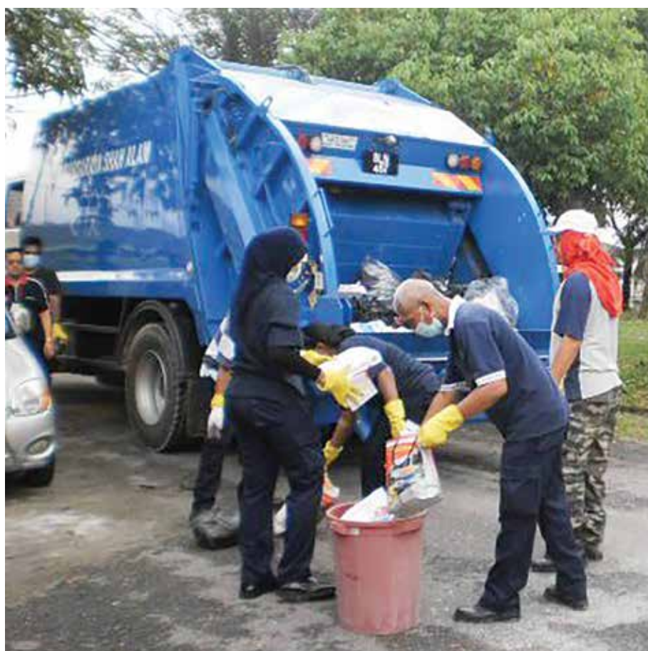
Masalah sampah mendapat respon pantas pihak berkuasa tempatan

"Tindakan itu membuktikan Kerajaan Selangor mampu bertindak pantas dan berkesan, malah Mohamed Azmin juga adalah pemimpin sejati