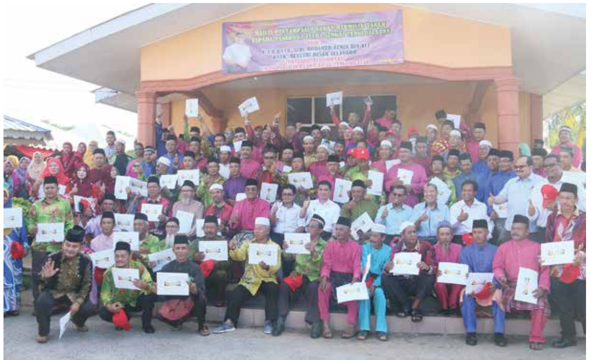
Penyerahan hak milik tanah peneroka Felda Sungai Tengi

Bagaimanapun projek itu gagal diteruskan ekoran kemelesetan ekonomi melanda negara pada 1998 sehingga bayaran pampasan dijanjikan tidak dapat ditunaikan.