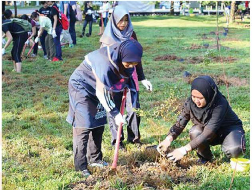
Peserta mengambil bahagian menanam pokok sempena program Shah Alam Trees For Life 2016

"Program ini menerapkan budaya kerja secara sukarela kepada peserta khususnya kepada pelajar dan generasi muda," katanya.