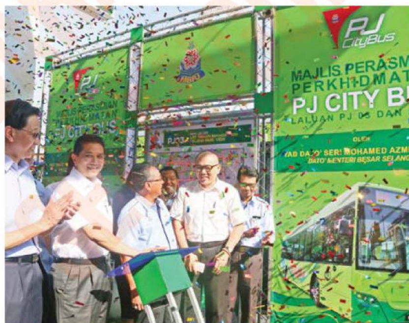
Menteri Besar, Dato' Seri Mohamed Azmin Ali merasmikan Bas Percuma 'PJ City Bus' laluan PJ03 dan PJ04

majlis perasmian PJ City Bus PJ03 dan PJ04 yang disempurnakan Menteri Besar, Dato' Seri Mohamed Azmin Ali di Stesen LRT Taman Bahagia, pada 1 Januari lalu.