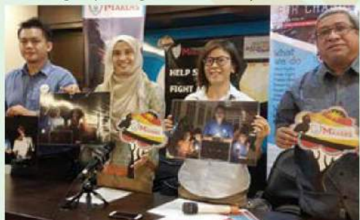
My Changemakers bantu pembangunan kawasan pedalaman Sarawak

"Menceriakan sebahagian 250,000 rakyat Sarawak yang tidak mendapat akses tenaga elektrik," katanya.