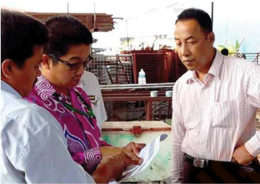
YDP MPK turun serbu