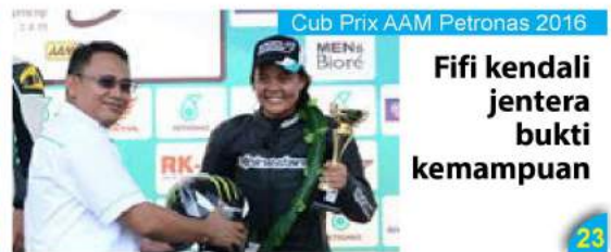
Fifi kendali jentera bukti kemampuan