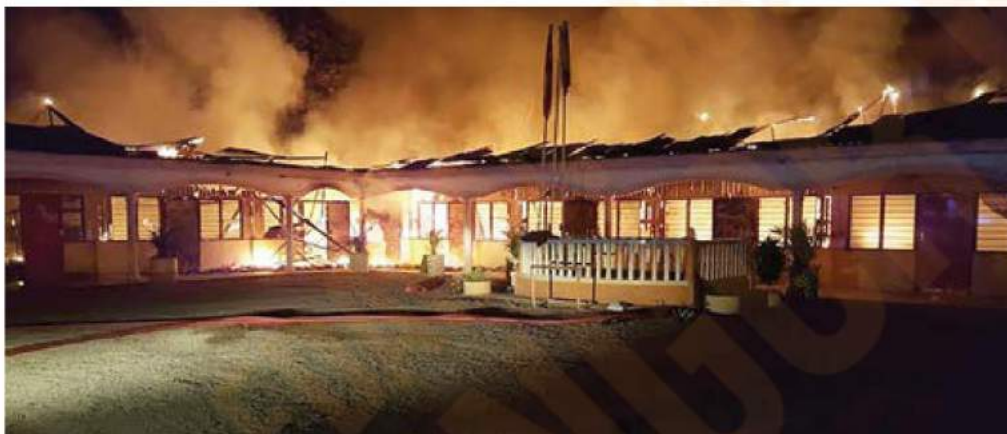
Keadaan Maahad Tahfiz Darul Itqan yang hangus dijilat api dengan kerugian dianggarkan RM300,000

"Kita juga mempertimbangkan sistem penghawa dingin di surau bersesuaian di kawasan berkenaan setelah meneliti beberapa faktor keperluan semasa," katanya.