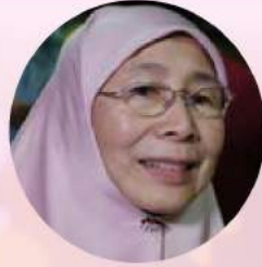
Datuk Seri Dr Wan Azizah Wan Ismail Presiden KEADILAN / ADN Kajang

Saya akan terus menyokong betapa perlunya penglibatan wanita sebagai pembuat keputusan utama untuk mana-mana organisasi.