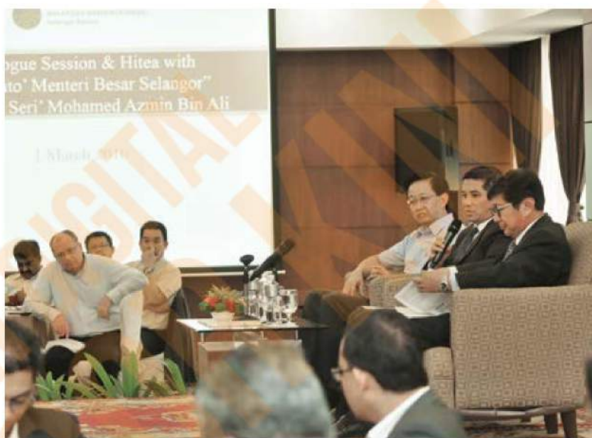
Mohamed Azmin memberi penjelasan berkenaan matlamat menuju Smart Selangor

"Selangor juga sudah melaksanakan beberapa program baru untuk anak muda dengan kerjasama Selangor Human Resource Development Centre (SHRDC) melalui program latihan seperti Internship for High Impact Talent dan Youth Enhancement Strategic Selangor (YES) ," katanya.