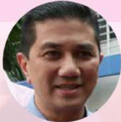
Dato' Seri Mohamed Azmin Ali Menteri Besar

WANITA mempunyai ciri semula jadi dalam memahami hati dan perasaan dan juga kepimpinan yang baik. Ia akan menjadi lebih mudah jika kaum lelaki membantu dan menyokong penglibatan wanita dalam menyertai politik.