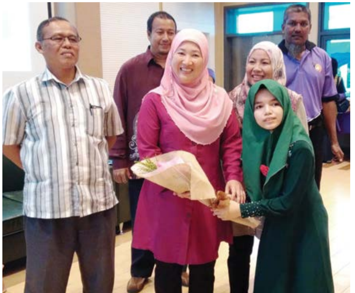
Daroyah menerima jambangan bunga tanda penghargaan

Program berkenaan dilaksanakan selama tiga hari dengan memberi tumpuan kepada kemahiran asas penggunaan bahasa isyarat bagi penjawat awam.