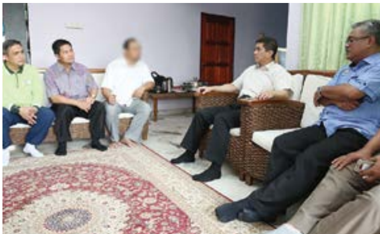
Mohamed Azmin menziarahi kediaman mangsa dilempar 'molotov cocktail' di Bandar Baru Bangi

"Tetapi saya gembira apabila bertemu dengan mangsa, beliau memberitahu supaya tidak bimbang kerana ugutan ini menguatkan semangatnya untuk bertindak