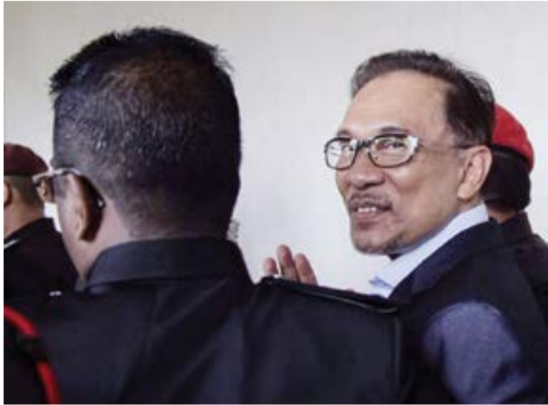
Anwar sempat memberikan senyuman ketika diiringi keluar dari Mahkamah Tinggi Kuala Lumpur pada 4 April lalu

dan aturan menurut maqasid syariah iaitu keutamaan sistem keadilan," katanya yang disampaikan melalui isterinya, Datuk Seri Dr Wan Azizah Wan Ismail dalam satu paparan di Facebook pada 5 April lalu.