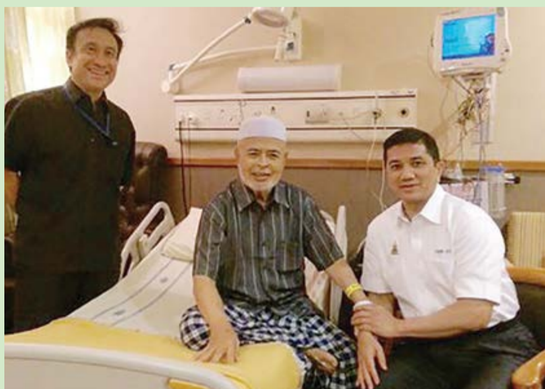
Menteri Besar, Dato' Seri Mohamed Azmin Ali meluangkan masa menziarahi Mursyidul Am PAS, Datuk Dr Haron Din di Institut jantung Negara (IJN) pada 3 April lalu dan mendoakan kesihatannya kembali pulih