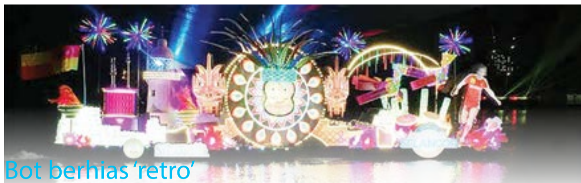
Bot berhias 'retro'