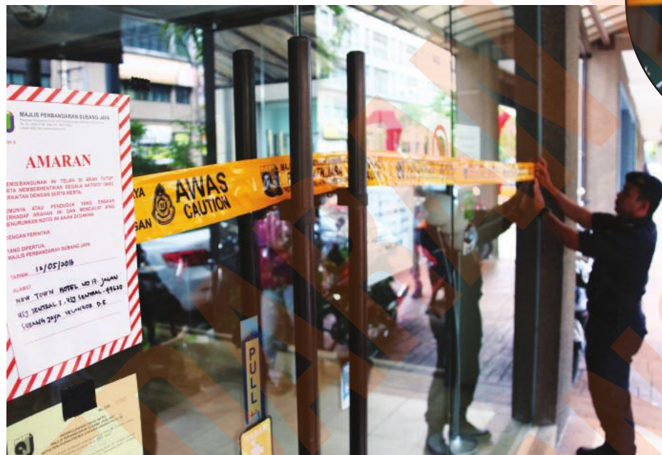
◀梳邦再也市议会执法人员查封违法营业的旅馆。

（巴生讯）巴生市议会加紧埋伏以取缔“垃圾虫”，截至今年5月共扣查32辆涉嫌乱倒垃圾恶行的交通工具，并发出总额近3万令吉的罚单。