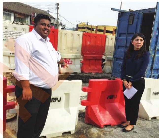
▲拉吉夫(左)和杨美盈视察灵市排污提升计划的施工情况。

另一名座上嘉宾雪州行政议员甘纳峇迪劳, 当晚也宣布拨款5000令吉充当开封府的建庙基金。