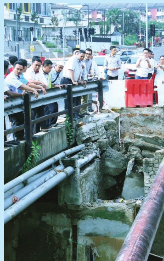
▲再迪与官员巡视武吉路桥梁和河堤崩塌的情况。

“有关豪雨也导致桥边的一座人行道遭河水冲断，河堤也崩塌，不过武吉路桥仍可安全使用。所以，当局将利用第11大马计划下的剩余拨款，视需要提升河道。”