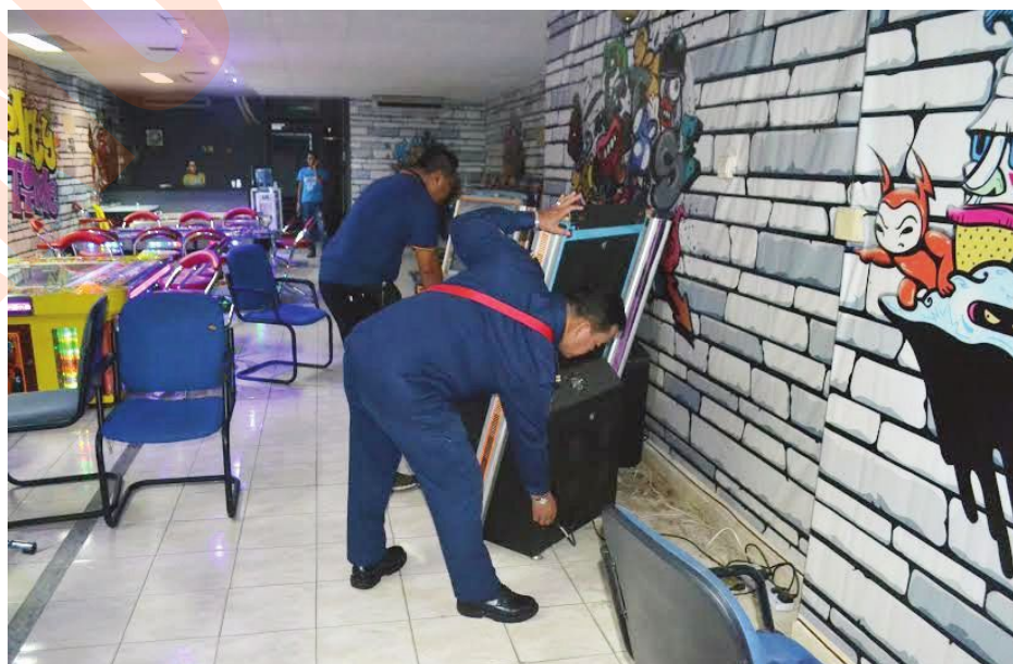
▲安邦再也市议会执法人员充公违例单位的电脑器材。

“市议会将持续严厉取缔这些垃圾虫，也希望民众能成为市议会的耳目一旦发现垃圾虫的行踪可向市议会提供情报，电话：1-800-882-3826、03-3374 884。”