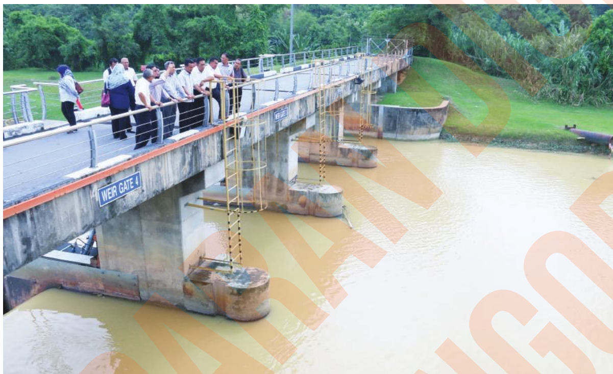
▲再迪等一行人巡视贞德拉希里尔水泵站。

雪州大臣拿督斯里阿兹敏阿里在2016年财政预算案中宣布，由于冷岳河（2）滤水站计划将延迟至2019年竣工，因此州政府料自资8亿令吉承建两座新滤水站，以应付2017年至2019年的水供短缺问题。