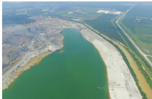
▲雪州混合动力增强系统的首阶段工程，已在2015年11月完工和启用。

“在雪兰莪河畔，混合动力增强系统和周遭的蓄水池平均可输送8亿公升至10亿公升的生水，因此可减少雪河水坝和双溪丁宜水坝的释水量。”