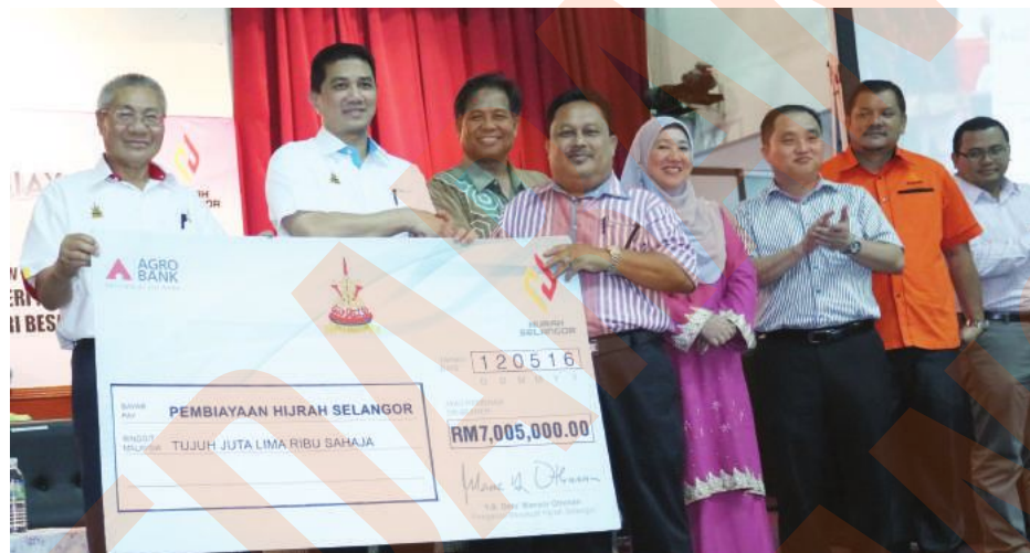
▲阿兹敏(左2)颁发雪州综合微型贷款计划的模拟支票给受惠的商家代表。

他说,小商家一般上难以向银行取得贷款,何况一日不解决资金短缺问题,这些小商家恐都无法投身创业行列或扩充营业,改善生活情况,所以综合微型贷款计划适时解决了商家的融资难题。