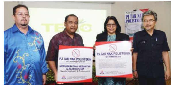
▲八打灵再也市政厅从今年9月起落实禁用保丽龙措施。

“为更有效宣导禁用保丽龙的从事，市政厅将在公共场所、学校和熟食中心置放指南告示牌和条规等。”