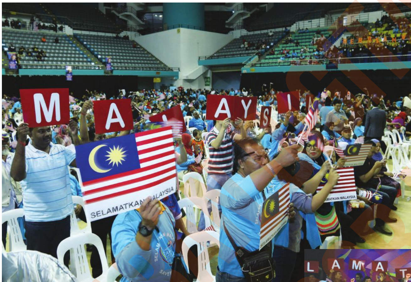
▲大马人民受促挺身而出，支持国家改革之路。