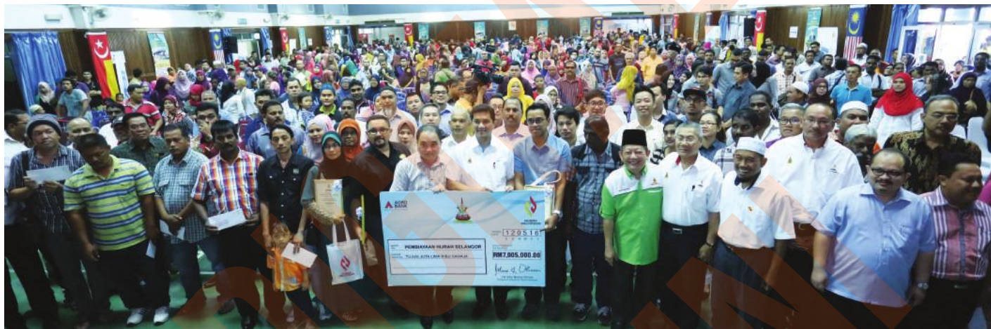
▲雪州政府宣布额外拨款1100万令吉的综合微型贷款给沙白县商家,图为阿兹敏与沙白县的受惠商家合照。

“所以,州政府通过综合微型贷款计划为有需要的小商家提供零利息的贷款便利,协助更多小商家创业或扩充生意规模,期望改善他们的家庭收入,扩大雪州的中等收入阶级。”