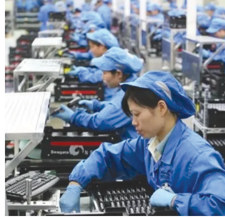
கட்டுப்படுத்துவதற்காக இந்த நடவடிக்கை மேற்கொள்ளப்படுகிறது என்றார் அவர்.

தற்போது கோவிட்-19 மருத்துவமனைகளில் காணப்படும் நோயாளிகளின் எண்ணிக்கையை