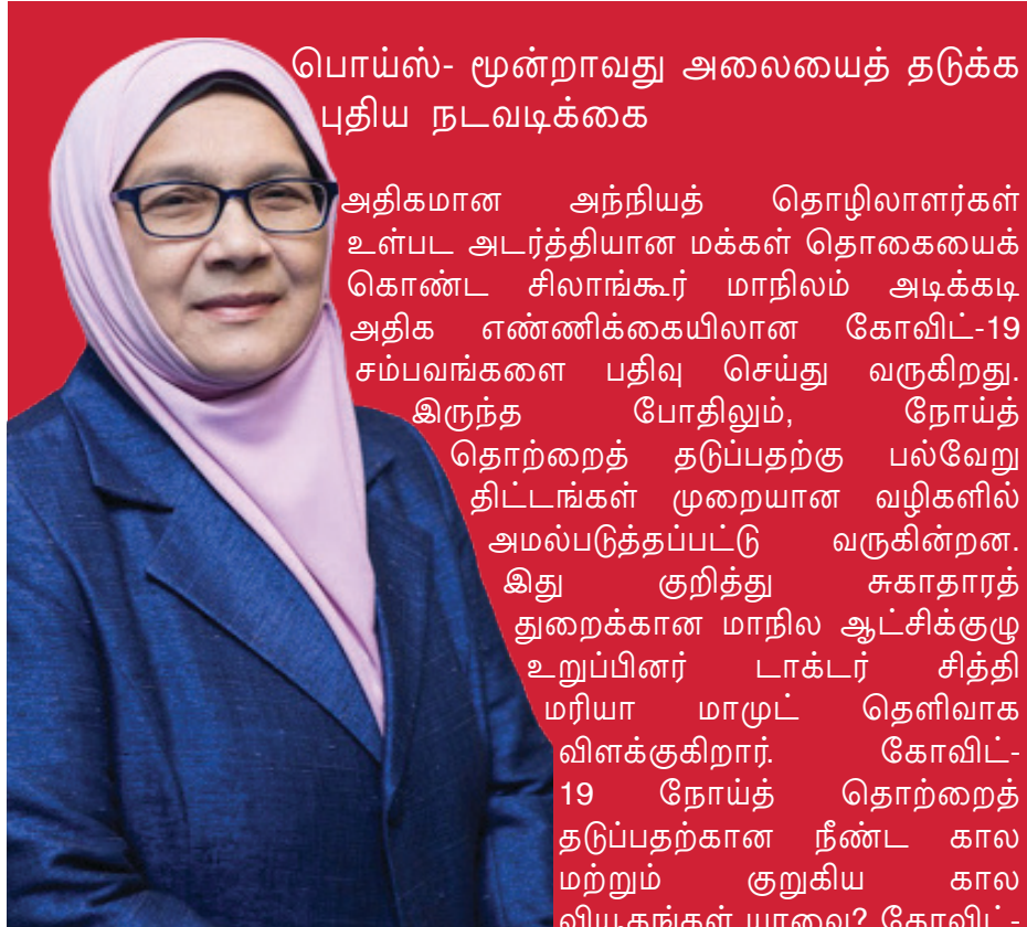
பொய்ஸ்- மூன்றாவது அலையைத் தடுக்க புதிய நடவடிக்கை