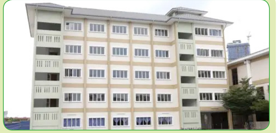
தமிழ்ப்பள்ளியின் முதல் மாணவர் தங்கும் விடுதி

நாடு சுதந்திரத்திற்கு பின் வேகமாக சரிந்துவந்த தமிழ்ப்பள்ளிகளின் எண்ணிக்கை, இப்பொழுது வளர தொடங்கி விட்டது. அது மிட்லன்ஸின் வெற்றி மட்டுமல்ல இந்நாட்டு இந்தியர்களின், தமிழ்ப்பள்ளிகளின், தாய்மொழிக்கல்வியின் வெற்றி!