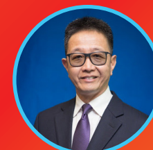
லத்தோ தெங் சாங்கி கிம்