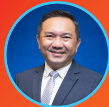
இஸ் ஸ் ஹான்