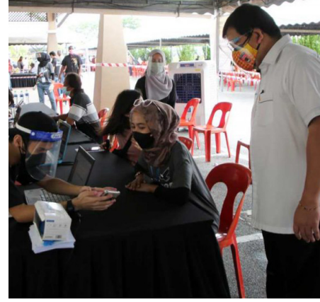
கோலாலம்பூர் மருத்துவமனை, கிள்ளான், துங்கு அம்புவான் ரஹிமா மருத்துவமனை, ஷா ஆலம் மருத்துவமனை, மலாக்கா மருத்துவமனை, கோத்தா

மற்றும் உன்னத வாழ்வுக்கு சிறப்பாக சேவையாற்றும் மருத்துவ சேவைக்கு நாடு அளிக்கும் அங்கிகாரத்துக்கான அளவு கோளாக பார்க்க வேண்டும். இம்மாதம் 26ஆம் தேதி நாடு தழுவிய அளவில் மறியலில் ஈடுபட்டனர். இந்த மறியலில் இருபதுக்கும் மேற்பட்ட அரசாங்க மருத்துவமனைகளில் பணியாற்றும் மருத்துவர்கள் பங்கேற்றனர். ஒப்பந்த மருத்துவர்களுக்கு நிரந்தர பணி நியமனம், நிரந்தர மருத்துவர்களுக்கு இணையான சம்பளம், சலுகைகள் மற்றும் விடுமுறை வழங்கப்பட வேண்டும் என்ற கோரிக்கைகளை முன்வைத்து மருத்துவர்கள் இந்த மறியல் போராட்டத்தை நடத்தினர்.