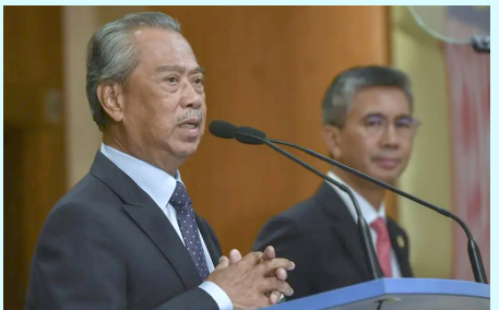
கோலாலம்பூர் - மலேசியாவின் நிதிப் பற்றாக்குறை இந்த ஆண்டு அதன் மொத்த உள்நாட்டு உற்பத்தியில் 6.5 முதல் 7 முதல் ஏழு விழுக்காடு வரை உயரும் என்று எதிர்பார்க்கப்படுகிறது. நிதியமைச்சர் டத்தோ ஸ்ரீ துங்கு ஜஃப்ரூல் அப்துல் அஜீஸ் கூறுகையில், மக்களின், நாட்டின் பொருளாதார தேவைகள் அதிகரிக்கும் போதெல்லாம்

அதனை பூர்த்திச் செய்ய அரசாங்கம் தயாராக உள்ளது. "எங்களுக்கு ஒரு பற்றாக்குறை உள்ளது, அது ஏழு சதவீதத்தை எட்டும். பற்றாக்குறையின் அளவு கடன் வாங்கும் மற்றும் திரும்ப செலுத்தும் திறன் மற்றும் இருப்புக்களின் அளவை பொறுத்தது. "மலேசியா பொருளாதாரம் A- மதிப்பிடப்பட்டதாக இருந்தாலும், எங்கள் நிதி இருப்புக்களைப் பொறுத்தவரை, நாங்கள் பல A- மதிப்பிடப்பட்ட நாடுகளை விட சிறியவர்கள். ஒரே வித்தியாசம் என்னவென்றால், எங்களுக்கு வலுவான வளர்ச்சி வாய்ப்புகள் உள்ளன, "என்று அவர் தென் சீனா மார்னிங் போஸ்டுக்கு (எஸ். சி.எம்.பி) அளித்த பிரத்யேக பேட்டியின் போது கூறினார்.