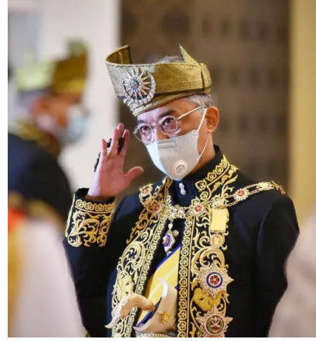
அவசரகாலம் ரத்து செய்யப்படுவது தொடர்பான அனைத்து பரிந்துரைகளும் நாடாளுமன்றத்தில் தாக்கல்