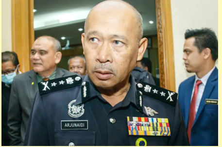
கோலாலம்பூர் - சிலாங்கூர் மற்றும் கோலாலம்பூரில் ஒப்பந்த மருத்துவர்கள் கடந்த திங்கள் கிழமை நடத்திய அமைதி மறியல்