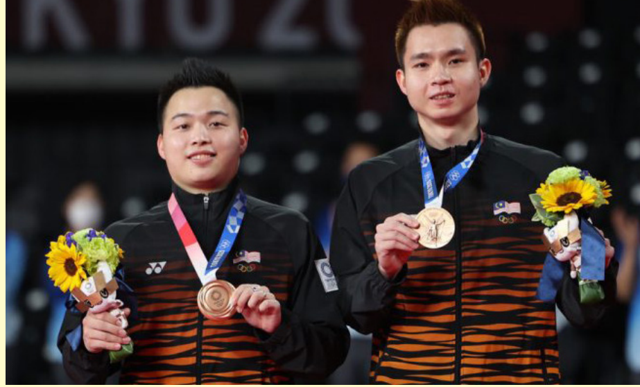
காரர்களுக்கு உத்வேத்தையும் தன்னம்பிக்கையையும் அளிக்கும் என்பதோடு மலேசியா மேலும் அதிக பதக்கங்களைப் பெறுவதற்குரிய வாய்ப்பினையும் ஏற்படுத்தும் என்று அவர் தெரிவித்தார். உலகின் முதல் மற்றும் இரண்டாம்

இந்த இரட்டையர்களின் வெற்றி நமக்கு பெருமையை அளிக்கிறது. அவர்களின் இந்த வெற்றி மற்ற ஆட்டக்