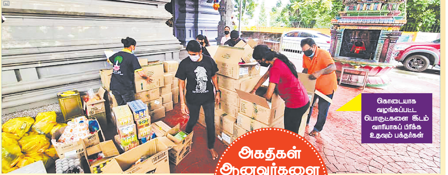
கொடையாக வழங்கப்பட பொருட்களை இடம் வாரியாகப் பிரிக்க உதவும் பக்தர்கள்

இந்த உணவுப் பொருள்கள் எமராட்டு தமிழ்ப்பள்ளியில் செயல்பட்ட வெள்ள நிவாரண மையம், ஸ்ரீ மூடா, ஹைக்கோம், புக்கிட் லஞ்சோங், ஆலம் மேகா, கம்போங் ஜாவா ஆகிய பகுதிகளுக்கு அனுப்பினோம். இந்தப் பணி தொடர்ச்சியாக ஏழு நாட்களுக்கு நடைபெற்றது. இந்த உணவுப் பொருள்களைத் தயாரிக்கும் பணியில் 30 பேரும் அவற்றை விநியோகிக்கும் பணியில் 60 பேரும் ஈடுபட்டனர்.