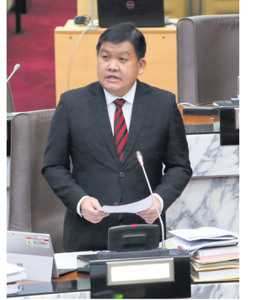
பயனீட்டைக் குறைப்பதற்கான பிரசார நடவடிக்கைகளுக்குப் பயன்படுத்தப்படும் என்றார் அவர்.

தற்போது நெகிழிப் பைகளுக்கு வார்த்தக மையங்களில் விதிக்கப்படும் 20 காசு கட்டணம் போதுமானதாகும். இவ்விஷயத்தில் மக்களுக்கு அதிக சுவையை ஏற்படுத்த நாங்கள் விரும்பவில்லை. வசூலிக்கப்பட்ட இந்த தொகை நெகிழிப் பைகளின்