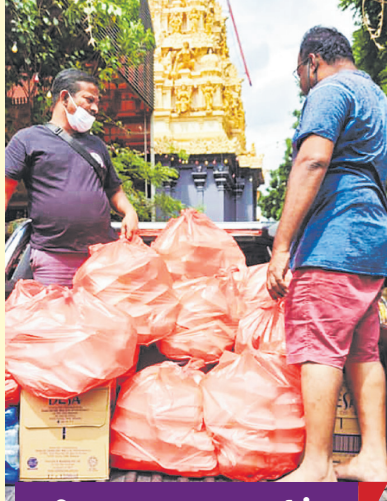
உணவு படபுவாடாவில் பக்தர்கள்

ஆலயங்களும், தமிழ்ப்பள்ளியும் இச்சமுதாயத்தின் அடையாளமென எண்ணியவர்களை வியக்க வைத்த ஓப்பற்ற உள்கடமைப்பு. உயர்வுக்கும் ஓற்றுமைக்கும் உயிர்நாடி என்பதை மீண்டும் நிரூபித்துவிட்டது.