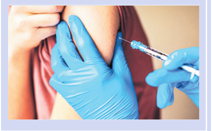
சிலாங்கூர் குடியிருப்பாளர்கள் தங்களுக்கு உடனடியாக ஒரு ஊக்க தடுப்பூசியைப் பெற நினைவூட்ட படுகிறார்கள்,சுஎன்று டத்தோஸ்ரீ அமிருடின் ஷாரி இன்று பேஸ்புக்கில் கூறினார். பிப்ரவரி 7 அன்று, சுகாதார அமைச்சர் கைரி ஜமாலுடின், 18 வயது மற்றும் அதற்கு மேற்பட்ட வயதுடைய சினோவாக்கின் முழு அளவைப் பெறுபவர்கள் முழுமையான தடுப்பூசி நிலை பராமரிக்க மார்ச் 1 ஆம் தேதிக்கு முன் ஊக்க தடுப்பூசியை எடுக்க வேண்டும் என்று தெரிவித்தார். அவ்வாறு செய்யத் தவறினால், தடுப்பூசி பெற்றதற்கான தகவல் மைசெஜாத்ரா செயளி பயன்பாட்டு சான்றிதழ் முழுமையடையாத தாகக் கருதப்படும் என்று முன்பு சுகாதார அமைச்சர் கூறியதை நினைவுறுத்தினார்.

637 பள்ளிகளின் உட்கட்டமைப்புக்கு உதவுவதற்காக RM2.4 கோடி நிதியை வழங்கினார். இந்த தொகையில் அகாமா ஆரம்ப பள்ளிக்கு RM98 லட்சம் (SRA), சீன தேசிய வகை ஆரம்ப பள்ளிக்கு RM90 லட்சம் மற்றும் தமிழ் ஆரம்ப பள்ளிகளுக்கு RM45 லட்சம் நிதியை உள்ளடக்கியது.