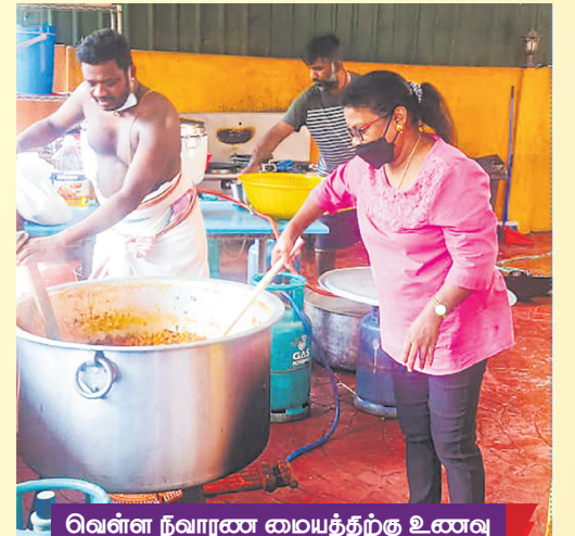
வெள்ள நிவாரண மையத்திற்கு உணவு தயார் செய்யும் கோத்தா கெமுனிங் ஆலயப் பக்தர்களில் சிலர்.

இப்பொருட்களை தினசரி சுமார் 2,500 பேர் என்ற அடிப்படையில் 25,000 பேருக்கு தொடர்ச்சியாக பத்துநாட்களுக்கு வழங்கப்பட்டது. இந்த திட்டத்திற்கான மலேசிய உற்பத்தியாளர் சம்மேளனம் 400,000 வெள்ளி மதிப்பிலான பொருள்களை எங்களுக்கு வழங்கியது என்று அந்த சம்மேளனத்தின்