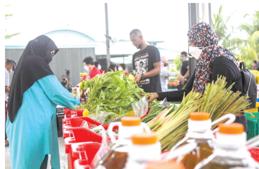
இதனிடையே, நெகிரி செம்பிலான் மாநிலத்தின் கிம்மாஸ் மற்றும் சிலாங்கூரின் கோலா லங்காட் செலாத்தான் பகுதிகளில் மேற்கொள்ளப்படவுள்ள சோள பயிரீட்டுத் திட்டம், மாநில அரசின் உணவுப் பொருள் விலைக்கட்டுப்பாட்டுத் திட்டத்தின் ஒரு பகுதியாக அமைவதாகவும் அமிருடன் குறிப்பிட்டார்.

அமல்படுத்தப்பட்டது. எனினும், உணவு விநியோகம் மற்றும் இறக்குமதி செய்யப்படும் உணவுப் பொருள்களை சார்ந்திருப்பதை தவிர்ப்பது குறித்து நாம் விரிவாக ஆலோசிக்க வேண்டியுள்ளது என்று அவர் மேலும் தெரிவித்தார்.