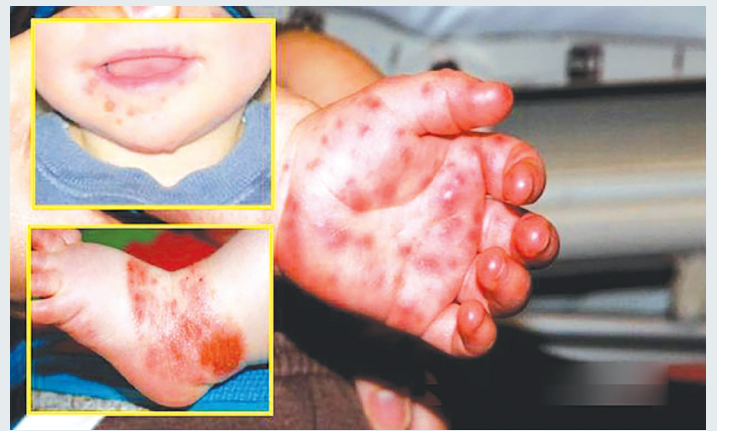
குறிப்பிட்ட மருந்துகள் அல்லது சிகிச்சைகள் இல்லை உடல் வெப்பநிலை மற்றும் வாயில் வலியைக் குறைப்பதற்கான சிகிச்சை வழங்கப்படும் பாதிக்கப்பட்ட குழந்தைகளுக்கு தொடர்ந்து தண்ணீர் குடிக்கக் கொடுங்கள் உடலின் நோய் எதிர்ப்பு சக்தி உருவாகும்போது 7-10 நாட்களுக்குள் நோய் தானாகவே குணமாகும்.

முக்கிய பங்கு வகிக்க வேண்டும்,” என்று அவர் கூறினார். விண்டாம் அக்மார் ஹோட்டலில் இன்று ஊடகவியலாளர்களுடன் சிலாங்கூர் சாரிங் மற்றும் ஹை-டெ நிகழ்ச்சி பற்றிய விளக்க அமர்வுக்குப் பிறகு அவர் இவ்வாறு கூறினார். இதற்கிடையில், மே 21 நிலவரப்படி மாநிலத்தில் மொத்தம் 13, 262 , கால் மற்றும் வாய் தொற்றுநோய் சம்பவங்கள் பதிவு செய்யப்பட்டுள்ளன, அவர்களில் 419 பேர் சிகிச்சைக்காக மருத்துவமனையில் அனுமதிக்கப்பட்டுள்ளனர். பெட்டாலிங்கில் அதிகப்பட்சமாக 4,155 சம்பவங்கள் பதிவாகியுள்ளன, அதைத் தொடர்ந்து உலு லங்காட் (2,608 சம்பவங்கள்), கோம்பாக் (2,112 சம்பவங்கள்), கோலா சிலாங்கூர் (1,277 சம்பவங்கள்), கிள்ளான் (1,122 சம்பவங்கள்), கோலா லங்காட் (732 சம்பவங்கள்), சபாக் பெர்னாம் (485 சம்பவங்கள்), உலு சிலாங்கூர் (407 சம்பவங்கள்) மற்றும் சிப்பாங் (364 சம்பவங்கள்).