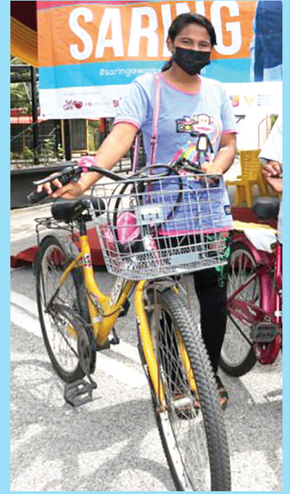
மேலும் கண்ணாடி அணிய அறிவுறுத்த பட்டேன், என்று அவர் கூறினார், அந்த சிறு வயது மாணவி.

சபாக் பெர்ணாம்:- கடந்த இரண்டு வாரங்களாக நீடித்து வரும் பார்வைக் குறைபாடுகள், வகுப்பில் கவனம் செலுத்துவது பாதித்தது, ஒரு டெனேஜ் சிறுமியை இலவச மருத்துவப் பரிசோதனை செய்யத் தூண்டியது.