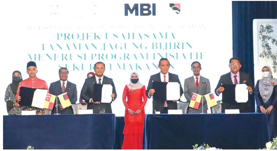
ஒரு டன்னுக்கு RM1,950 தற்போதைய சந்தை விலை படி ஆண்டுக்கு RM1.07 கோடி வருவாய் ஈட்ட முடியும்.