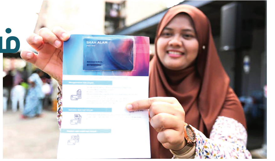
பெருங்குடல் புற்றுநோயைக் கண்டறிய ஆண்களுக்கு பரிசோதனையை விரிவுபடுத்துவது உட்பட பொதுமக்களுக்கான சுகாதார முயற்சிகளையும் ஐ.எஸ்.பி திட்டம் மேம்படுத்தி வருகின்றனர்