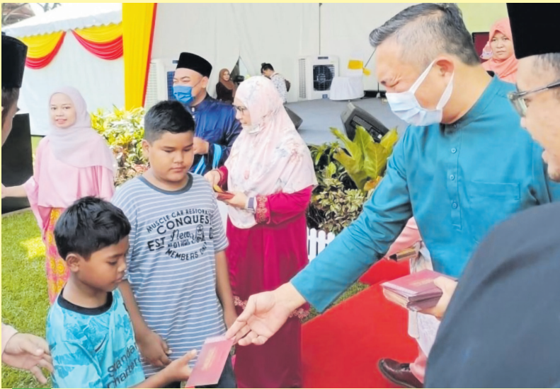
கின்ராரா சட்டமன்ற உறுப்பினரும் மாநில ஆட்சிக்குழு உறுப்பினருமான இங் ஹான் சிறுவர்களுக்கு டயர் ராயா வழங்கினார்