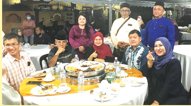
காஜாங் சட்டமன்ற உறுப்பினரும் மாநில ஆட்சிக்குழு உறுப்பினருமான ஹீ லோய் சியான் காஜாங் மக்களுடன் உணவருந்துகிறார்