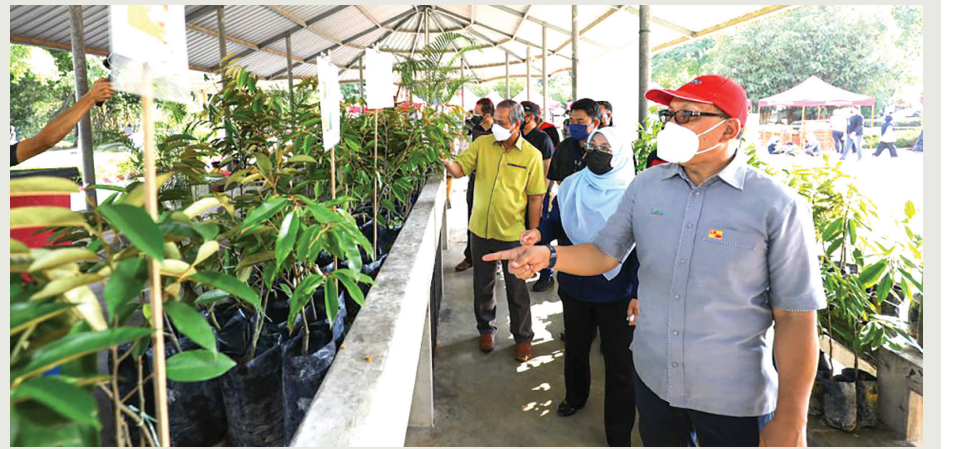
இந்த நிகழ்வில் விவசாயம் சார்ந்த தொழில்நுட்ப அம்சங்கள் வருகையாளர்களுடன் பகிர்ந்து கொள்ளப்படும். மேலும், இங்குள்ள விற்பனை மையங்களின் மூலம் குறைந்த விலையில் விவசாயப் பொருள்கள் விற்கப்படும் என்று அவர் மேலும் தெரிவித்தார். விவசாயத் துறைக்கான ஆட்சிக்குழுவின் மூலம் இந்த ஜெலாஜா சிலாங்கூர் அக்ரோ திட்டத்தை மாநில அரசு இன்று தொடங்கி நான்கு நாட்களுக்கு சென்ட்ரல் ஐ-சிட்டியில் நடத்துகிறது.

அதிகளவிலான இளைஞர்கள் மற்றும் மகளிரை விவசாயத் துறையின்பால் ஈர்ப்பதை இந்த திட்டம் முதன்மை இலக்காக கொண்டுள்ளது. அதே சமயம், உற்பத்தியாளர்கள், வணிகர்கள் மற்றும் பயனீட்டாளர்களுக்கிடையே வர்த்தக ஒருங்கமைப்பை உருவாக்குவதும் இதன் நோக்கங்களில் ஒன்றாகும் என்றார் அவர்.