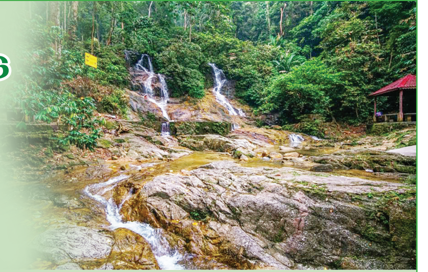
ஊராட்சி மன்றங்கள், சுற்றுலா, கலை,கலாசார அமைச்சு மற்றும் டூரிசம் சிலாங்கூர் போன்ற தரப்பினரின் ஒத்துழைப்பை தாங்கள் எதிர்பார்ப்பதாகவும் அவர் சொன்னார்.

அவர் குறிப்பிட்டார். உள்நாட்டில் மற்றுமின்றி வெளிநாடுகளிலும் உள்ள சுற்றுப் பயணிகள் மத்தியில் சிலாங்கூரை பிரபலப்படுத்துவதற்கு மாநில அரசு 60 லட்சம் வெள்ளியை ஒதுக்கியுள்ளது என்றார் அவர். நேற்று இங்குள்ள விஸ்மா சைனிஸ் அசெம்பிளியில் கைப்பேசி மூலம் புகைப்படம் எடுக்கும் போட்டியைத் தொடக்கி வைத்தப் பின்னர் செய்தியாளர்களிடம் அவர் இதனைத் தெரிவித்தார். சுற்றுலா மையங்கள் நல்ல நிலையில் இருப்பதை உறுதி செய்வதற்காக அவ்விடங்களை தரம் உணர்த்துவதற்கு 15 லட்சம் வெள்ளி ஒதுக்கீடு செய்யப்பட்டுள்ளதாகவும் அவர் குறிப்பிட்டார். சுற்றுலா மையங்களை சீரமைப்பதில்