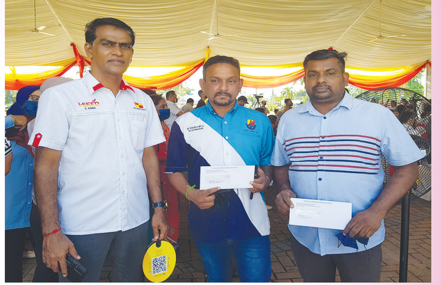
தமிழ்ப்பள்ளிகளுக்கான ஆண்டு மானிய உதவி பெறும் பள்ளிகளின் தலைவர்கள்.