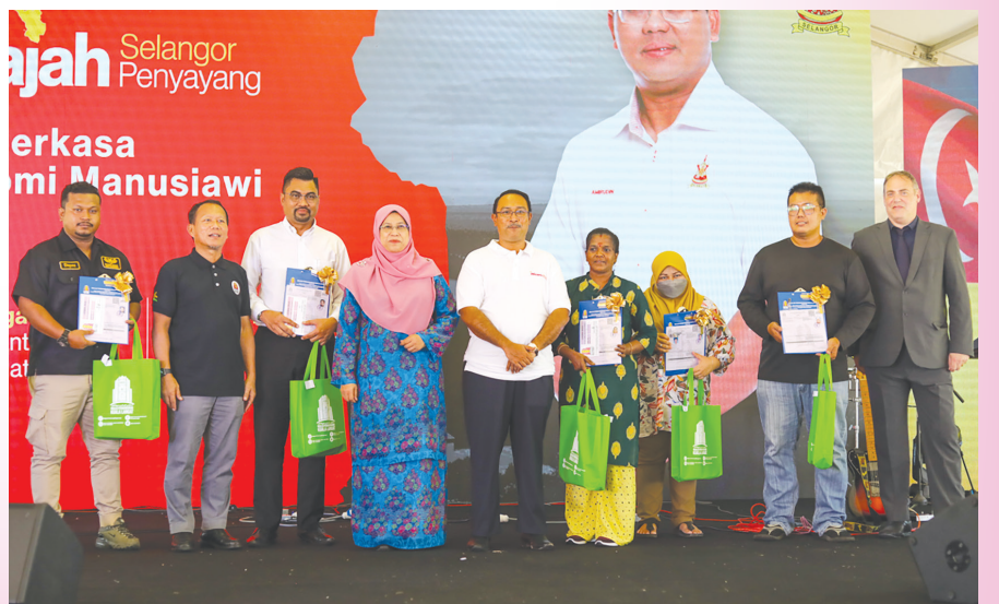
வீடமைப்பு, நகர்ப்புற நல்வாழ்வு மற்றும் தொழில் முனைவோர் துறைக்கான ஆட்சிக்குழு உறுப்பினர் ரோட்சியா இஸ்மாயில் மூலம் மாநில சிறு தொழில் நடத்துனர்கள் ஹிஜ்ரா கடனுதவித் திட்டம் மற்றும் பொருள் உதவிகளை பெற்ற தொழில் நடத்துனர்கள்