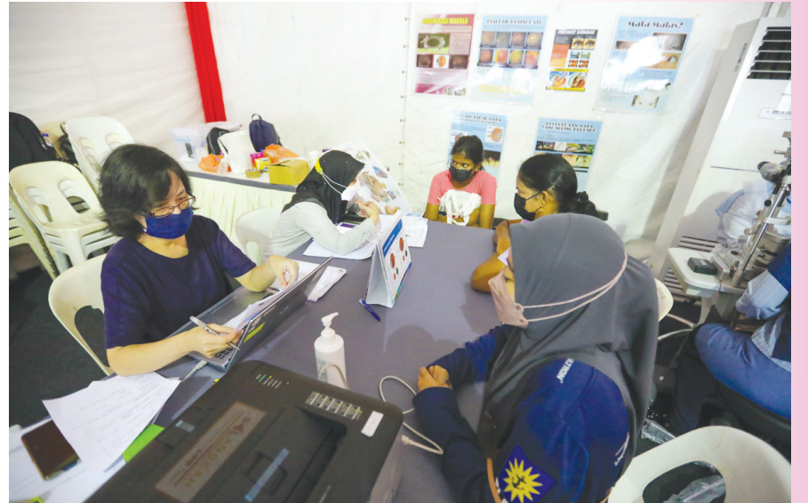
மாநில அரசின் மருத்துவ முகாமில் உடல் பரிசோதனை செய்துக்கொள்ளும் பயனாளிகள்