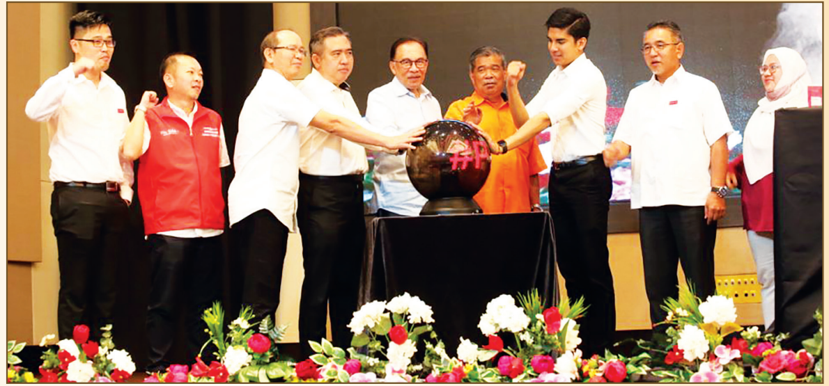
ஹராப்பான் தேர்தல் கொள்கையறிக்கையில்,