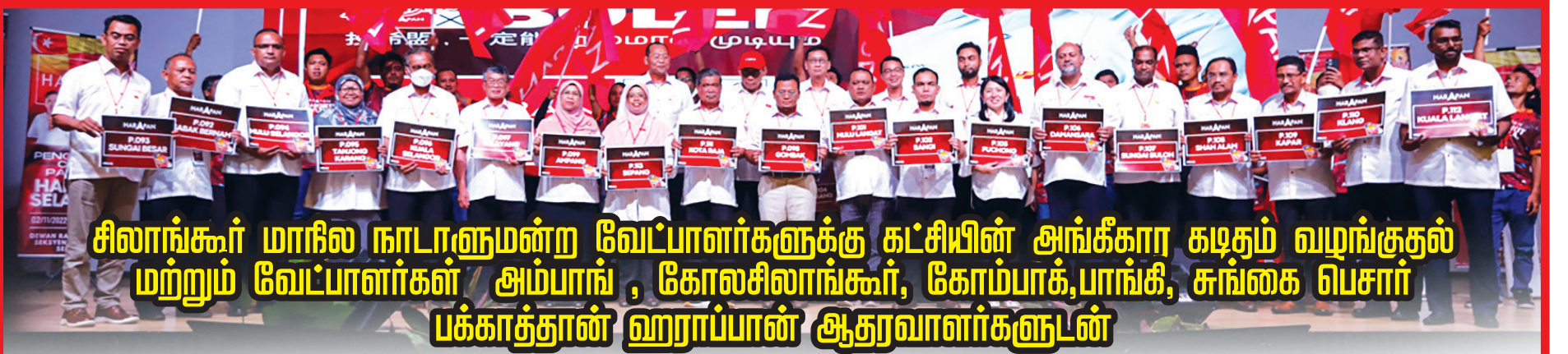
சிலாங்கூர் மாநில நாடாளுமன்ற வேட்பாளர்களுக்கு கட்சியின் அங்கீகார கடிதம் வழங்குதல் மற்றும் வேட்பாளர்கள் அம்பாங், கோலசிலாங்கூர், கோம்பாக், பாங்கி, சுங்கை பெசார் பக்காத்தான் ஹராப்பான் ஆதரவாளர்களுடன்