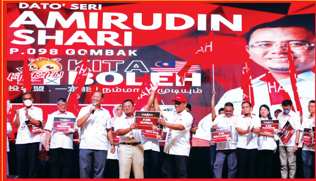
கடவுள் அருளால் எங்களுக்கு வாய்ப்பு வழங்கப்பட்டால் நாட்டின் பொருளாதாரத்தையும் கண்ணியத்தையும் மீட்டெடுக்க எங்களால் முடிந்ததைச்

எங்களுக்கு அங்கு வேதனையான அனுபவங்கள் இருந்தாலும், புத்ராஜெயாவை வரும் பொதுத் தேர்தலில் கைப்பற்ற முடியும் என்று நான் நம்புகிறேன். 22 மாத காலத்தில் வைத்ததை மீண்டும் நிலை நிறுத்துவோம் என அவர் மேலும் தெரிவித்தார்.