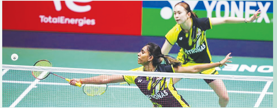
கணிக்கத் தவறியதால் இரண்டாவது செட்டில் 21-18 என்ற புள்ளிக் கணக்கில் பின்னடைவை எதிர்நோக்கினர். ஆனால், பின்னர் அந்த