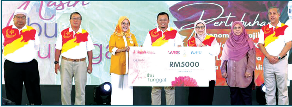
சிப்பாங், அக் 31- சிலாங்கூர் மாநில அரசினால் அமல்படுத்தப்பட்டுள்ள 5,000 வெள்ளி மானியத் திட்டம் மூலம் மகளிர் மற்றும்