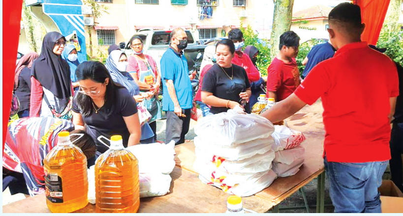
இந்த வாய்ப்பினை பயன்படுத்தி விரைந்து வந்து அவற்றை வாங்கிக் கொள்ளும்படி கேட்டுக் கொள்கிறோம்.