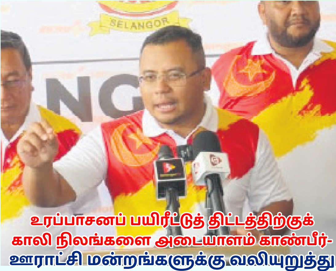
உரப்பாசனப் பயிரீட்டுத் திட்டத்திற்குக் காலி நிலங்களை அடையாளம் காண்பீர்- ஊராட்சி மன்றங்களுக்கு வலியுறுத்து

நாடு தொற்றுநோயால் பாதிக்கப்பட்டபோது, மாநில அரசு மக்களுக்கு நோய் தடுப்பூசிகள் வழங்குவதை விரைவு படுத்துவதற்காகச் செல்வெக்ஸ் திட்டத்தைச் செயல்படுத்தியது. அதைத் தொடர்ந்து செல்வெக்ஸ் பூஸ்டர் திட்டத்தின் மூலம் மக்களுக்குப் பூஸ்டர் டோஸ் வழங்கப்பட்டது.