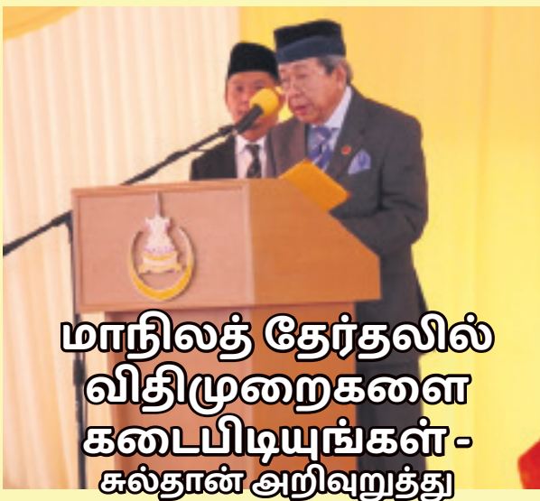
மாநிலத் தேர்தலில் விதிமுறைகளை கடைபிடியுங்கள் - சுல்தான் அறிவுறுத்து

மாநில மக்களின் வாழ்க்கைத் தரத்தை மேம்படுத்துவதற்காக கல்வி, சமூக நலன், வீட்டுடைமை, மனித மூலதனம், சுகாதாரம் உள்ளிட்ட அம்சங்களை அந்த 46 திட்டங்களும் உள்ளடக்கியுள்ளன என்று அவர் சொன்னார். தகுதி உள்ள மாநில மக்கள் இந்த ஐ.எஸ்.பி. திட்டத்தின் கீழ் வழங்கப்படும் அனுசூலங்களைப் பெற்று பயனடையுமாறு கேட்டுக் கொள்கிறேன் என்று மாநில சட்டமன்றக் கூட்டத்தை இன்று தொடக்கி வைத்து உரையாற்றுகையில் கூறினார்.