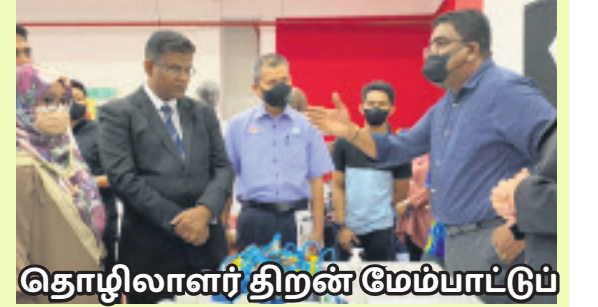
தொழிலாளர் திறன் மேம்பாட்டுப்