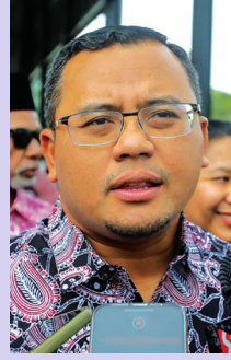
செலவினம் 70 கோடி வெள்ளிக்கும் அதிகமாகவும் 100 கோடி

ஷாரி கூறினார். இந்த அரங்கின் கட்டுமானச் செலவினத்தை மதிப்பிடும் நிபுணர்கள் நம்மிடம் உள்ளனர். அரங்கை மட்டும் நிர்மாணிப்பதாக இருந்தால் அதற்கு 70 கோடி முதல் 80 கோடி வெள்ளி வரை தேவைப்படும். ஆனால் நாம் ஒட்டுமொத்த விளையாட்டுத் தொகுதியையும் கருத்தில் கொள்ள வேண்டியுள்ளது.