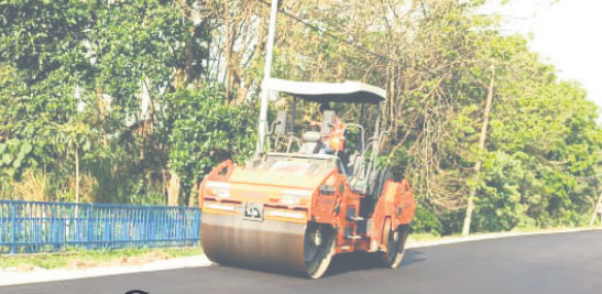
39,182 மோசமான சாலைகளை இன்ஃப்ராசெல் சரி செய்தது

ஷா ஆலம், சிலாங்கூர் முழுவதும் மொத்தம் 39,182 மோசமான சாலைகள் 2021 முதல் கடந்த ஆண்டு வரை மாநிலச் சாலை பராமரிப்பு நிறுவனமான இன்ஃப்ராசெல் மூலம் சரி செய்யப்பட்டன.