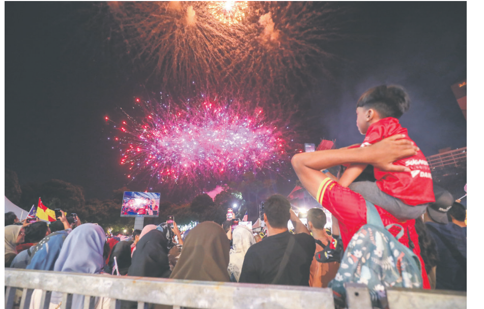
ஆகஸ்ட் 30, 2023 அன்று ஷா ஆலம் சுதந்திர அரங்கத்தில் மாநில அளவில் 66வது தேசிய தினக் கொண்டாட்டத்தின் போது வானவேடிக்கை நிகழ்ச்சி நடைபெற்றது