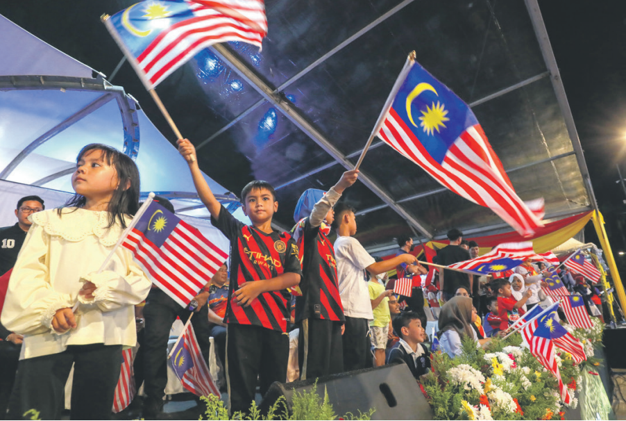
ஆகஸ்ட் 30, 2023 அன்று ஷா ஆலம் சுதந்திர அரங்கத்தில் மாநில அளவில் 66வது தேசிய தினக் கொண்டாட்டத்தின் போது குழந்தைகள் மலேசியக் கொடியை அசைத்தனர்.