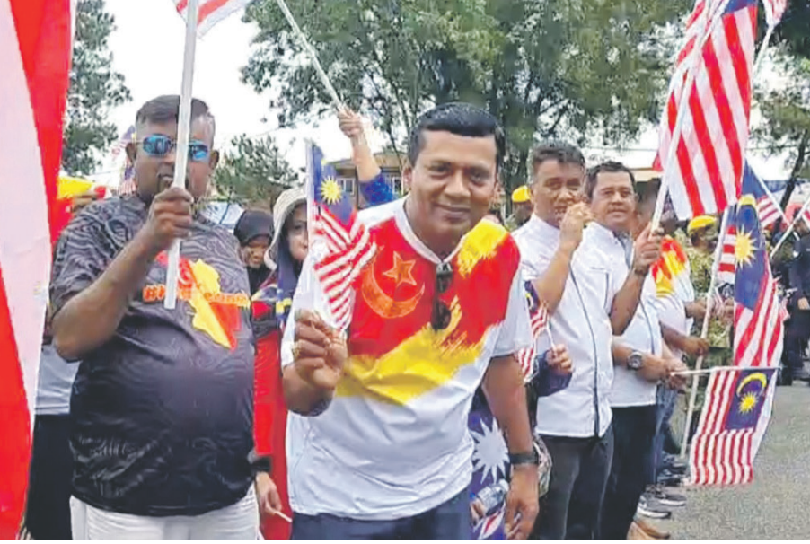
செந்தோசா தொகுதியில் சுதந்திர தின விழா