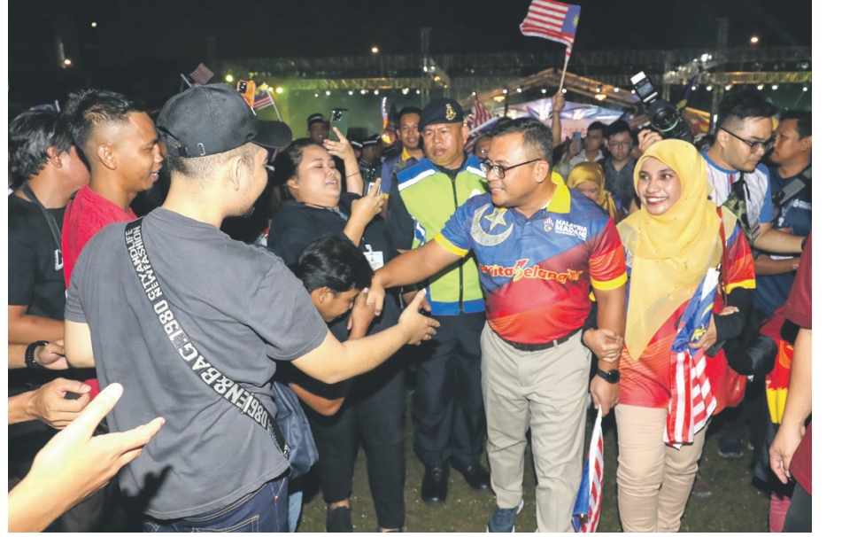
ஆகஸ்ட் 30, 2023 அன்று ஷா ஆலம் சுதந்திர அரங்கத்தில் மாநில அளவிலான 66வது தேசிய தினக் கொண்டாட்டத்தின் போது டத்தோ மந்திரி புசார் டத்தோபுரீ அமிருடின் ஷாரி பார்வையாளர்களுடன் கைகுலுக்கினார்.