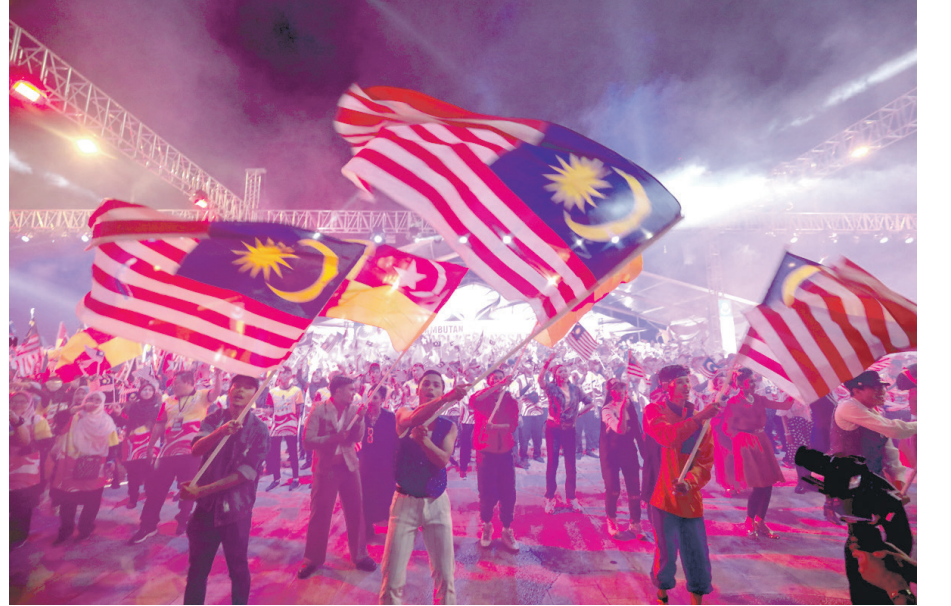
30 ஆகஸ்ட் 2023 அன்று ஷா ஆலம் சுதந்திர அரங்கத்தில் மாநில அளவில் நடைபெற்ற 66வது தேசிய தினக் கொண்டாட்டத்தில், மக்கள் 'மெர்டேகா' என கோஷமிட்டார்