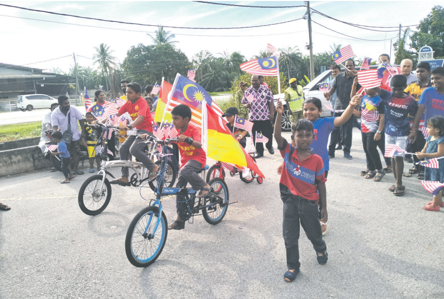
கோல சிலாங்கூரில் மாணவர்கள் மகிழ்ச்சியுடன் சுதந்திர தின கொண்டாட்டம்