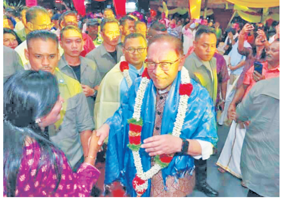
மகிழ்ச்சி, பன்முகத்தன்மையுடன் தைப்பூசத்தைக் கொண்டாடுவோம்- பிரதமர் வாழ்த்து