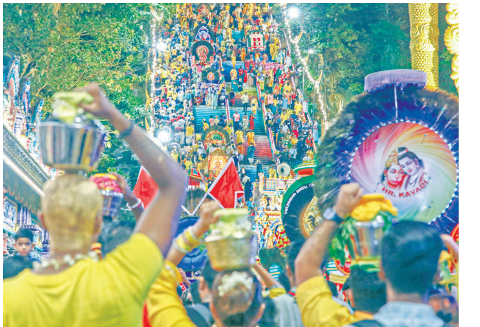
ஜனவரி 24 2024 அன்று பத்துமலையில் உள்ள ஸ்ரீ சுப்பிரமணியர் கோயிலில் தைப்பூசத் திருநாளில் இந்துக்கள் வேண்டுகளைச் செலுத்துகின்றனர்