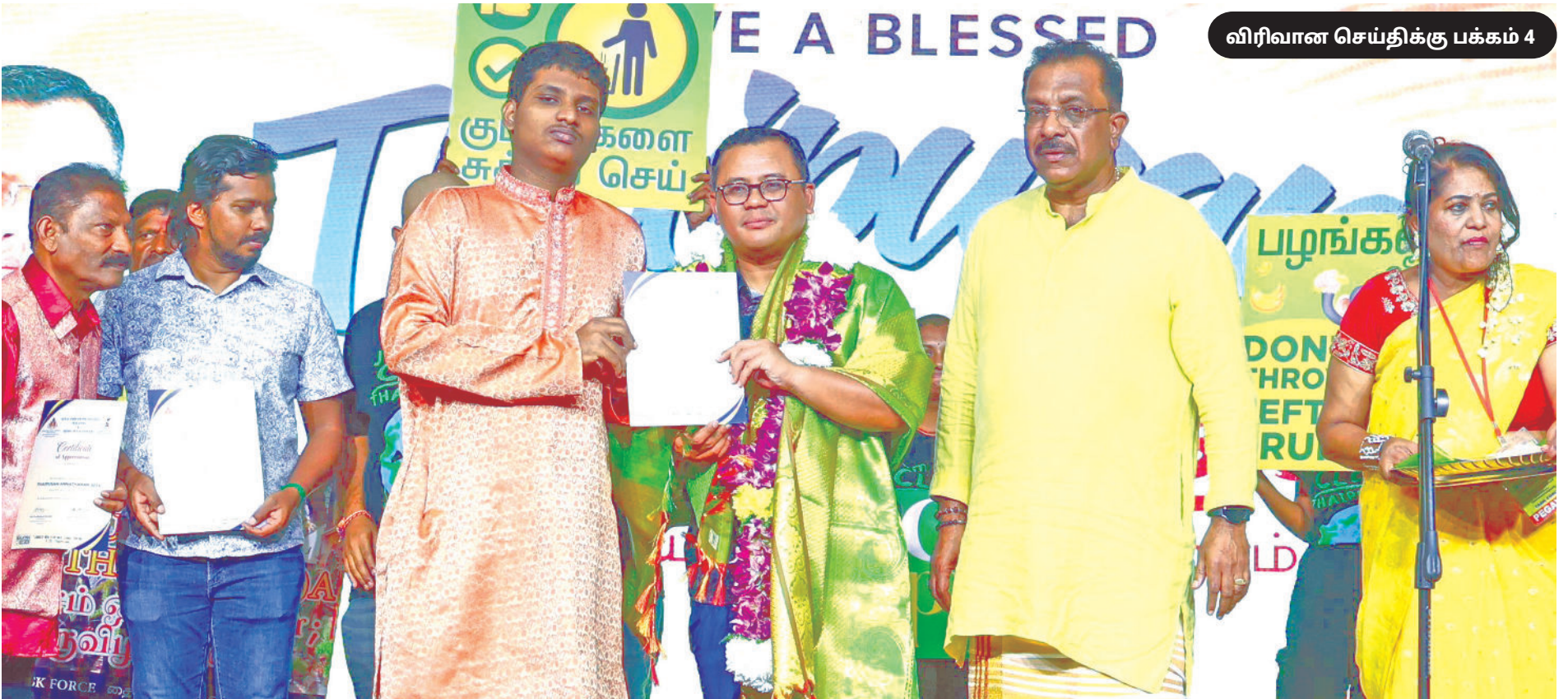
விரிவான செய்திக்கு பக்கம் 4

தனது ஆட்சிக் காலத்தின் போது மாட்சிமை தங்கிய பேரரசர் புதிய வரலாற்றுச் சாதனையைப் படைத்ததோடு மூன்று முறை பிரதமர் மாற்றம் ஏற்பட்ட போது சிறப்பான முறையில் அப்பிரச்சனைகளைக் கையாண்டு நாட்டை சரியான தடம் நோக்கி வழி நடத்தினார் எனவும் அவர் புகழாரம் சூட்டினார்.