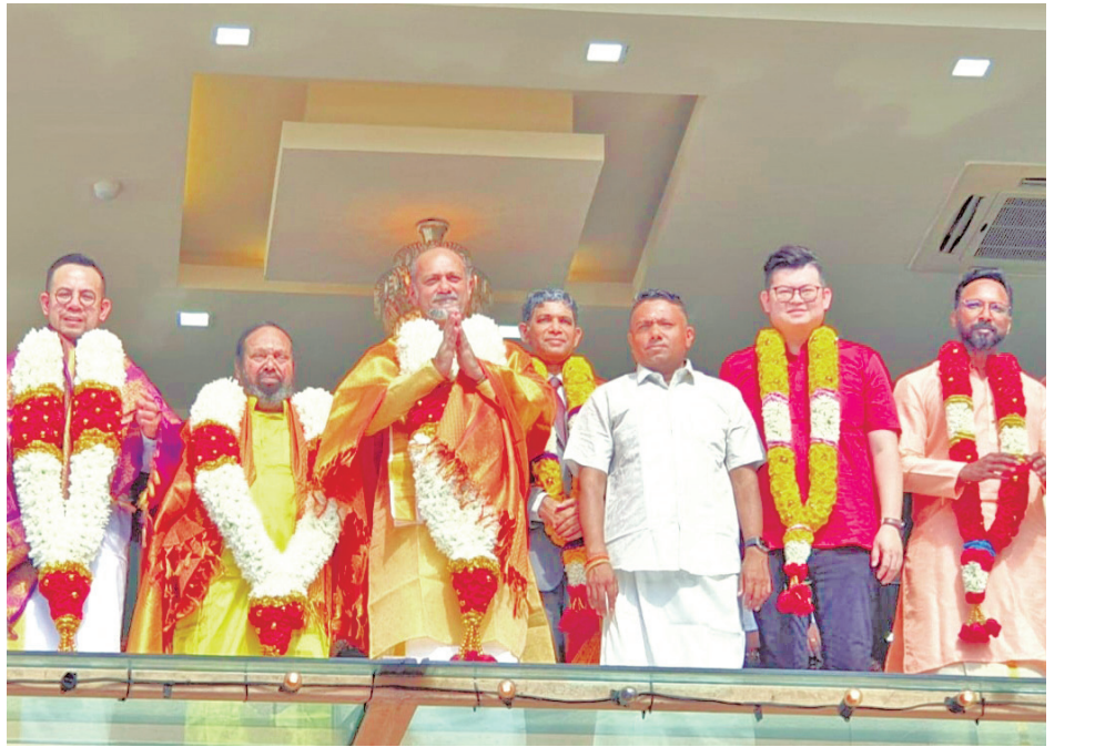
தைப்பூச விழா இன ஒற்றுமை, சகிப்புத்தன்மையின் அடையாளம்! அமைச்சர் கோபிநத் சிங் புகழாரம்