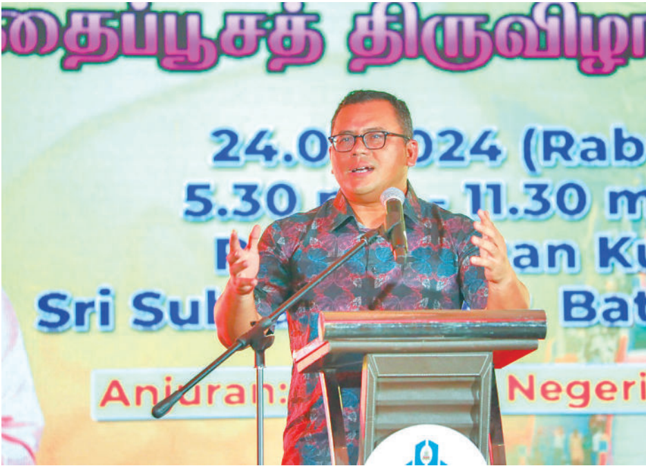
தைப்பூசத்தை சுமுகமாக கொண்டாட மத நல்லிணக்கமும், ஒற்றுமையும் முக்கியம் - மந்திரி புசார் வலியுறுத்து