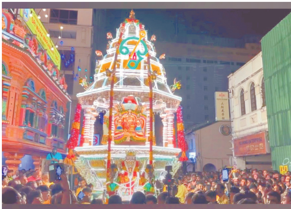
அருள்மிகு வள்ளி தெய்வானை சமேத ஸ்ரீ சுப்ரமண்ய சுவாமி வெள்ளி ரத ஊர்வலம் - தைப்பூச 2024