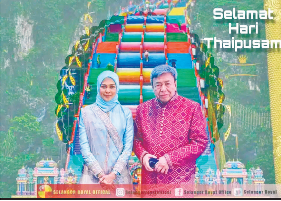
ஒற்றுமை, சகிப்புத் தன்மையை வளர்போம்- தைப்பூச வாழ்த்துச் செய்தியில் சுல்தான் தம்பதியர் அறைகூவல்