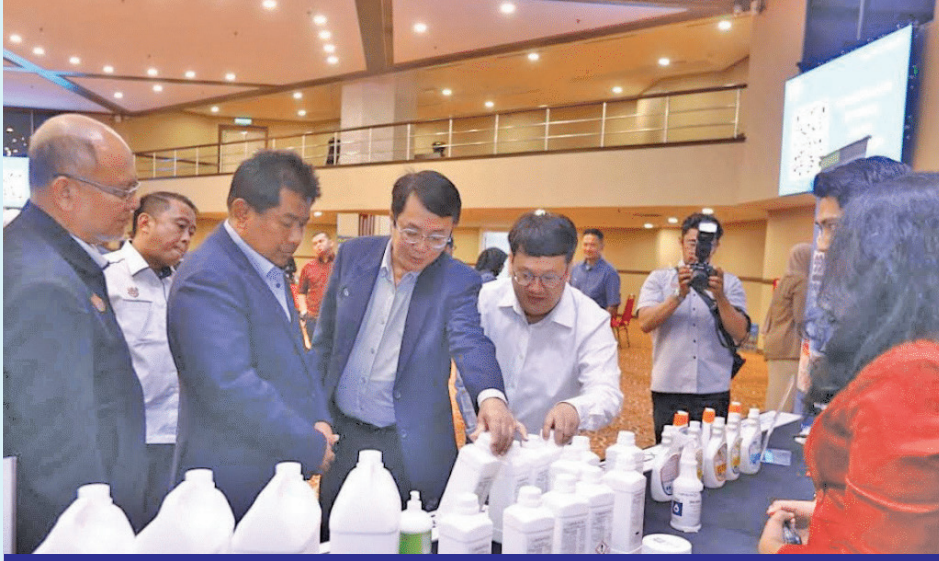
உணவுப் பாதுகாப்பு செயல்முறைகளை வலுப்படுத்த