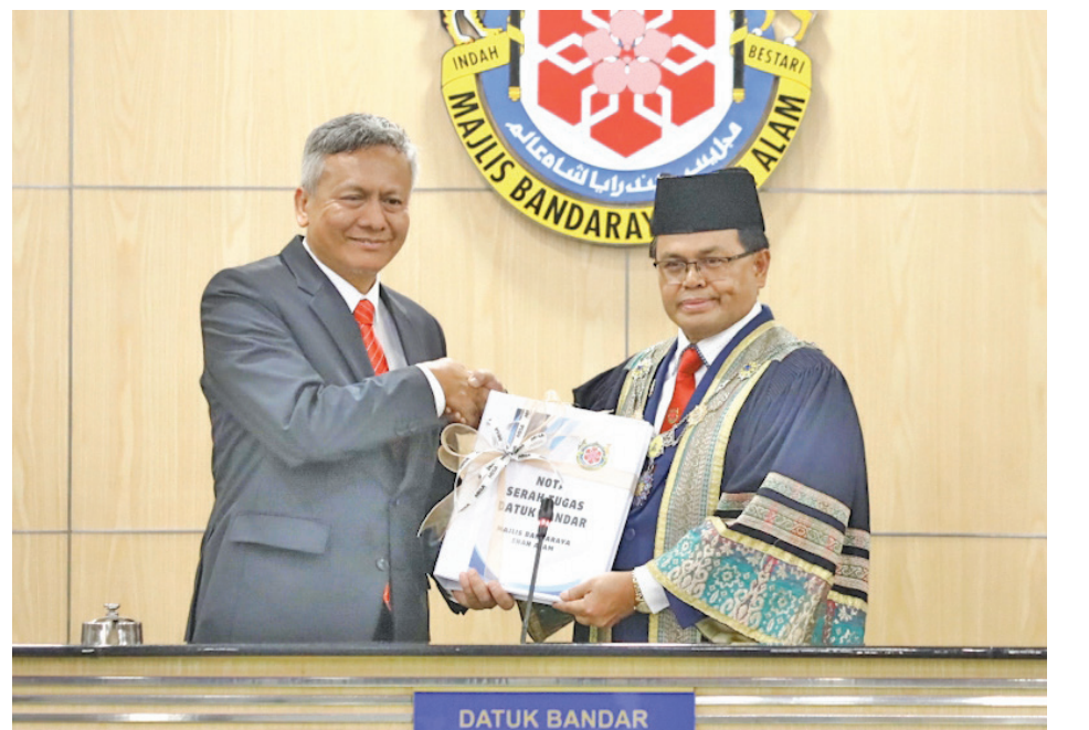
6 ஜூன் 2024 அன்று எம்பிஎஸ்ஏ மண்டபத்தில் ஷா ஆலமின் 12வது மேயராகப் பதவியேற்ற டத்தோ முகமட் ஃபெளசி முகமட் யாதிம், மடியான் பாவே துணை மேயரிடமிருந்து பணி ஒப்படைப்புக் குறிப்பைப் பெறுகிறார்.