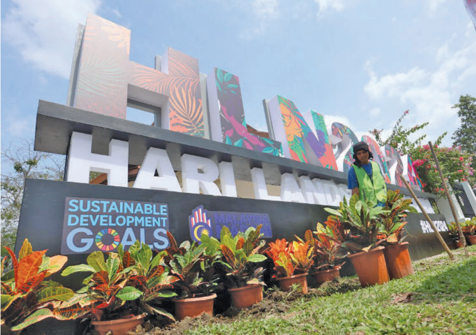
2024 தேசிய நில வடிவமைப்பு தினத்தை முன்னிட்டு 21 மே 2024 அன்று தாமான் தாசிக் ஷா ஆலமில் முன் ஏற்பாடுகள்