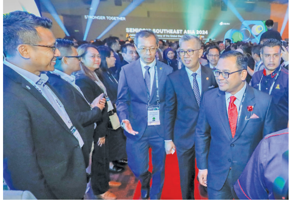
28 மே 2024 அன்று கோலாலம்பூரில் உள்ள MITEC இல் 'SEMICON' தென்கிழக்கு ஆசியா 2024இன் தொடக்க விழாவில் முதலீடு, வர்த்தகம் மற்றும் தொழில்துறை அமைச்சர் தெங்கு டத்தோபுட் ஜக்ப்ருஸ் தெங்கு அப்துல் அஜீஸ், டத்தோ மந்திரி புசார் டத்தோபுட் அமிருடன் ஷாரியுடன் கலந்து கொண்டார்