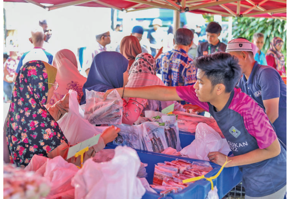
4 ஜூன் 2024 அன்று பெட்டாலிங் ஜெயா ஸ்ரீ செத்தியா தொகுதியில் நடைபெற்ற சந்தையில் பொருட்களை மக்கள் மலிவாக வாங்கினர்