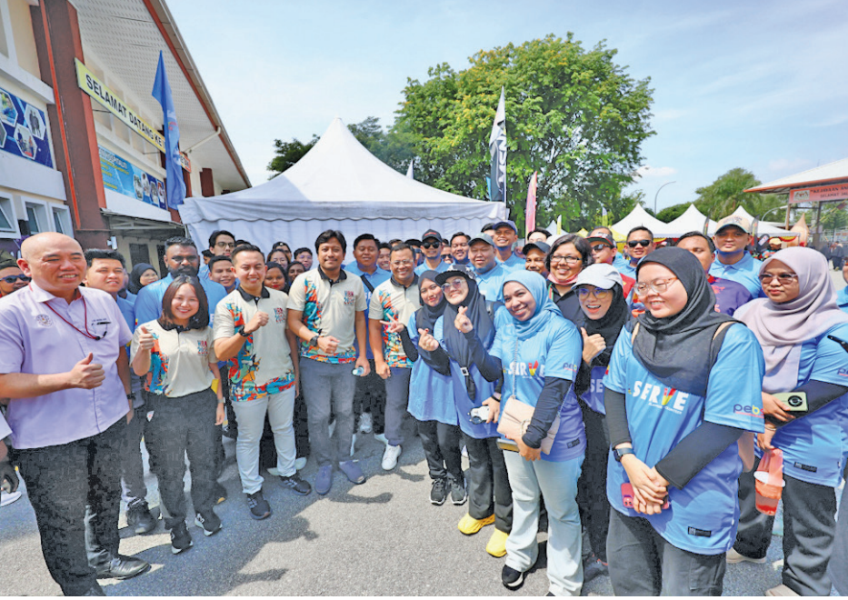
19 மே 2024 அன்று கோலா குபு பாருவில் சிலாங்கூர் அளவில் தேசிய இளைஞர் தினம் 2024 கொண்டாட்டம், டத்தோ மந்திரி புசார் டத்தோபுட் அமிருடன் ஷாரி வருகை