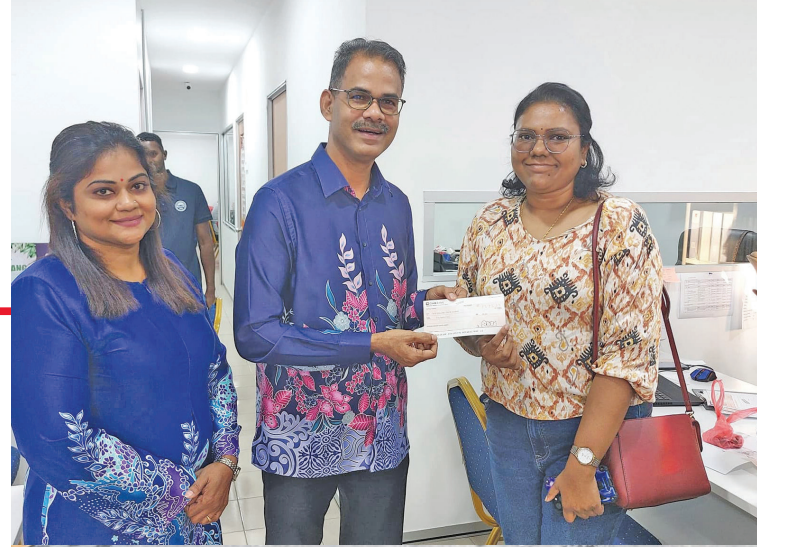
வீ.பாப்பாராய்டு பந்திங் தொகுதியில் இந்திய அமைப்புகளின் பிரதிநிதிகளிடம் மானியம் வழங்கினார்