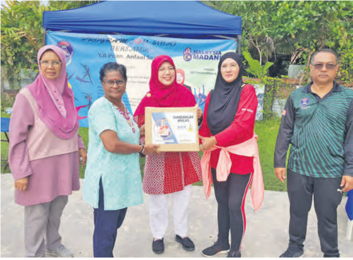
அன்பால் சாரி தாமான் செலாயாங் முத்தியாரா, கோம்பாக்கில் தாமான் டெம்பளர் தொகுதியின் மூலம் உணவுப் கூடை வழங்குதல்