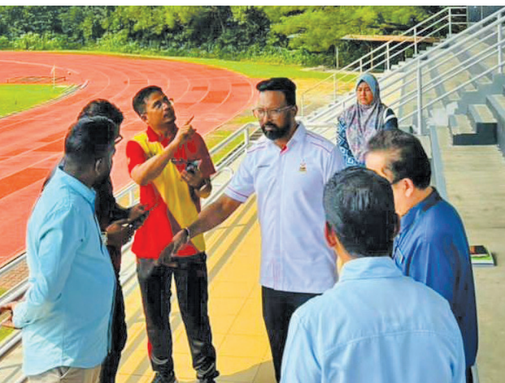
பள்ளி விளையாட்டு மைதான மேம்பாடு குறித்து விளக்கம் பெறும் கோத்தா கெமுனிங் சட்டமன்ற உறுப்பினர் எஸ். பிரகாஷ்