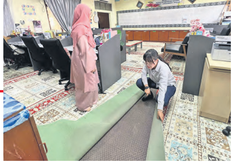
வோங் சியூ கி பழுதடைந்த பள்ளிகளின் உடைமைகளை ஸ்ரீ கெம்பாங்கான் தொகுதி சட்டமன்ற உறுப்பினர் ஆய்வு