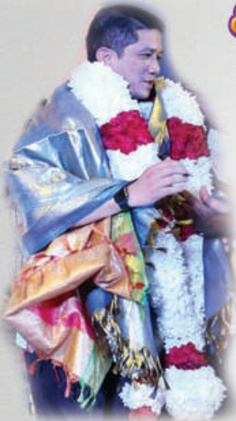
தீபாவளியை கொண்டாடும் அனைத்து இந்துக்களுக்கும் சீக்கியர்களும் சிலாங்கூர் மாநில அரசாங்கத்தின் சார்பில் வாழ்த்தினை தெரிவிப்பதில் பெருமிதம் கொள்கிறேன். இந்த தீபாவளி திருநாளில் குடும்பம் சகிதம் ஒன்றிணைந்து சொந்தங்களோடும்

நட்புகளோடும் குதுகலமாய் இனிமையான தினைவுகளை மீட்டெடுப்பதும், உறவுகள் மத்தியில் அன்பையும் ஆழமான உறவையும் வலுப்படுத்தவும் தீபத்திருநாள் முதன்மைக் கொள்கிறது. தீபாவளி என்பது தீமையை அழித்து நன்மையை மெய்பிக்கும் உன்னத திருநாள் இத்திருநாளில் நாம் அனைவரும் சகோதரத்துவத்தை பேணி நம்பிடையே இருக்கும் இருளினை அகற்றி அன்பும், புரிந்துணர்வும் மற்றும் ஒற்றுமையையும் மேலோங்க செய்வோம் மலேசியா போன்ற பல்லினம் வாழும் நாட்டில் நாம் மதநல்லிணக்கத்தோடும் ஒருவருக்கு ஒருவர் மதித்தும் அன்பை பகிர்ந்தும் உன்னத உறவுகளோடு மெய்பிக்க தீபத்திருநாள் உயிர்ப்பிக்கும். இருள் நீங்கி ஒளியூட்டும் இத்திருநாளில் நாட்டின் எதிர்காலமும் இருள் நீங்கி ஒளியால் மிளிர்ட்டும் நம்பிக்கையான எதிர்கால மாற்றத்திற்கு தீபத்திருநாளில் ஒளி பிரகாசிக்கட்டும். தீபத்திருநாளில் மெய்பிக்கும் வெளிச் சமாதானது நாளை தலைமுறைக்கு நம்பிக்கையான மலேசியாவை உருவாக்க வழிகோலும் அதே வேளையில் சிலாங்கூர்