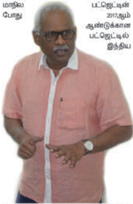
ப.ஜெட்டின் 2017ஆம் ஆண்டுக்கான பட்டெட்டில் இந்திய