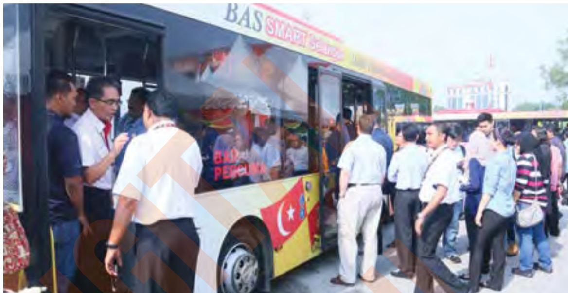
Kerajaan Negeri mula memperkenalkan inisiatif bas percuma di bawah penjenamaan Bas Selangorku, pada 2015

Katanya, ini termasuk kemudahan perkhidmatan bas yang