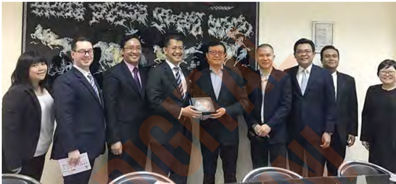
Invest Selangor terus giat mempromosikan SIBS ke seluruh negara bagi memastikan kejayaan penganjurannya, pada 6 hingga 16 September ini

arah mencapai visi ini dengan SIBS mewujudkan landasan untuk syarikat multinasional tempatan dan asing serta perusahaan kecil juga sederhana, mempamerkan produk selain perkhidmatan mereka," katanya.