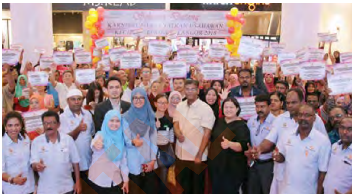
Ganabatirau bergambar kenangan bersama usahawan kecil Blueprint Selangor 2018

"Dengan peruntukan tahunan RM2 juta, saya yakin program ini mampu memanfaatkan peniaga kecil di Selangor untuk meningkatkan pendapatan seterusnya berupaya menaikkan taraf ke-