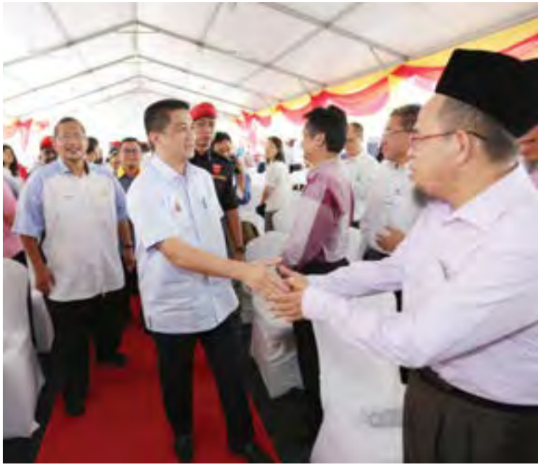
Mohamed Azmin meluangkan masa beramah mesra bersama hadirin ketika menghadiri Majlis Pecah Tanah Rumah Selangorku yang sangat signifikan dengan Kerajaan Negeri