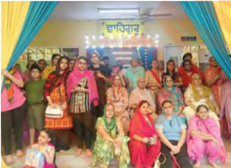
Keperluan masyarakat Sikh sentiasa dipenuhi Kerajaan Negeri bagi memastikan aktiviti kegamaan mereka dapat dijalankan sebaik mungkin

BATU CAVES - Kerajaan Negeri menyalurkan peruntukan tambahan RM740,000 bagi pelaksanaan program keagamaan kaum Sikh dalam usaha memperkasa tradisi dan adat komuniti itu, di Selangor.