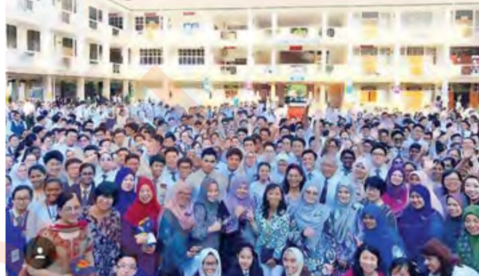
Kempen #StandTogether yang dilancarkan tahun lalu adalah satu inisiatif menangani isu buli daripada terus menular, di sekolah