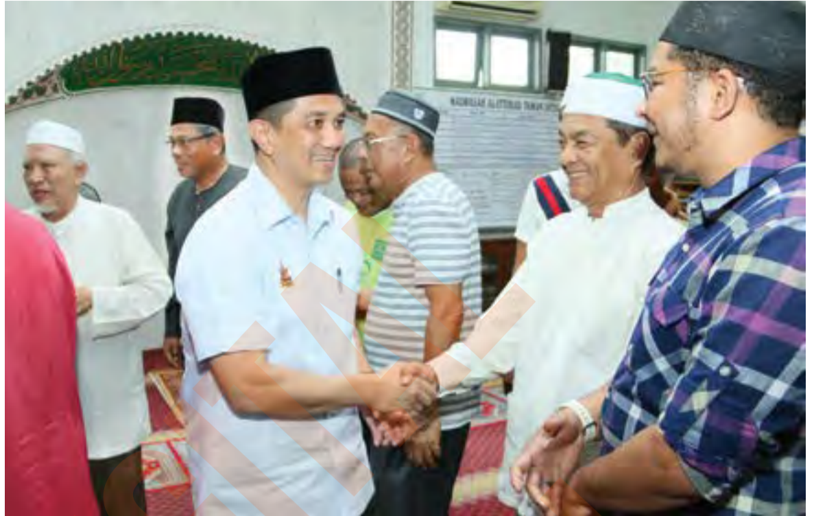
Mohamed Azmin beramah mesra bersama penduduk setempat ketika menghadiri majlis dialog bersama penduduk, di Madrasah Al-Ittihad, Taman Setia Gombak

Pada masa sama, Mohamed Azmin berkata, isu pemilikan tanah Madrasah Al-Ittihad, di Taman Setia Gombak itu selesai, sejak 2016.