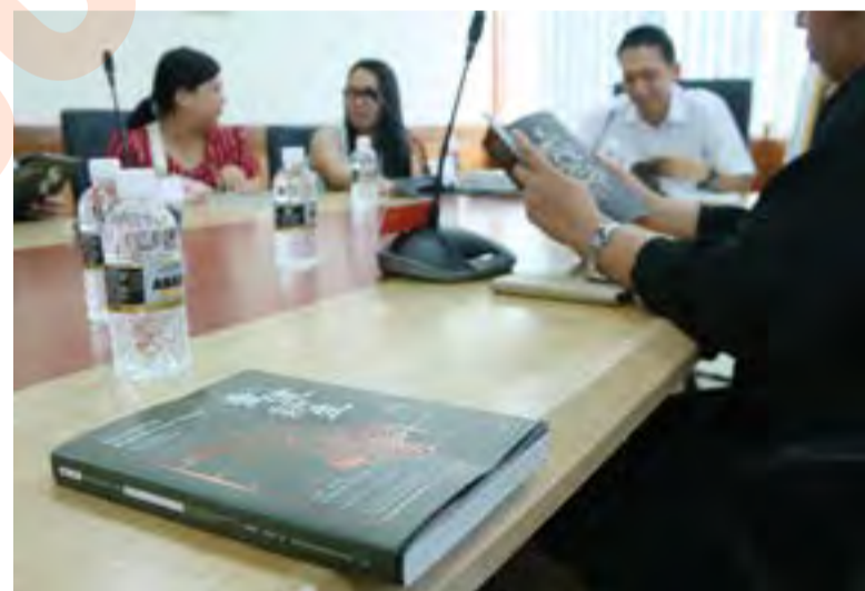
Membina Kehidupan Baru adalah buku ketiga dihasilkan selepas Kampung baru dan Kampung Bagan

Setakat ini, terdapat 42 Kampung Baru, 19 Kampung Bagan dan 17 Kampung Tersusun, di negeri itu.