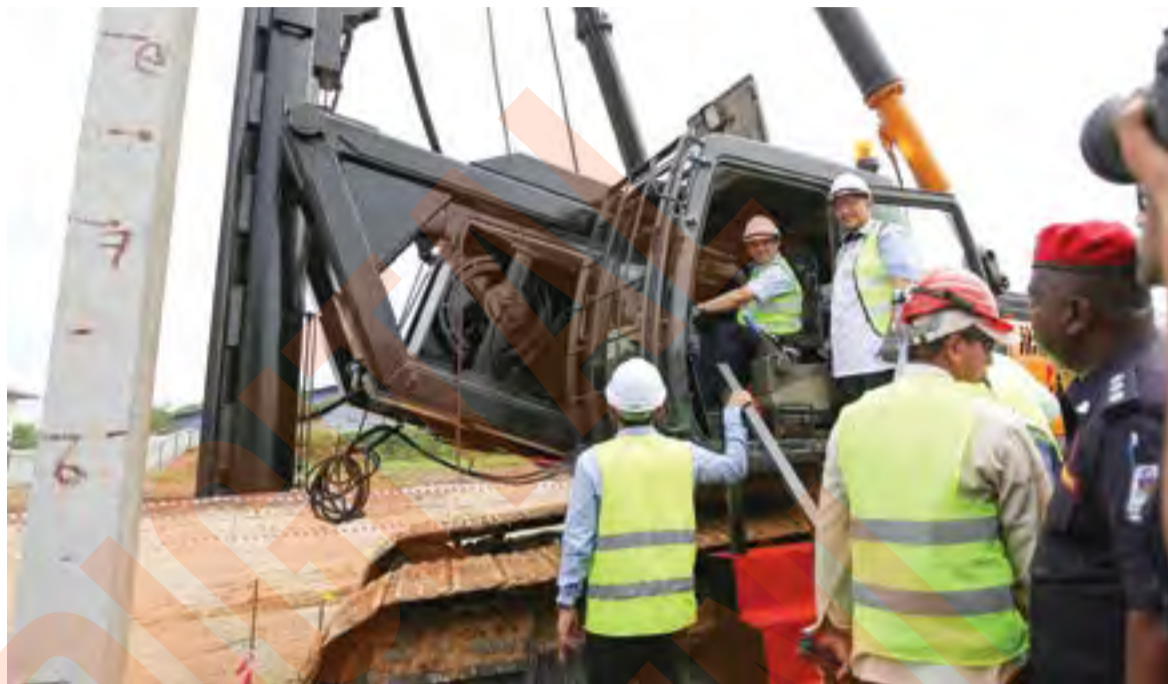
Kerajaan Negeri terus serius menyelesaikan isu projek terbengkalai dan komited membantu rakyat memiliki kediaman, pada harga mampu milik

"Dasar Kerajaan Negeri memperkenalkan pelbagai inisiatif pemilikan rumah menjadikan ia pemangkin kepada akses perumahan berkualiti, selesai dan mampu milik kepada rak-