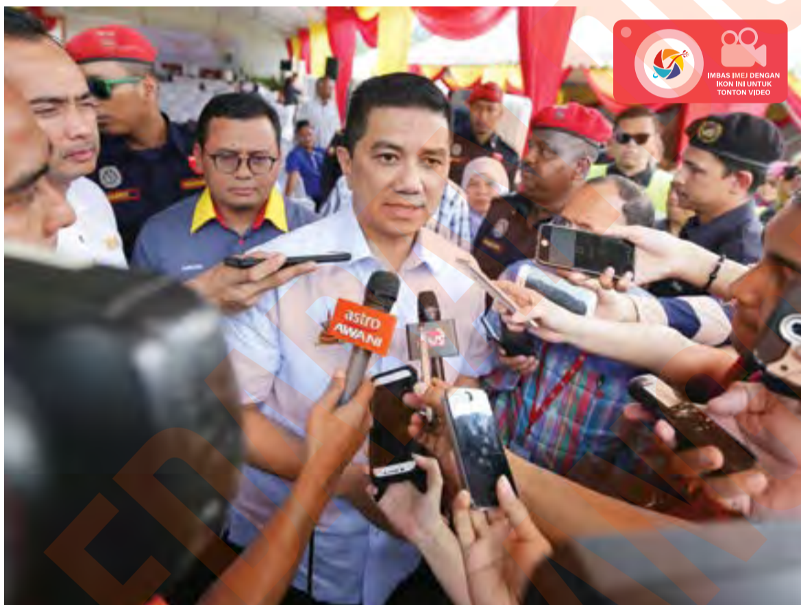
Mohamed Azmin ditemui pemberita ketika Majlis Pecah Tanah Rumah Selangorku Idaman PKNS, di Kampung Seri Temenggung, pada 17 April lalu