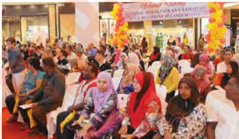
Sebahagian alumni yang bakal menerima manfaat program Blueprint Pembasmian Kemiskinan Selangor

"Diharapkan bantuan ini dapat diteruskan bagi membantu mereka yang kurang berkemampuan," katanya sambil menambah jumlah pendapatan diperolehinya kira-kira RM1,000 sebulan sahaja.