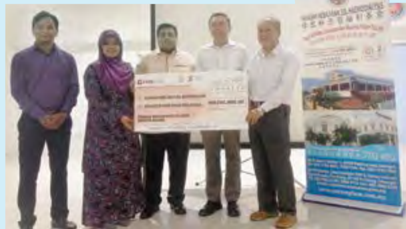
Bantuan Sihat Selangor diperkenalkan sejak 2009 dengan keutamaan diberikan kepada pemohon yang tidak mendapat bantuan

Pesakit yang layak boleh memohon mendapatkan bantuan di laman sesawang Bantuan Sihat Selangor iaitu bantuansihat.selangor.gov.my.