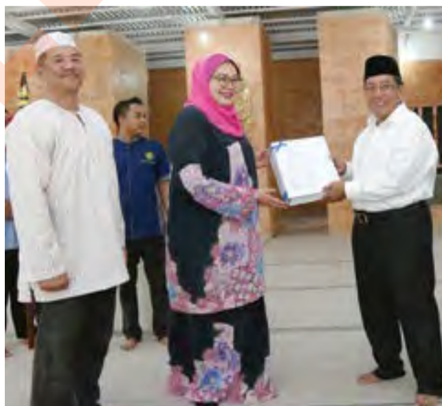
Penyerahan Masjid Cyberjaya 10 menjadikan jumlah keseluruhan masjid di Selangor sebanyak 421 buah

Pada masa sama, Haris berkata, orang ramai dinasihat supaya tidak menjadikan masjid dan surau sebagai tempat berpolitik serta memecahbelahkan perpaduan ahli kariah seperti kehendak Peraturan 80 (2) Peraturan-peraturan Masjid dan Surau Negeri Selangor 2017.