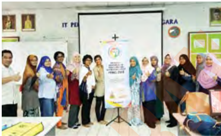
PPMO2018 dilaksanakan pada Mac sehingga April ini membabitkan lima sekolah sekitar daerah Kuala Selangor, Klang dan Hulu Selangor

Antara sekolah lain terbabit adalah SMK Raja Muda Musa, SMK Sultan Sulaiman Shah, SMK Sungai Choh dan SMK Raja Ma-