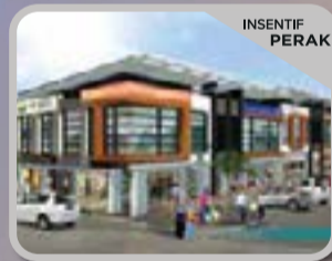
PERDANA AVENUE KUANG PERDANA Kedai Pejabat 2 Tingkat