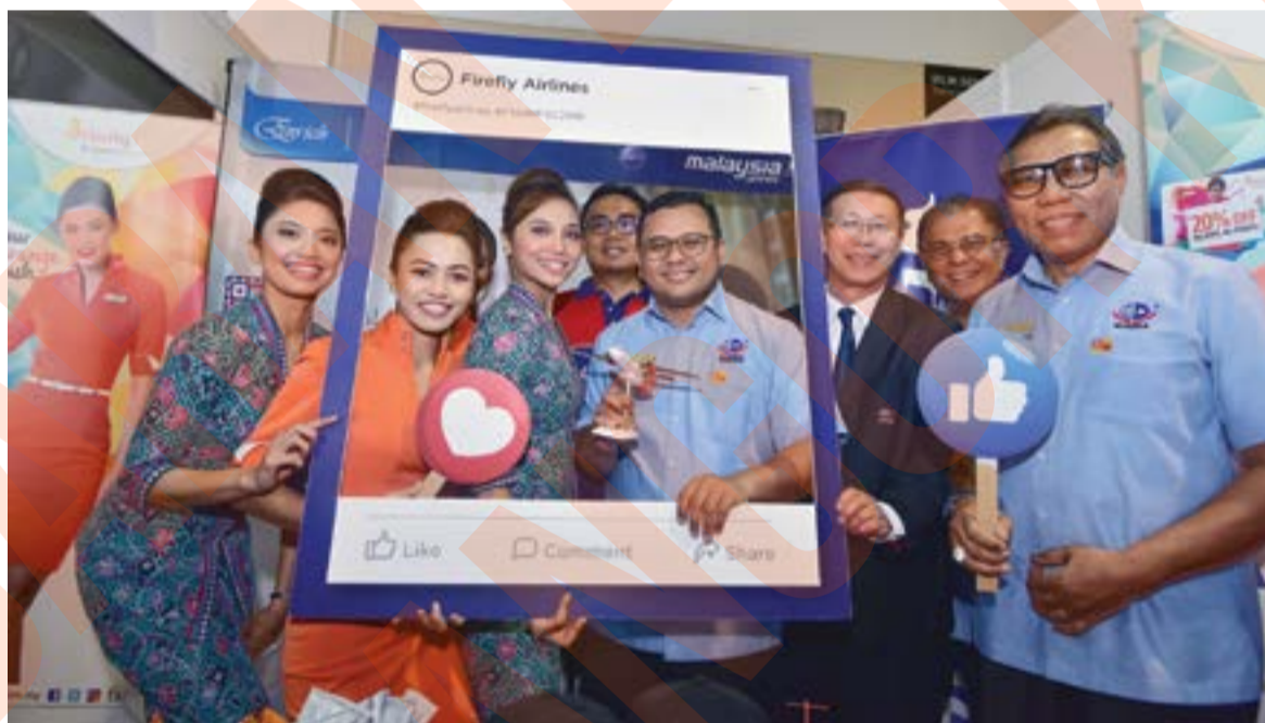
Amirudin ketika menyempurnakan pelancaran Karnival Persatuan Ejen-ejen Pelancongan dan Pengembaraan Malaysia (MATTA) Selangor (MATTA Fair Selangor), baru-baru ini