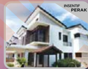
GASSIA ANTARA GAPI Rumah Berkembar 2 Tingkat