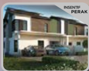
LAVENDER ANTARA GAPI Rumah Berkembar 2 Tingkat