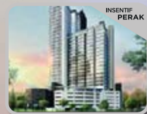
VEGA RESIDENSI 2 SELANGOR CYBER VALLEY Pangsapuri Servis Modern