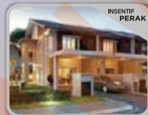
PUTERI ELAISHA KOTA PUTERI Rumah Link 2 Tingkat