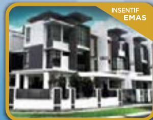
ANGGUN KIRANA ALAM NUSANTARA Rumah Superlink 3 Tingkat

setiap pembelian hartanah kurang dari RM 400 ribu