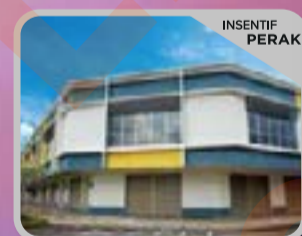
GAPI AVENUE 3 ANTARA GAPI Kedai Pejabat 2 Tingkat