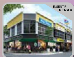
GAPI AVENUE 2 ANTARA GAPI Kedai Pejabat 2 Tingkat