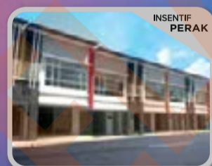
GAPI AVENUE 4 ANTARA GAPI Kedai Pejabat 2 Tingkat

Sila dapatkan BORANG PENGESAHAN PEMBELI INSENTIF MY PKNS 2018 di kaunter-kaunter Bahagian