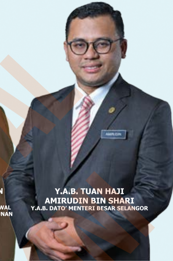
Y.A.B. TUAN HAJI AMIRUDIN BIN SHARI Y.A.B. DATO' MENTERI BESAR SELANGOR