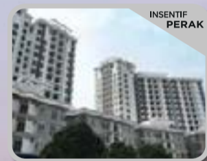
OPAL RESIDENSI SHAH ALAM Pangsapuri Modern