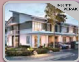
PUTERI DAFFINA 3 KOTA PUTERI Rumah Link 2 Tingkat