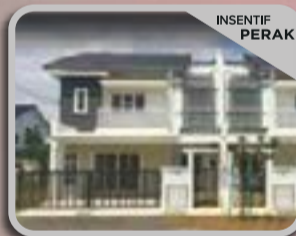
PUTERI DAFFINA 2 KOTA PUTERI Rumah Link 2 Tingkat