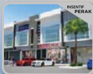
RASA AVENUE RASA Kedai Pejabat 2 Tingkat