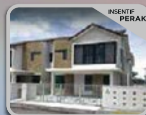
AZHARA ANTARA GAPI Rumah Berkembar 2 Tingkat