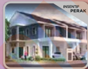
TAMAN BAYU MALAWATI KUALA SELANGOR Rumah Link 2 Tingkat