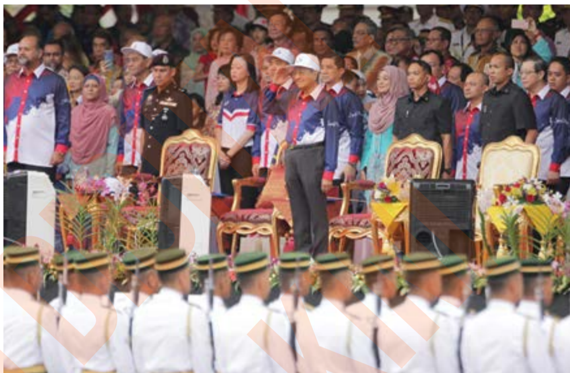
Dr Mahathir bersama barisan Kabinet ketika sambutan Hari Kebangsaan 2018 di Dataran Putrajaya, pada 31 Ogos lalu

Katanya, beliau sudah membayangkan cabaran besar bakal dihadapi, namun tetap yakin dengan gandingan kerajaan serta rakyat mampu memulihkan negara.