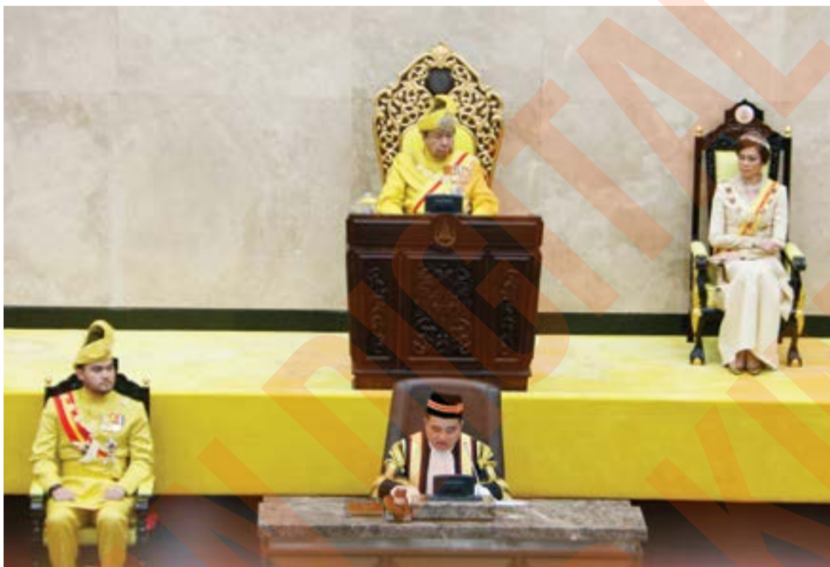
Sultan Sharafuddin Idris Shah mencemar duli ke Istiadat Perasmian Mesyuarat Kedua (Pembukaan) Penggal Pertama Persidangan Dewan Negeri Selangor ke-14 Tahun 2018

"Menjunjung titah DYMM Sultan Selangor, maka pada awal Julai lalu satu perbincangan dilaksanakan di bawah anjuran Jabatan Kehakiman, Majlis Agama Islam Selangor (MAIS) dan Jabatan Agama Islam Selangor (JAIS) serta membabitkan pelbagai