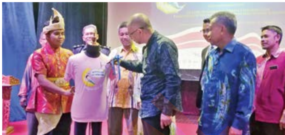
Timbalan Menteri Pelancongan Seni dan Budaya, Muhammad Bakhtiar Wan Chik menurunkan tanda tangan di baju-T simbolik perasmian Bermalam di Muzium

Malah, kejayaan program itu merintis pelaksanaan program sama dan sehingga kini 35 muzium mengambil bahagian menganjurkannya.