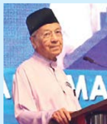
Dr Mahathir menyampaikan ucapan perasmian Kongres Masa Depan Bumiputera & Negara 2018, di Pusat Konvensyen Kuala Lumpur (KLCC)

"Hasil DEB, ramai berkebolehan dan berjaya mencipta kejayaan. Walaupun ada yang anggap tidak adil beri biasiswa kepada orang tanpa menggunakan merit," katanya.