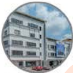
Pusat Pembelajaran SHAH ALAM Program Prasiswazah