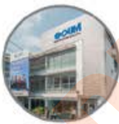
Pusat Pembelajaran PETALING JAYA Program Prasiswazah