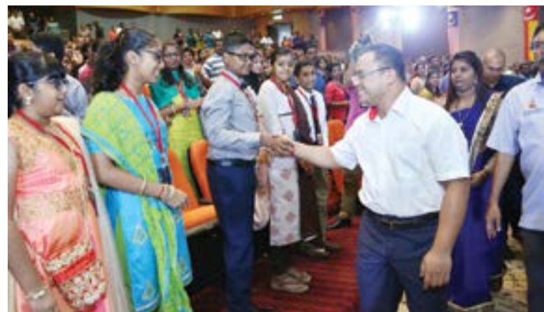
Amirudin beramah mesra dengan pelajar India pada Majlis Anugerah Kecemerlangan UPSR 2017 bagi SJKT, di Selangor

Beliau berkata, pendidikan asas amat penting untuk menyiapkan tapak dan mengukuhkan asas pengetahuan pelajar sebelum melangkah ke peringkat lebih tinggi.