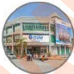
Pusat Pembelajaran BANGI Program Prasiswazah