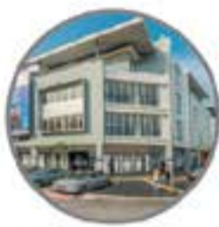
Pusat Pembelajaran SRI RAMPAI Program Prasiswazah