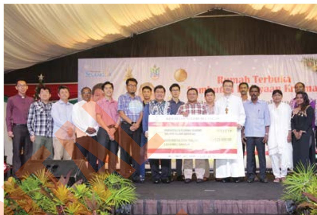
Tanggungjawab besar rakyat