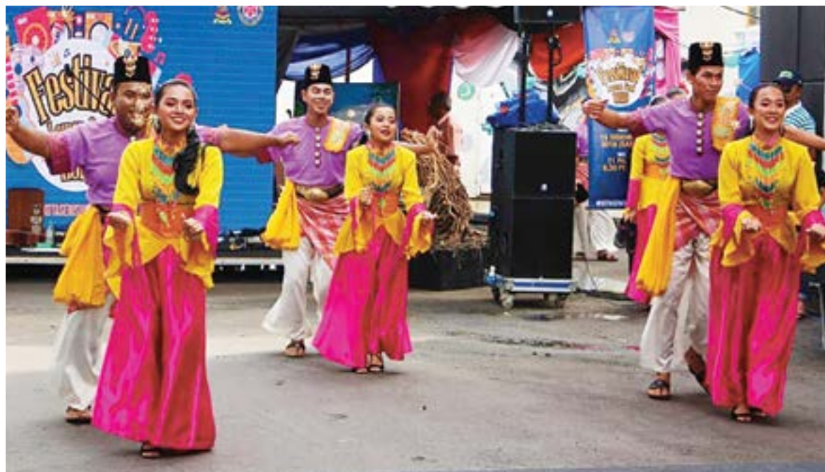
Angkat lima segmen seni