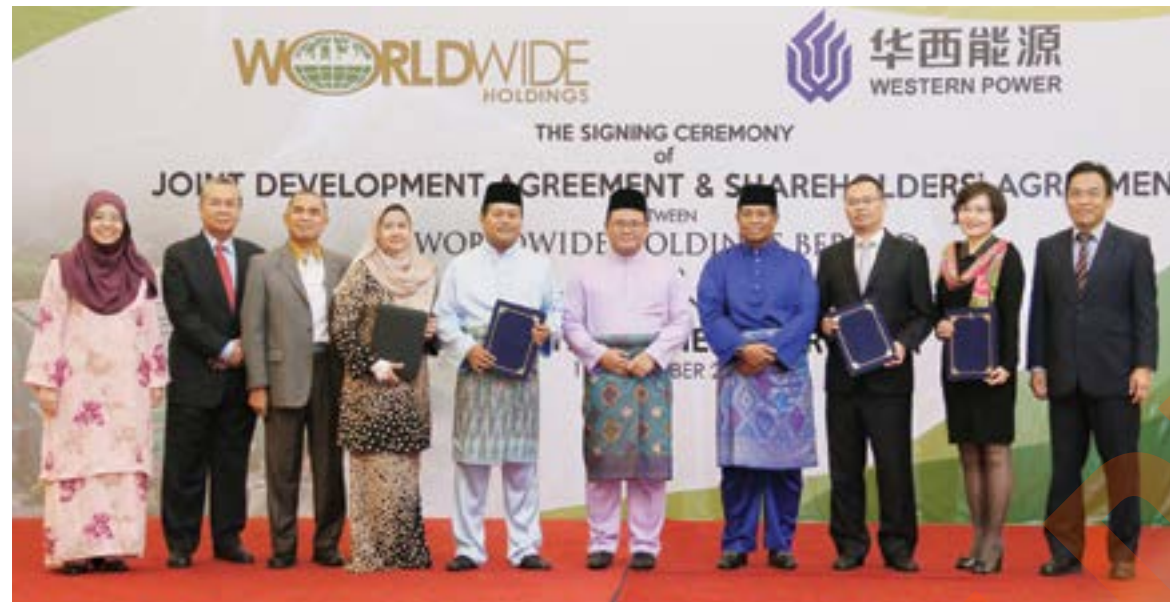
Amirudin (tengah) menghadiri Majlis Menandatangani Perjanjian Pembangunan Bersama Worldwide Holdings Berhad - Western Power Clean Energy Sdn Bhd, di Hotel Concorde