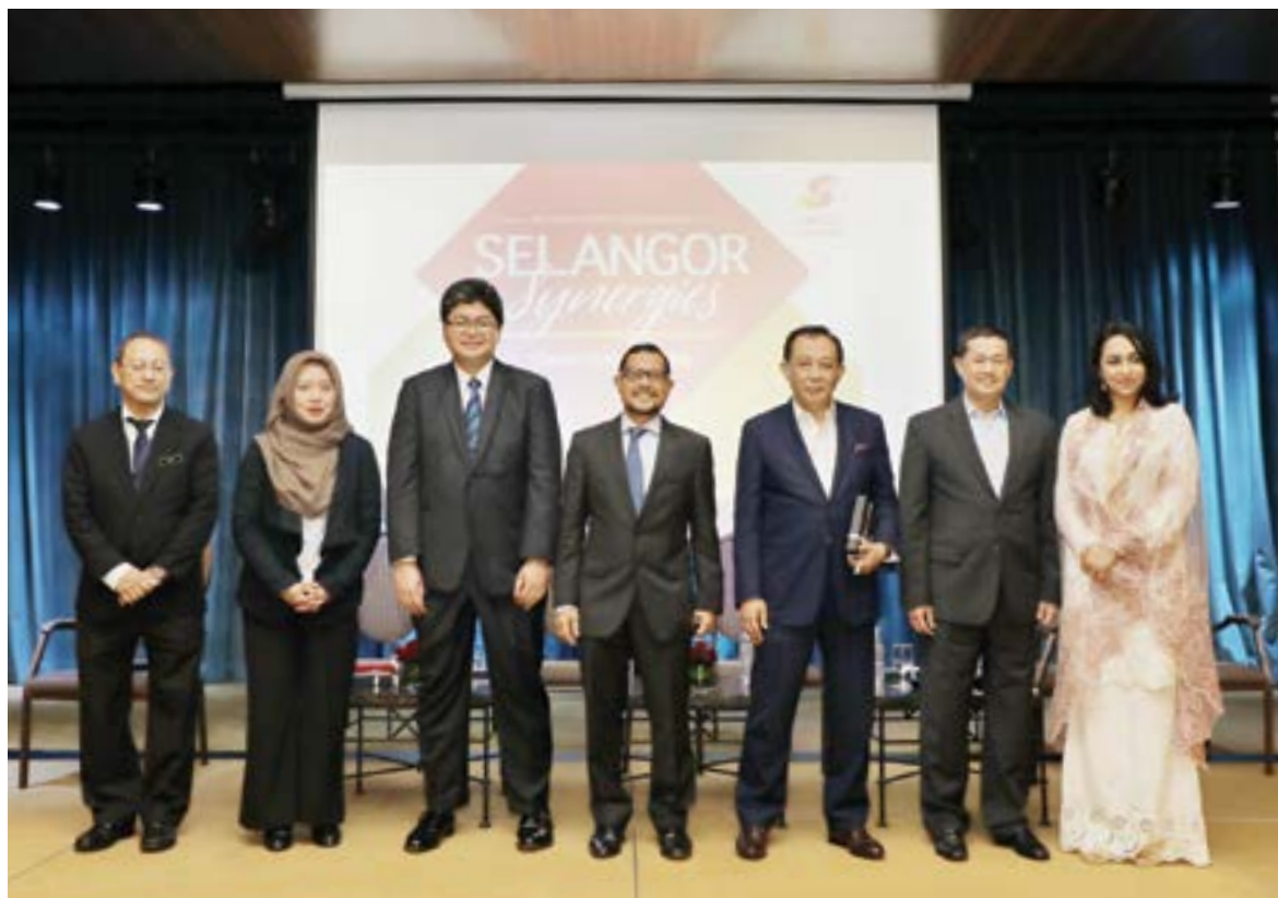
Forum 'Selangor Synergies' bincang cadangan perkaasa kaedah terkini jayakan Smart Selangor