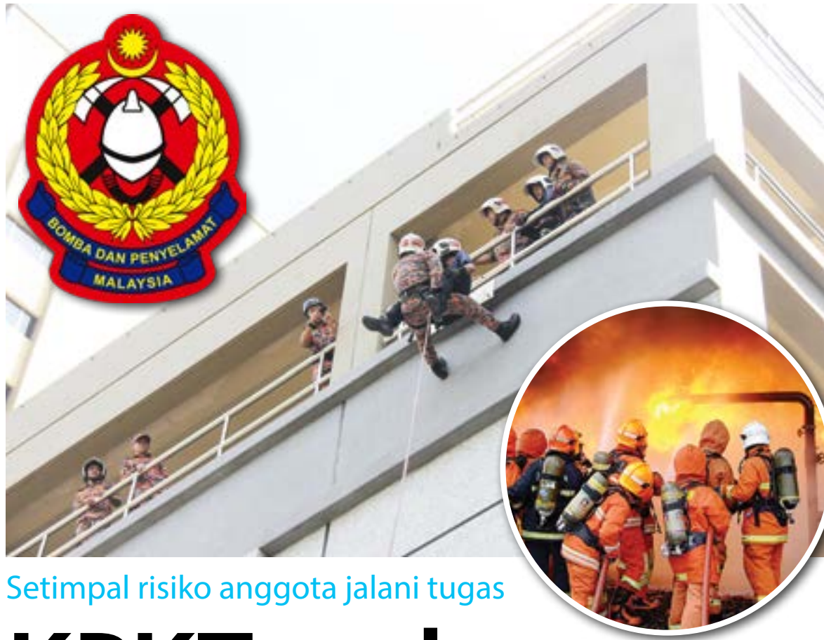
Setimpal risiko anggota jalani tugas