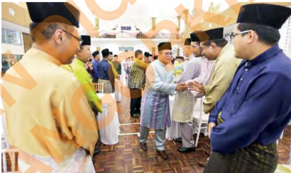
Amirudin Shari (tengah) beramah mesra bersama tetamu yang hadir pada Majlis Rumah Terbuka Hari Raya Aidiladha di Kediaman Rasmi Menteri Besar, pada 12 Ogos lalu

Pada masa sama, katanya, beliau akan berjumpa semula dengan empat EXCO Kerajaan Negeri yang menghadap DYMM Sultan Sharafuddin, pada 8 Ogos lalu.