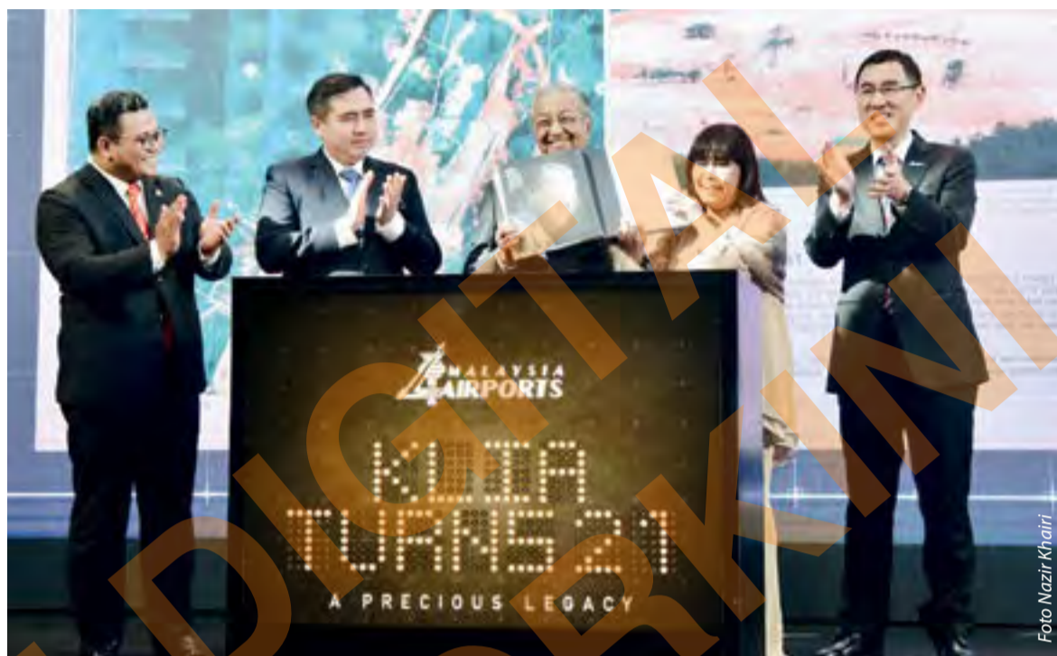
Dato' Menteri Besar Amirudin Shari (kiri) dan Menteri Pengangkutan Anthony Loke menyaksikan Perdana Menteri Tun Dr Mahathir Mohamad (tengah) melancarkan buku edisi mewah 'Up Up and Ahead' pada majlis 'KLIA turns 21: A precious legacy' di Lapangan Terbang Antarabangsa Kuala Lumpur (KLIA) pada 13 Ogos 2019

Antara tempat yang dilawati ialah Surau Nurul Muttaqi, Apartmen Seri Cempaka; Surau Nurul Falah, Putri Laksamana; Surau Al Ehsan, Apartment Laksamana Jaya B, Surau Nurul Muttaqi, Apartment Cempaka, Surau Sururul Muttaqi, Kampung Boyan dan Surau Al-Hijrah Kampung Sungai Tua.