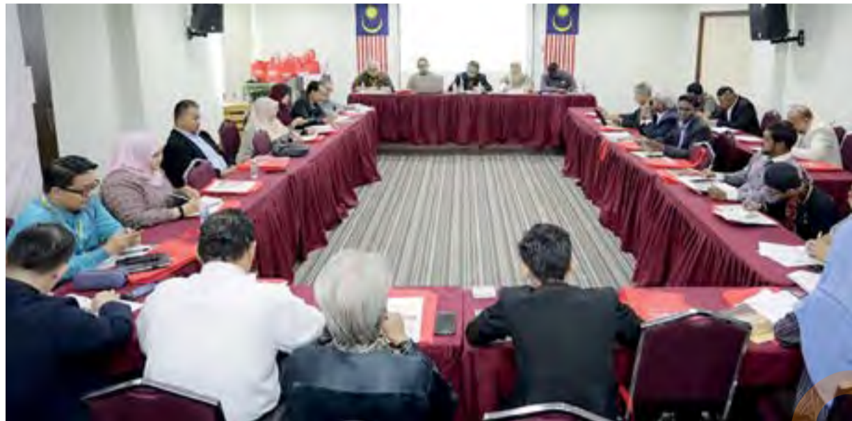
Persidangan Meja Bulat Fiqh Ta' Ayush 2019 di Bilik Seminar Institut Darul Ehsan, pada 8 Ogos lalu