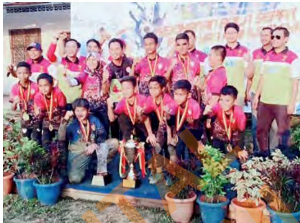
Pasukan Akademi Bola Sepak Penggerak Belia Tempatan Majlis Perbandaran Selayang Zon 2 meraikan kejayaan muncul juara Piala YAB Amirudin Shari