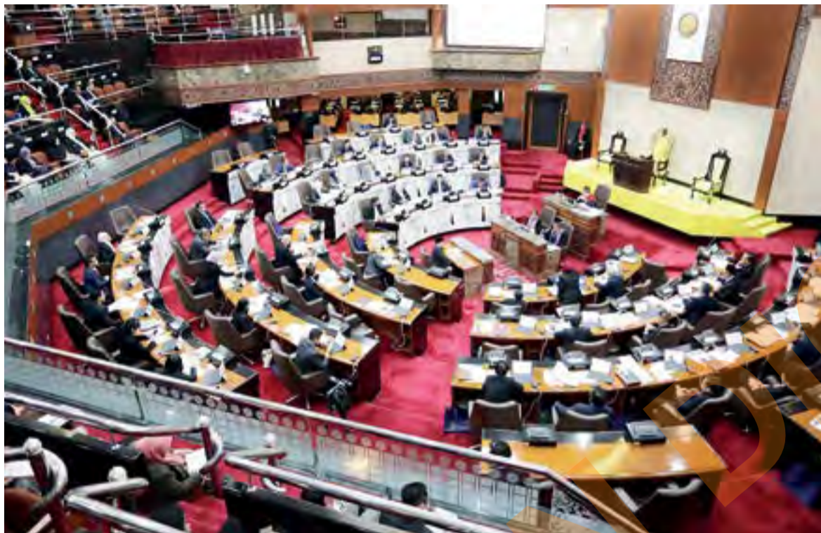
Speaker DNS bertanggungjawab memastikan perjalanan sidang DNS berjalan lancar dan tertib mengikut Peraturan Tetap DUN Selangor 1965