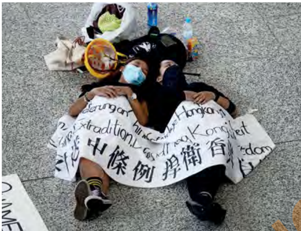
Penunjuk perasaan berbaring di Lapangan Terbang Antarabangsa Hong Kong pada 13 Ogos 2019 sebagai meneruskan bantahan, sehari selepas ia ditutup kerana protes pro-demokrasi.