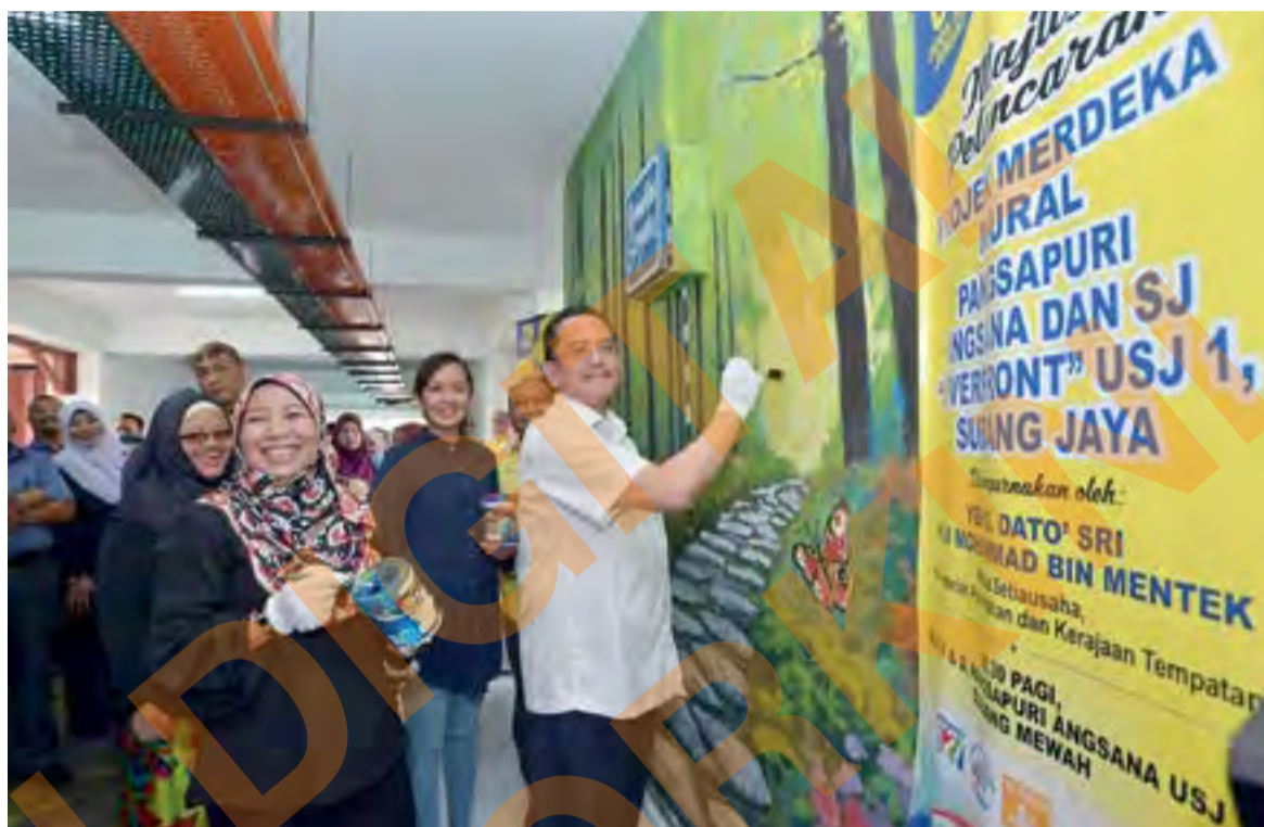
Datuk Seri Mohammad Mentek melukis mural pada dinding pangsapuri ketika Majlis Pelancaran Projek Merdeka Mural Pangsapuri Angsana dan SJ 'Riverfront' USJ 1, Subang Jaya.

"Walaupun projek ini menggunakan pelukis profesional tetapi penduduk boleh terbabit sama seperti membersihkan dinding dan membantu pelukis mengecat warna asas seperti dikehendaki," katanya.