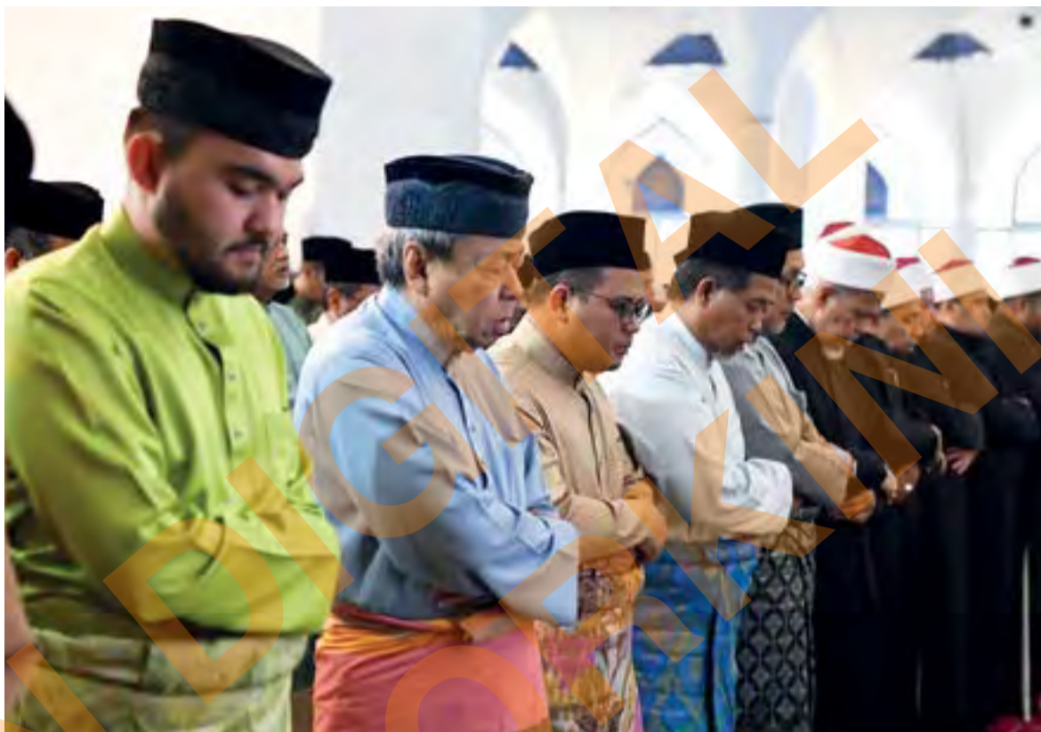
Sultan Sharafuddin Idris Shah berkenan menunaikan solat Sunat Aidiladha di Masjid Sultan Salahuddin Abdul Aziz Shah, pada 11 Ogos lalu

"Ibadah haji juga mengajak umat Islam supaya menghayati semangat kesatuan berteraskan ketauhidan kepada Allah SWT, mengelak perpecahan walaupun berbeza bangsa dan warna kulit," katanya.