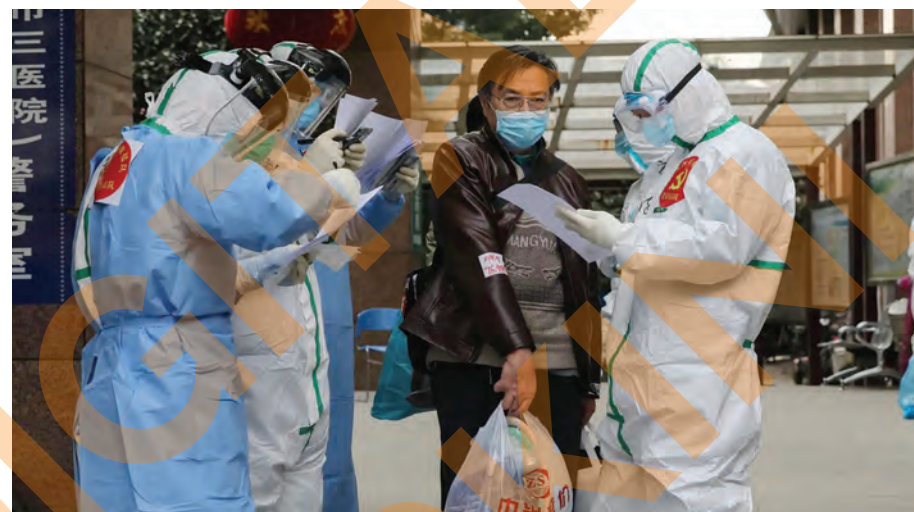
Pegawai perubatan memeriksa maklumat pesakit yang disahkan bebas jangkitan Covid-19 di sebuah hospital di Wuhan pada 4 Mac lalu.

Agensi di bawah naungan Pertubuhan Bangsa-Bangsa Bersatu (PBB) itu bimbang