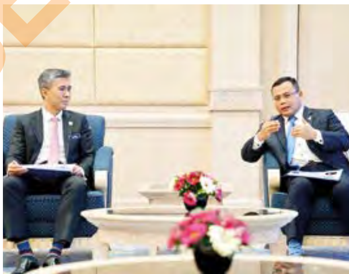
Amirudin (kanan) bertemu Zafrul membincangkan kerjasama membangunkan ekonomi di Putrajaya pada 23 April lalu

"Moga dapat terus bekerjasama dalam usaha melindungi rakyat, menyokong perniagaan dan memperkukuhkan ekonomi," tulisnya.