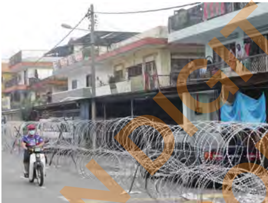
Suasana sekitar perumahan di Bandar Baru Selayang yang merupakan antara kawasan yang dikuatkuasakan Perintah Kawalan Pergerakan Diperketatkan (PKPD) ketika tinjauan SelangorKini pada 29 April 2020

Jabatan Kesihatan Negeri Selangor juga melaksanakan ujian Covid-19 kepada semua penduduk di zon tersebut pada kadar segera bagi mengenal pasti individu yang positif.