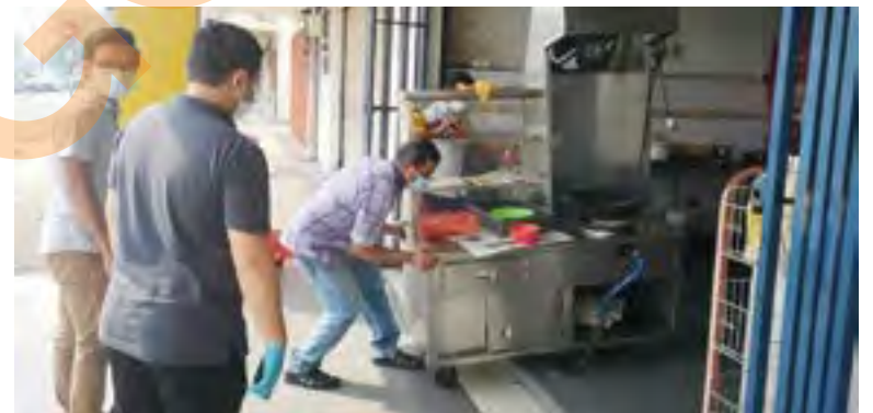
Seorang peniaga dilihat mengemas peralatan perniagaan ketika pemeriksaan Jabatan Undang-Undang MPK pada 23 April lalu