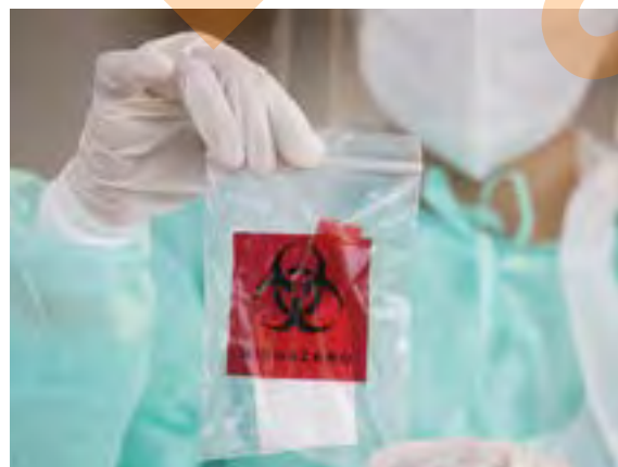
Petugas kesihatan menunjukkan sampel ujian saringan Covid-19 yang dibuat melalui kaedah pandu lalu di Seksyen 7, Shah Alam pada 20 April lalu

KUALA LUMPUR – Perdana Menteri Tan Sri Muhyiddin Yassin pada 25 April lalu menyertai beberapa pemimpin dunia dalam menggesa kolaborasi global untuk menyegerakan usaha penghasilan vaksin untuk Covid-19 yang menjajutkan dunia dengan teruk.