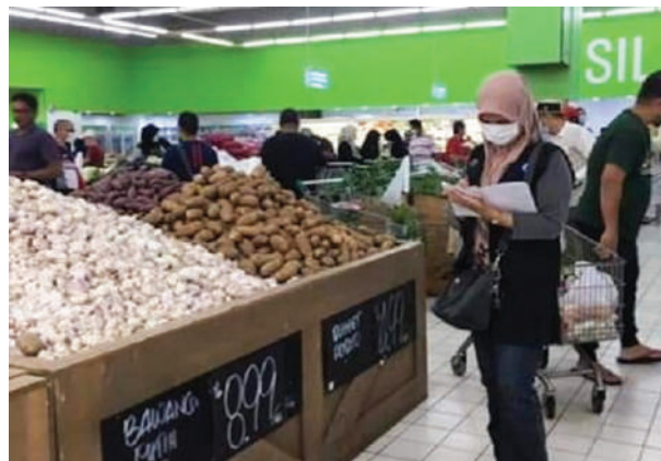
▲国内贸消部官员检查龙溪公共巴刹的物价。