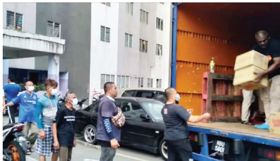
▲工作人员派发食品给人民组屋的住户。