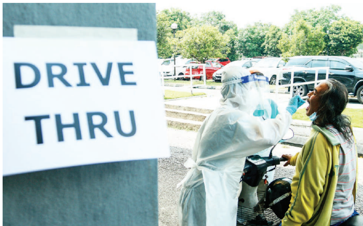
▲一名医护人员在雪州政府于莎阿南设立的“免下车检测站”，采集一名摩托车骑士的样本以检测新型冠状病毒。

州政府之后陆续在其他红色疫区展开“免下车新型冠状病毒检测”服务，为高风险的乐龄人士和疑似患者提供免费的检测服务，至今已在莎阿南、雪邦、乌鲁雪兰莪和鹅唛区展开类似的病毒检测活动。