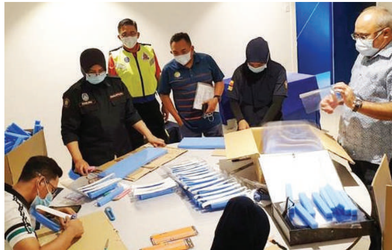
◀执法组人员动手自制面罩, 为前线人员出一份力, 右为八打灵再也市长拿督沙尤迪。