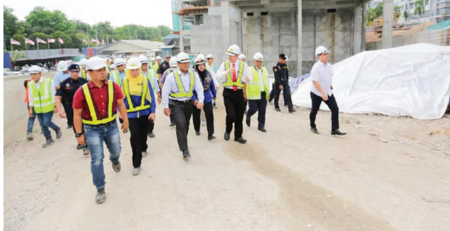
▼沙白安南县议会将延长管辖区内的工程施工期限。(档案照)

为了避免行骗者继续招摇过市, 以及更多商家和民众受骗, 县议会透过各管道加强宣传, 以澄清县议会的消毒活动绝无收费, 以正视听。