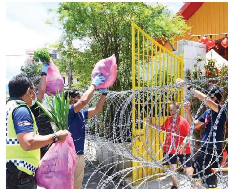
▲工作人员上门派发物资给被限制行动的士拉央峇鲁区的居民。