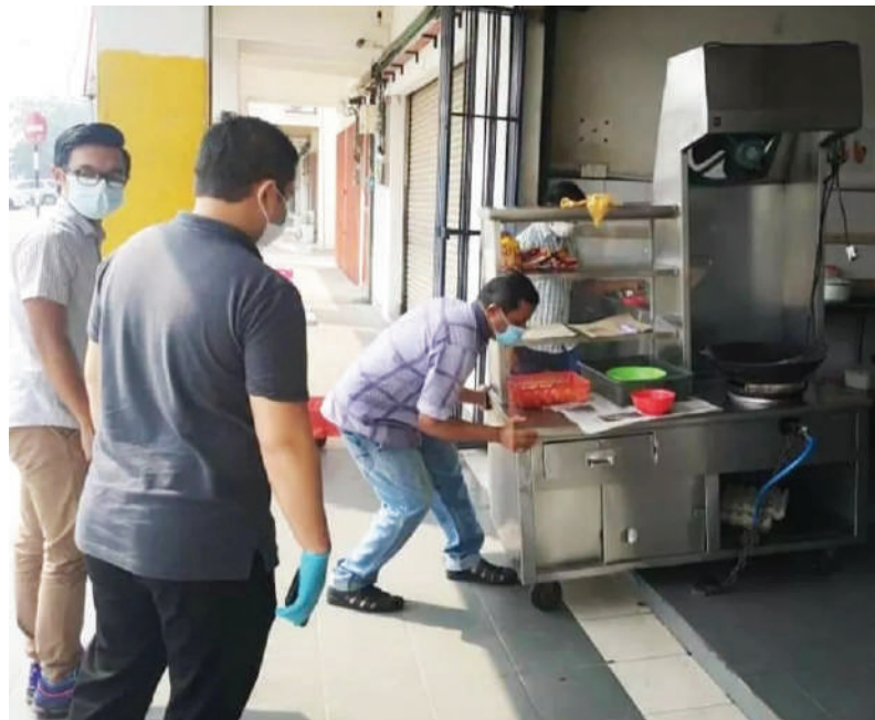
▲巴生市议会法律小组官员检查各商业区的情况。

当局也要求顾客上门购物时戴口罩, 同时指示商家不要占用店铺外的五脚基, 以免阻碍民众。