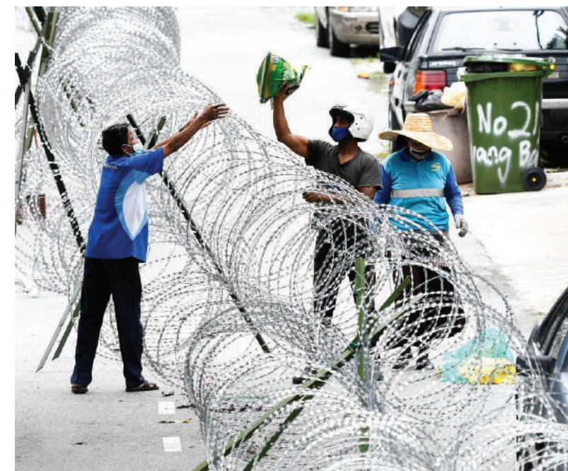
▲工作人员在士拉央峇鲁区派发物资给当地居民。