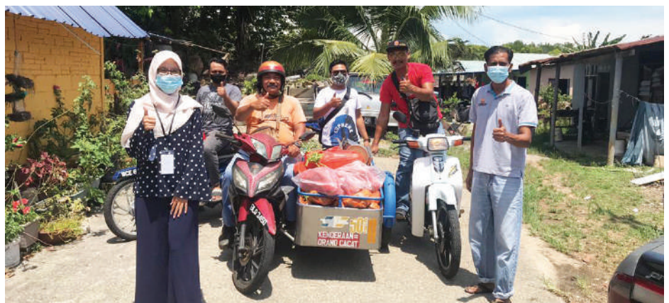
▲祖华丽雅服务中心职员把蔬果分配给选区的贫困户。

“除了一些地方需要志工协助逐户派发,而设有联合管理机构(JMB)的公寓及花园排屋,会由该机构代为发分,如果没有成立联合管理机构的,志工会协助派发,整个发放工作会在一星期内完成。”