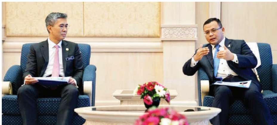
▼雪州大臣拿督斯里阿米鲁丁(右)与财政部长拿督斯里东姑赛夫鲁在财政部会晤。

州政府早前也宣布豁免这些高楼住户一个月的租金, 以减轻他们在新冠肺炎疫情期间的经济负担。除了豁免缴付4月份的租金外, 住户还可暂缓缴付为期2个月的房屋, 即今年5月和6月份的房租。