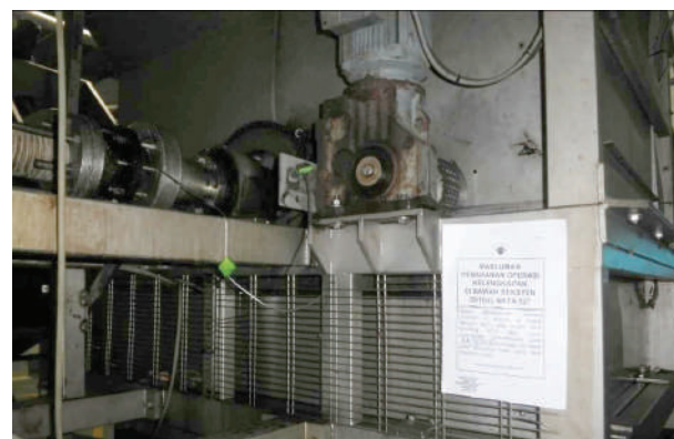
▲雪州环境局下令衍生环境污染问题的士毛月一家食品加工厂停工。