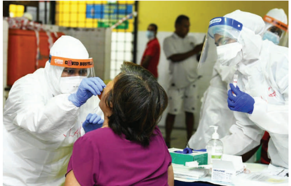
▲八打灵县卫生局官员为灵市2个巴刹的小贩进行新冠病毒检测。

此外, 佐哈里也吁请在4月11日至25日期间曾到访美嘉花园巴刹的民众, 以及在4月5日至18日期间曾到访奥曼路巴刹的民众可浏览八打灵再也市政厅脸书, 上网填写表格, 卫生局官员会将联系他们以前往邻近的政府诊疗所进行病毒检测。