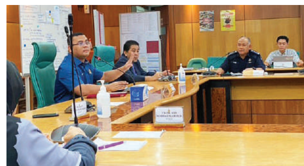
▲阿米鲁丁（左）在雪州政府大厦主持“雪州新冠病毒疫情会议”。

阿米鲁丁说，州政府一直都关心处于管制令期间的民生状态，所以在作出任何决策时都采取深入、同理和最佳的方式，以减缓疫情所带来的经济和社会冲击。