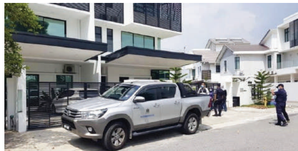
▲巴生市议会突击检查武吉拉惹镇的一间非法陪月中心。

文告指出, 官员在检查后发现这间陪月中心在没有营业执照的情况下, 已非法运作数月之久。