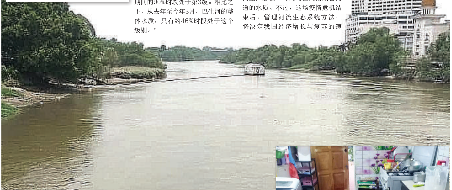
▲巴生河面在行动管制令期间变干净了!

他说, 当局正探讨加强执法和严厉处罚污染河流人士, 而直接(靠近河流工厂、农场及工地)与间接(快速消费品、化工、乳胶业等制造商及经销商)污染河流公司, 也需与河流管理方合作, 共同拯救河流生态。