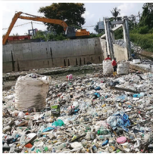
▲工作人员在4月初于巴生河口捞取的垃圾画面。