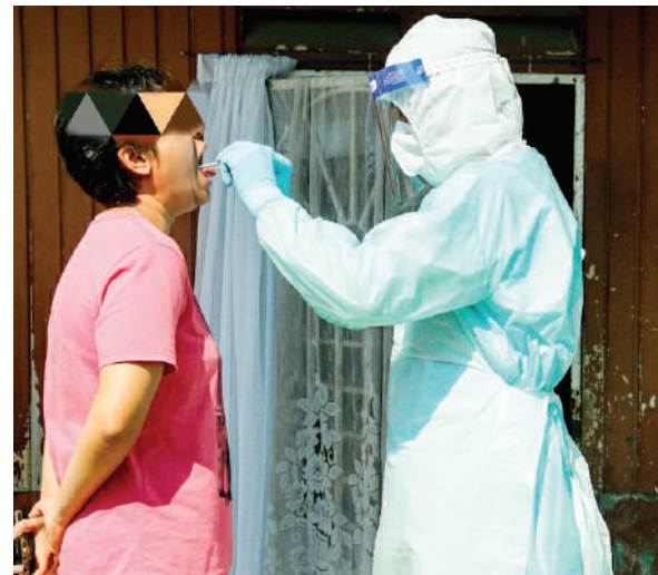
▲雪州医护队伍走入巴生兰斗班让，为当地居民进行新冠病毒检测。