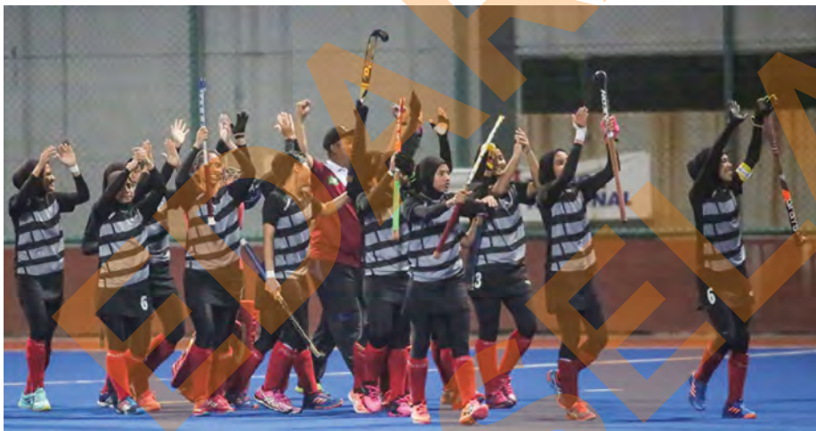
Pasukan Hoki Wanita Selangor ketika menjuarai Hoki Wanita Piala Razak 2017