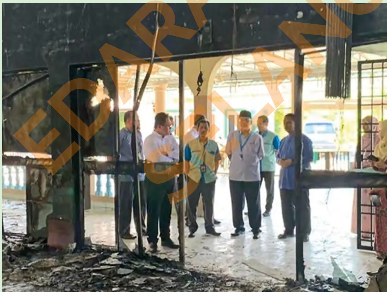
HANGUS... Pegawai Majlis Agama Islam Selangor (Mais) dan Yayasan Islam Darul Ehsan (Yide) meninjau keadaan struktur dalaman Surau Al-Firdaus, Taman Banting Baru, Kuala Langat yang hampir 80 peratus musnah akibat litar pintas pada 19 Julai lalu. Kerugian dianggarkan RM250,000

"Hal ini membuktikan Selangor sebagai sebuah destinasi pelancongan serba mempesona, ditambah pula dengan pakej pelancongan bercirikan Islamik terbaharu mempunyai potensi untuk dikomersialkan sebagai tarikan unik dan tersendiri," katanya.