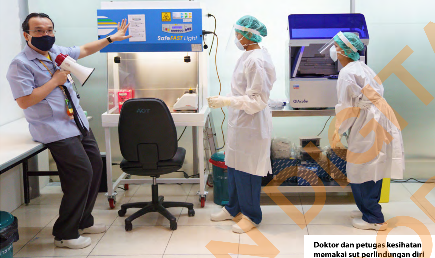
Doktor dan petugas kesehatan memakai sut perlindungan diri menunjukkan proses saringan Covid-19 di Lapangan Terbang Antarabangsa Suvarnabhumi, Bangkok bagi memutuskan rantai wabak itu di Thailand pada 3 Jun lalu.

BANGKOK - Thailand mengetatkan lagi peraturan bagi warga asing yang ingin memasuki negara itu susulan kemunculan dua kes import Covid-19 yang mencetuskan kebimbangan kewujudkan gelombang baharu.