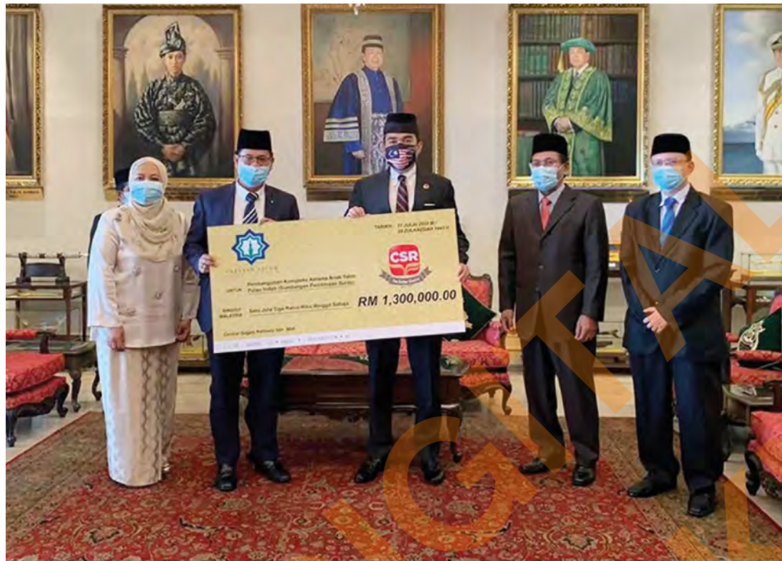
DYTM Raja Muda Selangor, Tengku Amir Shah ibni Sultan Sharafuddin Idris Shah Alhaj (tengah) memegang cek curi bernilai RM1.3 juta dari Central Sugars Refinery Sdn Bhd bagi pembinaan Kompleks Anak Yatim Yide