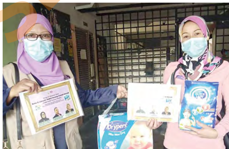
Penyelia Pusat Wanita Berdaya (PWB) Taman Medan menyampaikan bantuan lampin dan susu kepada golongan memerlukan

SHAH ALAM - Kerajaan Negeri melalui Pusat Wanita Berdaya (PWB) memperuntukkan RM336,000 dalam bentuk bantuan susu dan lampin bayi kepada mangsa terkesan Covid-19.