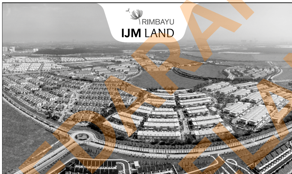
UNIT BUMIPUTERA DAN RUMAH CONTOH SEDIA DIKUNJUNGI

"Peratus keseluruhan bagi penduduk 15 hingga 64 tahun (umur bekerja) juga menurun daripada 69.8 peratus pada 2019 kepada 69.7 peratus pada 2020," katanya. - BERNAMA