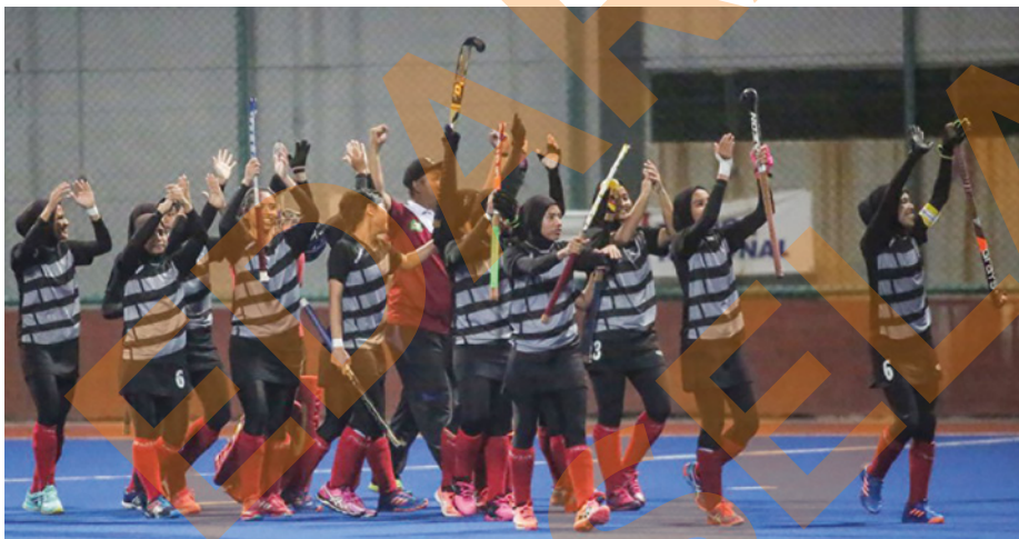
Pasukan Hoki Wanita Selangor ketika menjuarai Hoki Wanita Piala Razak 2017