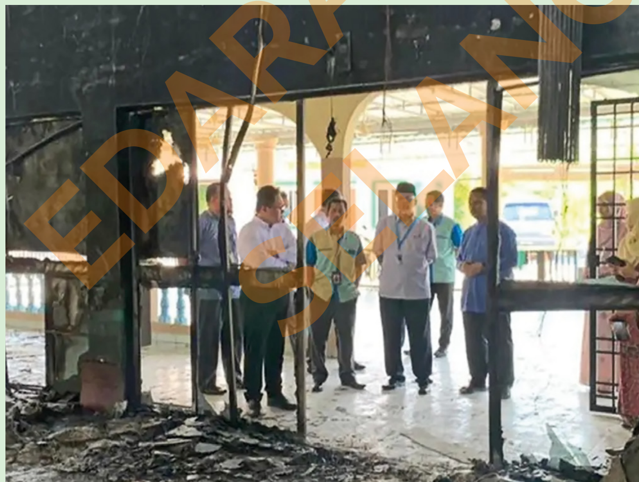
HANGUS... Pegawai Majlis Agama Islam Selangor (Mais) dan Yayasan Islam Darul Ehsan (Yide) meninjau keadaan struktur dalaman Surau Al-Firdaus, Taman Banting Baru, Kuala Langat yang hampir 80 peratus musnah akibat litar pintas pada 19 Julai lalu. Kerugian dianggarkan RM250,000

"Hal ini membuktikan Selangor sebagai sebuah destinasi pelancongan serba mempesona, ditambah pula dengan pakej pelancongan bercirikan Islamik terbaharu mempunyai potensi untuk dikomersialkan sebagai tarikan unik dan tersendiri," katanya.