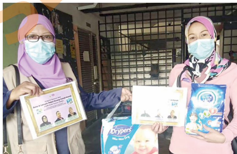
Penyelia Pusat Wanita Berdaya (PWB) Taman Medan menyampaikan bantuan lampin dan susu kepada golongan memerlukan

SHAH ALAM - Kerajaan Negeri melalui Pusat Wanita Berdaya (PWB) memperuntukkan RM336,000 dalam bentuk bantuan susu dan lampin bayi kepada mangsa terkesan Covid-19.