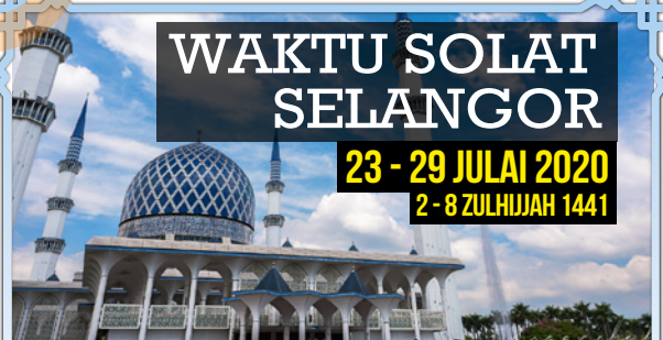
Gombak, Hulu Selangor, Rawang, Hulu Langat, Sepang, Petaling dan Shah Alam