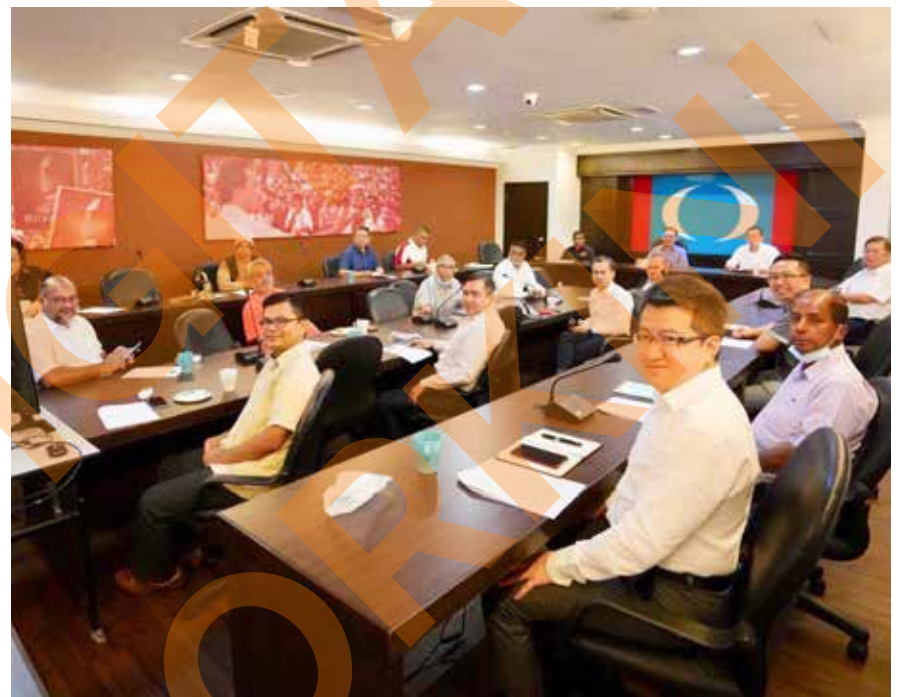
Anwar mempengerusikan mesyuarat Majlis Presiden PAKATAN di Ibu Pejabat KEADILAN pada 6 Julai

Majlis Presiden juga mahu meneruskan usaha mengembalikan mandat rakyat dengan menjadikan PAKATAN sebagai Kerajaan Persekutuan. Mesyuarat tersebut diadakan menjelang sidang Parlimen yang dijadual pada 13 Julai.