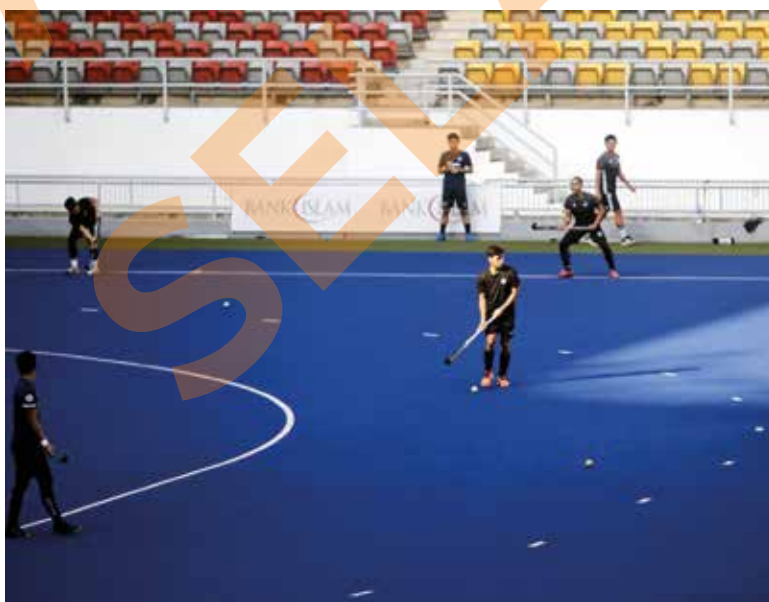
Skuad hoki kebangsaan giat berlatih di Stadium Hoki Nasional Bukit Jalil pada 1 Julai.

"Kebanyakan pemain sangat teruja hendak pegang kayu hoki, tapi kita manusia, tak sempurna, jadi ada yang rasa macam berat nak datang latihan. Inilah tujuan latihan, dalam seminggu pasti ok,