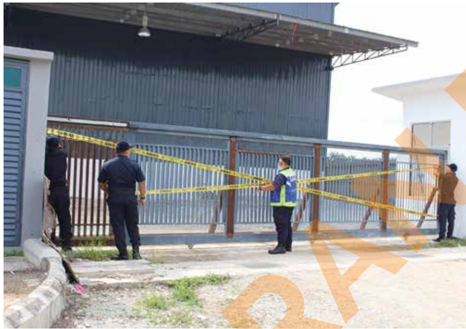
Penguat kuasa MPKL memasang pita sita di sebuah kilang di Bukit Changgang dalam operasi pada 2 Julai

SHAH ALAM - Majlis Perbandaran Kuala Langat (MPKL) menyita sebuah kilang di kawasan perindustrian Bukit Changgang, Kuala Langat kerana menambah struktur bangunan tanpa kebenaran pada 2 Julai lalu.