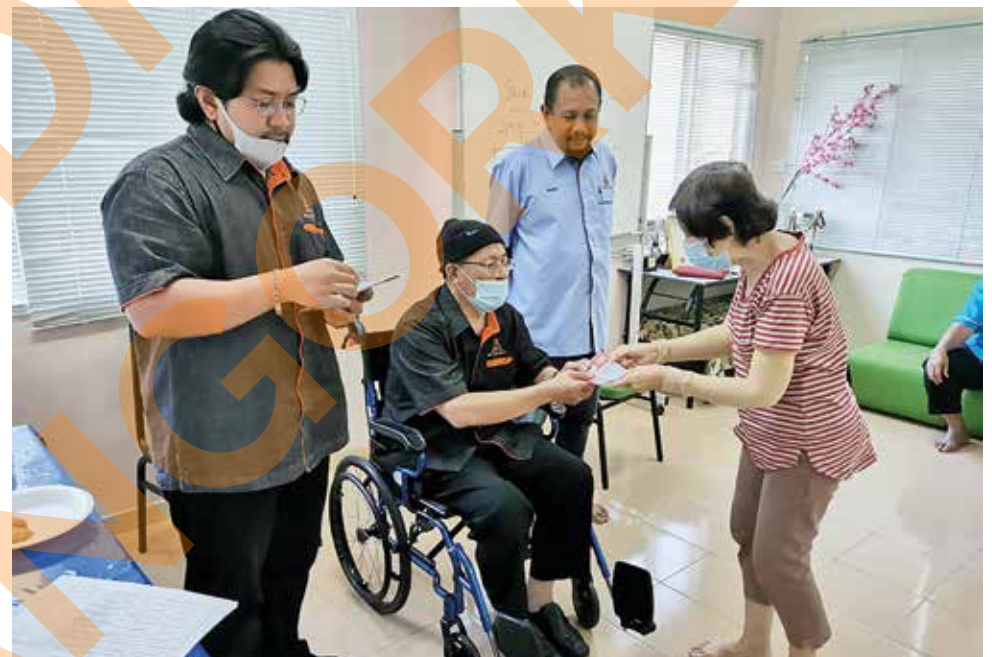
ADN HULU KELANG Saari Sungib

Bersama wakil Air Selangor memeriksa paip di Kampung Cempaka, Petaling Jaya