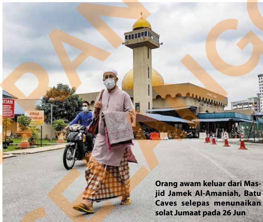
Orang awam keluar dari Masjid Jamek Al-Amaniah, Batu Caves selepas menunaikan solat Jumaat pada 26 Jun

"Terima kasih kepada Dato' Menteri Besar atas bantuan kali kedua ini. Kami bersyukur dan akan menggunakan bantuan ini sebaiknya," katanya.