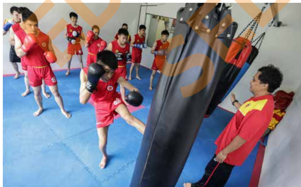
Atlet wushu sanda Selangor menjalani latihan bagi persiapan SUKMA di Pusat Latihan Wushu Selangor, Rawang pada 5 Julai

"Saya berharap ibu bapa mereka faham dengan keadaan sekarang kerana kita sudah hampir ke SUKMA. Sebelum Perintah Kawalan Pergerakan juga mereka berlatih lima hari seminggu," katanya.