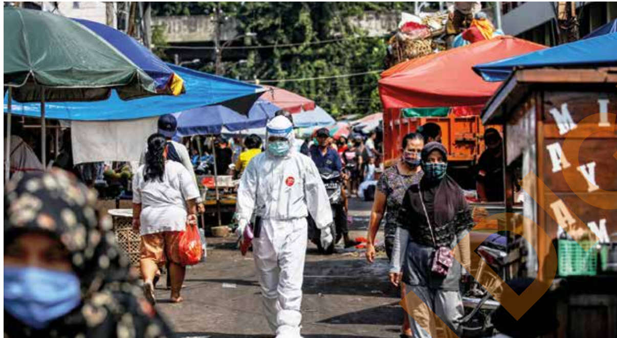
Seorang pekerja kesihatan memakai sut pelindungan diri membawa sampel ujian calitan berjalan melalui pasar tradisional di Jakarta, Indonesia pada 25 Jun.