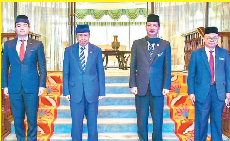
▲卫生总监拿督诺希山（左2）觐见雪州苏丹沙拉夫丁（右2），左为雪州王储东姑阿末尔沙。

（莎阿南讯）雪兰莪苏丹沙拉夫丁召见领导国家抗疫重任的卫生总监拿督诺希山，并表达了殿下感谢全体前线人员为保家卫国所作出的牺牲和贡献。