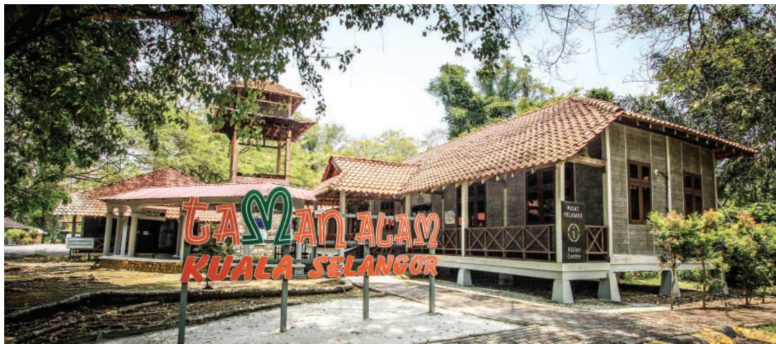
▲ 瓜雪县议会提升瓜雪自然公园的基本设施。

她说，瓜雪在2019年的游客人次相比过去增加30%，增加了地方政府的收入，同时带动瓜雪各行各业的经济。