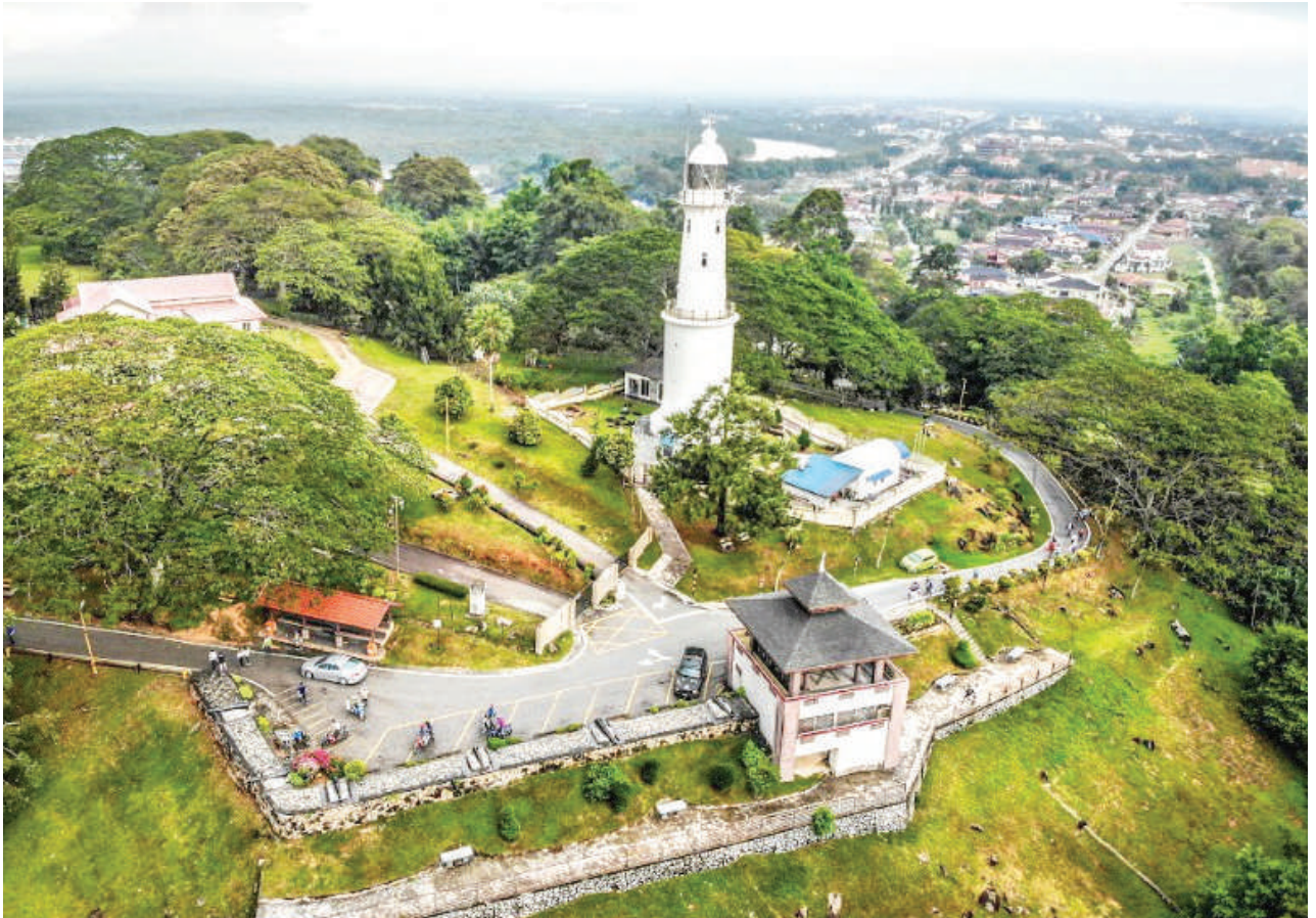
▲ 景色优美的美拉华蒂山在特区规划发展蓝图草案中被列为发展重点之一。