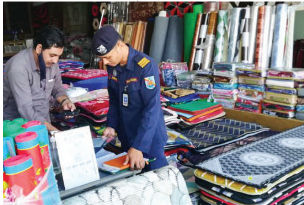
▲乌雪县议会执法人员在行动中查封2间由外劳经营的店铺。

安排执照组及执法组官员监督，确保访客及小贩都遵守标准作业程序，其中访客禁止携带13岁以下的孩童进入早夜市，希望家长们谅解。”