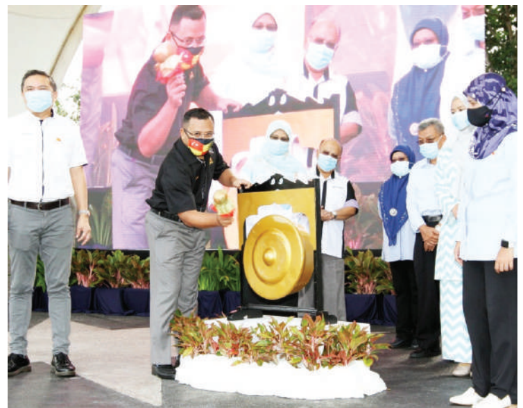
▶ 雪州大臣阿米鲁丁(左2)为《2025年瓜雪美拉华蒂城镇特区发展蓝图》草案主持推介礼，左起雪州行政议员黄思汉、阿米鲁丁和雪州行政议员罗芝雅。