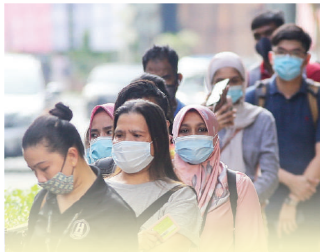
▲东盟各国之间应加强合作关系以携手应对新冠肺炎疫情的挑战。

民众若查询详情可联络03-21933000 (星期一至星期五, 上午9时至下午5时), 或浏览官网 http://www.ptptn.gov.my 。