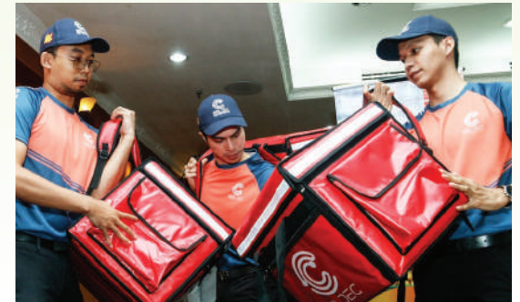
▲雪州政府推出报考摩托驾照补贴计划以协助城市的贫困青年改善生活条件。

此外,州政府将与电召服务供应商 Mat Despatch 在摩托驾照计划提供培训,提供年轻人就业机会。