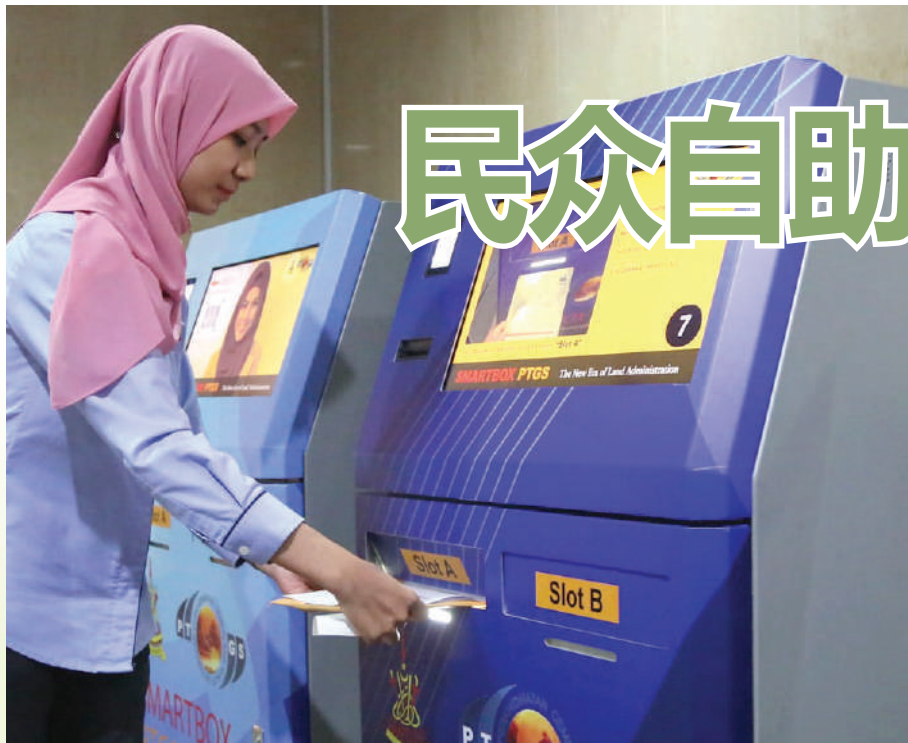
▲雪州土地及矿物局官员示范如何使用“智能箱”以提交土地拥有权申请文件。

(莎阿南讯)雪州土地及矿物局推出全马首个“土地拥有权自助交接”服务，让民众通过自助服务机呈交和领取土地拥有权的相关文件，以减少官员与民众在服务柜台所面对的新肺炎受感染风险。