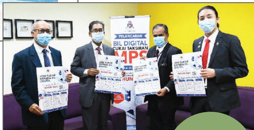
把账单发给业主,更省时省事。”

市议会就此展开资料更新工作以收集管辖区内的业主资料,以便日后能发出电子账单给业主。