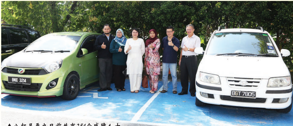
▲八打灵再也目前共有251个残障人士专用停车位,为残障人士营造更友善的无障碍环境。(档案照)

他说,有关接驳车负责接载残障人士前往马大医药中心、阿松大医院(Assunta)、敦胡先翁国家眼科医院、市政厅规定的诊所或医院、社会福利局、国民登记局和大马社会保险机构,且民众必须提前致电预约03-7956 0203,并以前往邻近地点为优先考虑。