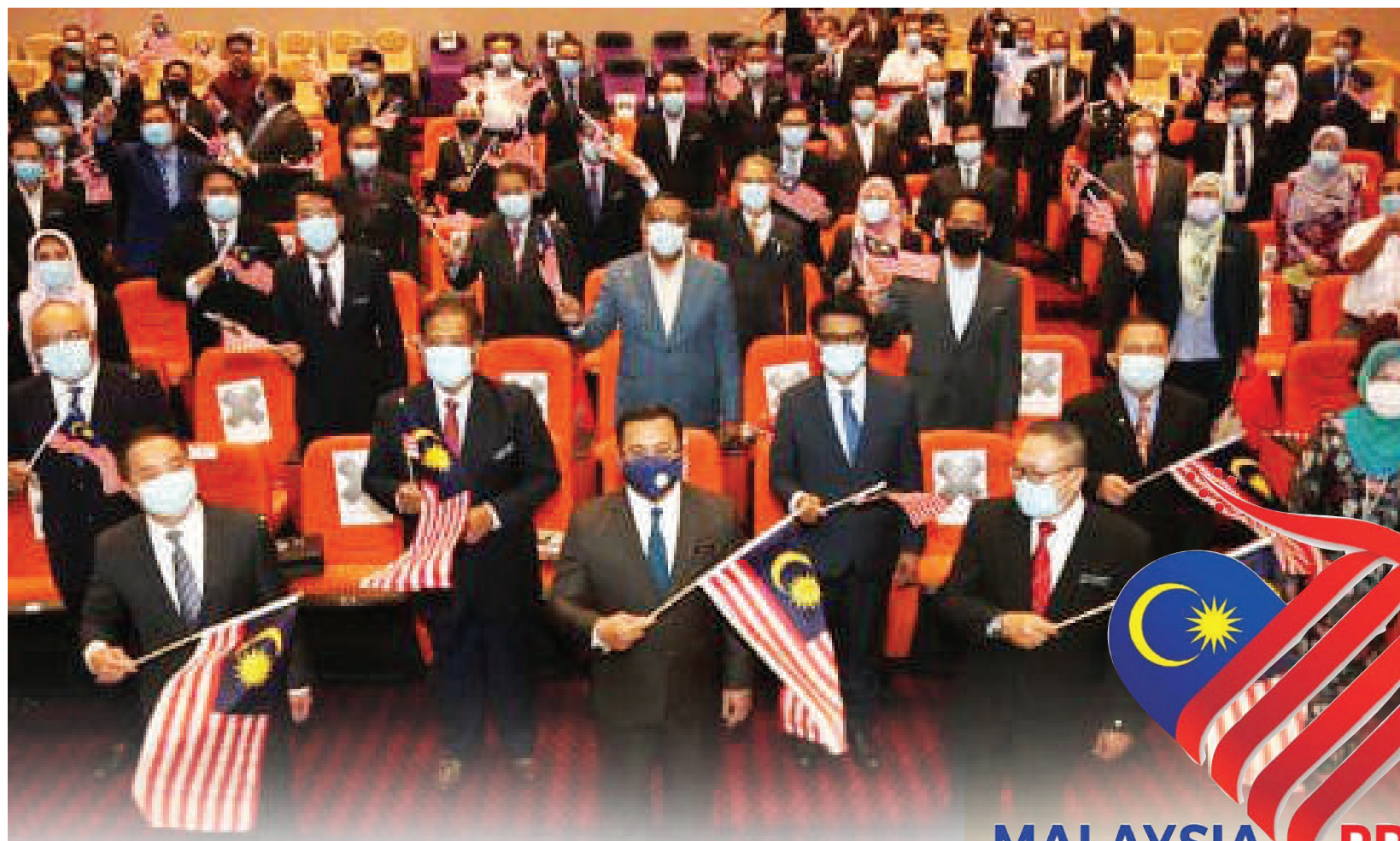
◀雪州大臣拿督斯里阿米鲁丁（前排中）与公务员挥动手中的辉煌条纹，为雪州国庆月活动拉开帷幕。

他也归功于团结强大的州行政团队，以及抗疫特工队和人民的配合，令抗疫工作能有效展开。