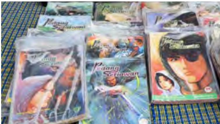
▲ Siri komik terjemahan Pedang Setiawan karya Ma Wing-shing dari Hong Kong yang menjadi kegliaan anak muda lewat tahun 90-an berbalut plastik