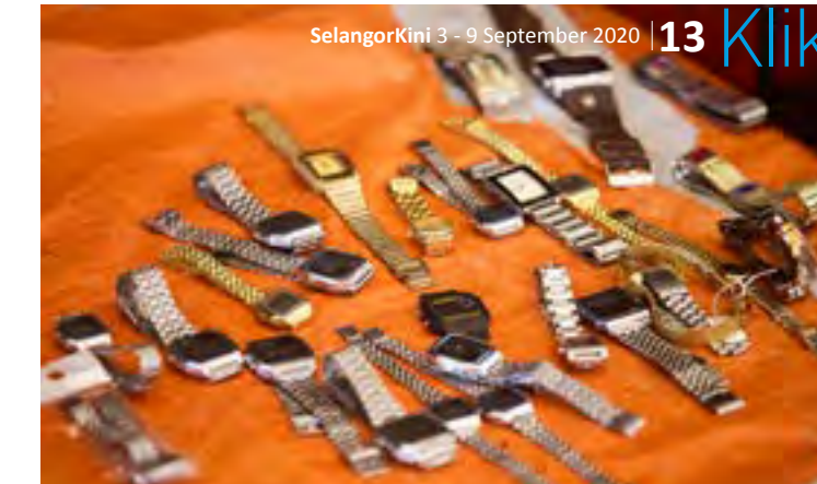
▲ Aneka jam tangan yang popular dalam era 80-an dan 90-an termasuk jenama Casio