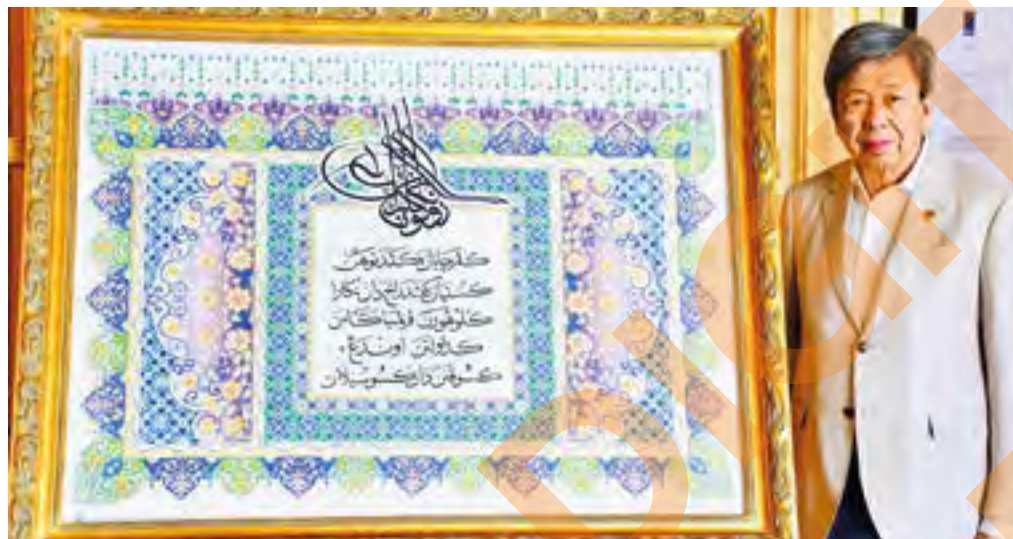
DYMM Sultan Selangor bersama Rukun Negara dalam tulisan jawi yang dibingkai

Bagaimanapun, Sultan Sharafuddin gembira berikutan usaha