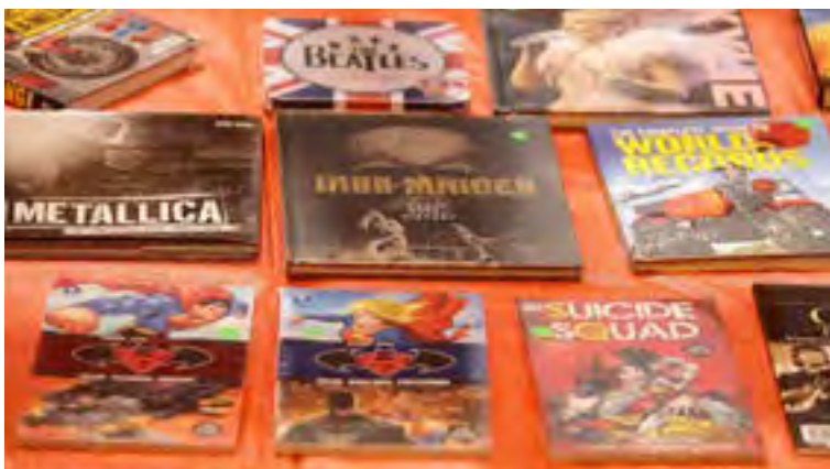
▲ Buku berkaitan kumpulan rock Metallica dan Iron Maiden, dua aliran muzik heavy metal terkenal dunia. Irama itu popular pada era 80-an. Pelbagai buku lain juga dipamerkan