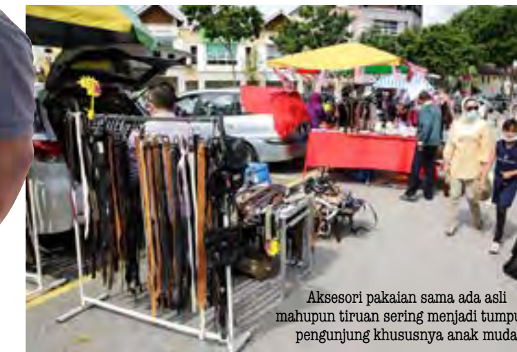
▲ Aksesori pakaian sama ada asli mahupun tiruan sering menjadi tumpuan pengunjung khususnya anak muda