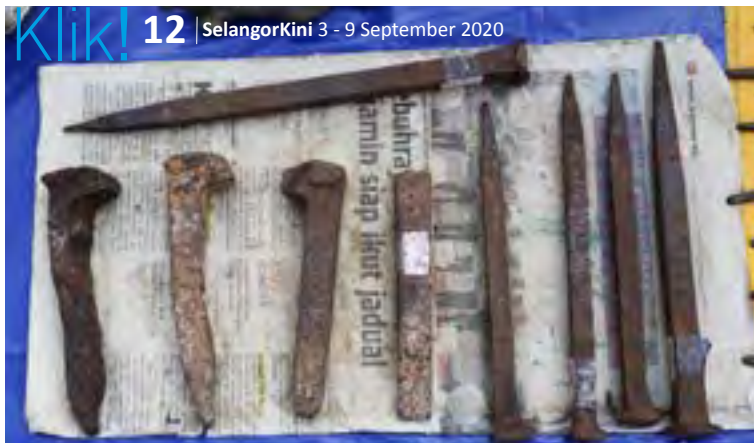
▲ Paku pasung atau paku tiang seri berusia hampir 70 tahun yang biasanya ditemui pada rumah orang Melayu dahulu kala ada dijual