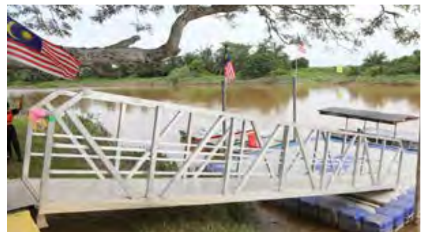
Pemandangan jeti terapung di Pangkalan Jeti Kampung Asahan, Bestari Jaya pada 30 Ogos

"Ini janji saya kepada penduduk terutama belia Kampung Asahan. Saya sudah nyatakan hasrat ini kepada Kerajaan Negeri dan perbinangan lanjut sedang dijalankan," katanya.