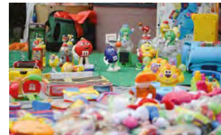
▲ Aneka corak dan bentuk anak patung terpakai dipamerkan dengan susun atur kreatif