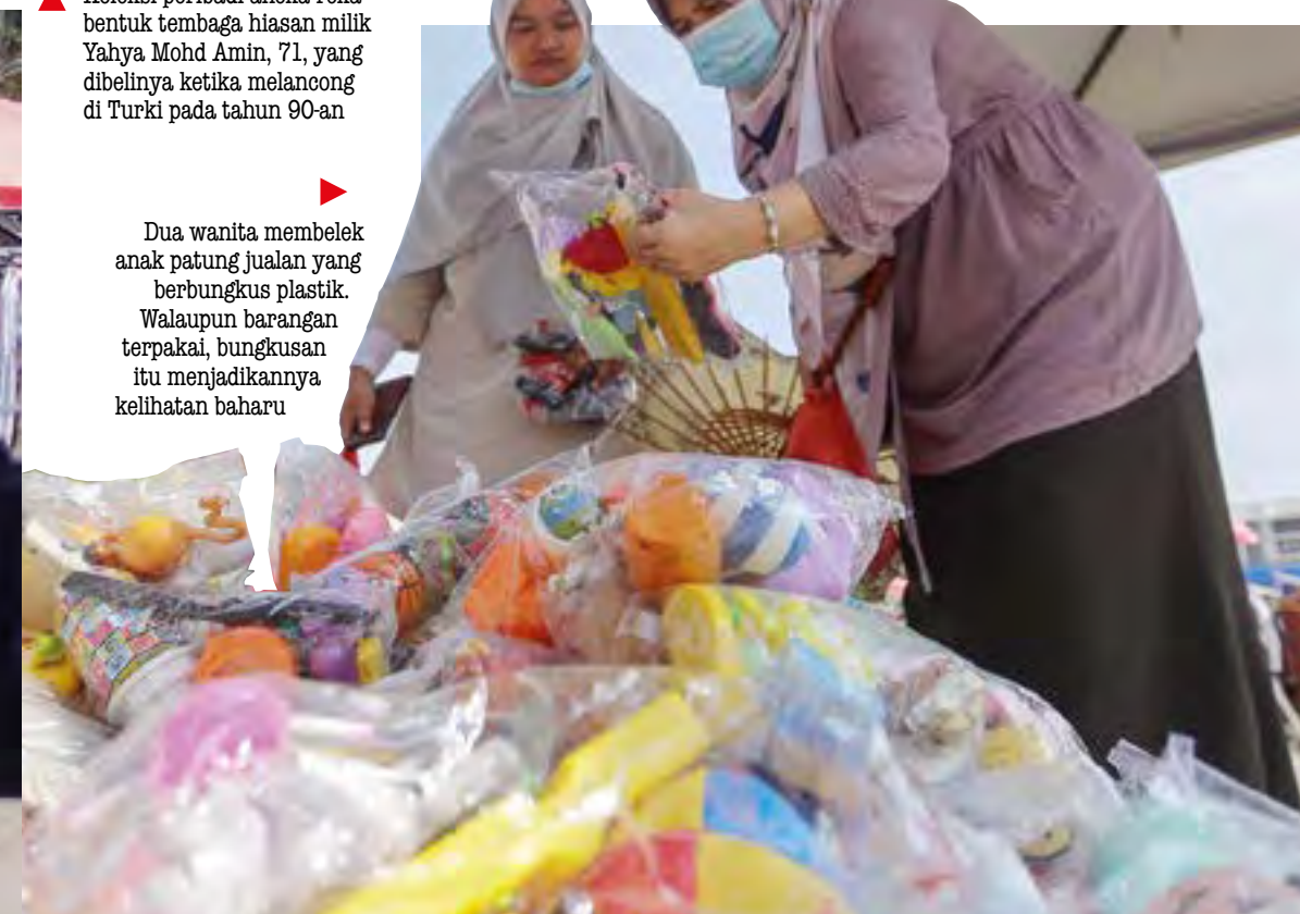
▶ Dua wanita membelek anak patung jualan yang bungkus plastik. Walaupun barangan terpakai, bungkusannya itu menjadikannya kelihatan baharu