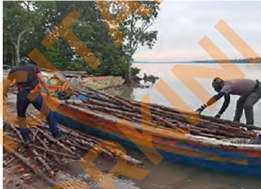
Antara longgokan kayu jaras bakau yang disita berhampiran Sungai Kembung, Pulau Indah pada 23 Ogos

Mereka disiasat mengikut Seksyen 84(1) Enakmen (Pemakaian) Akta Perhutanan Negara 1985 dan jika disabitkan boleh didenda tidak lebih RM200,000 atau dipenjarakan tidak kurang setahun atau kedua-duanya.