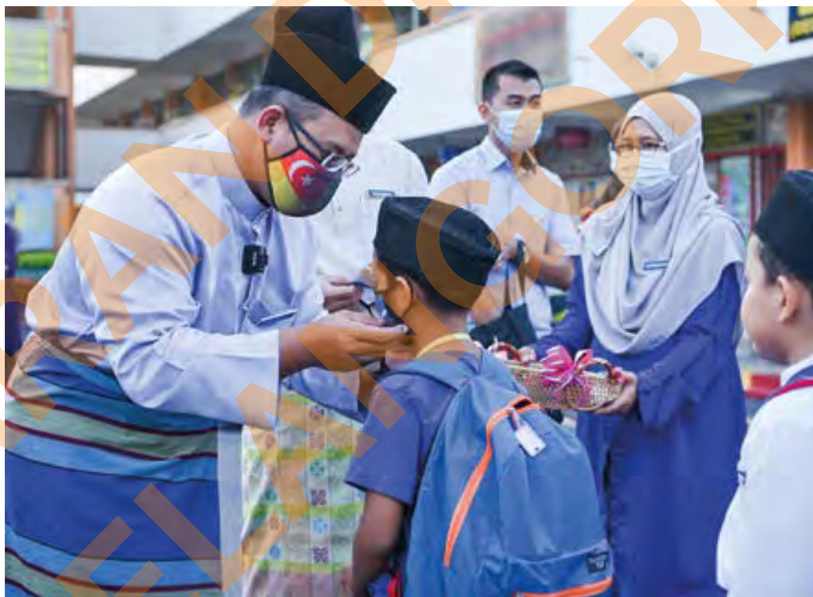
Dato' Menteri Besar Dato' Seri Amirudin Shari memakaikan pelitup muka boleh guna semula kepada pelajar Sekolah Rendah Agama Integrasi Seksyen 19, Shah Alam pada 28 Ogos 2020 yang diagih secara percuma.