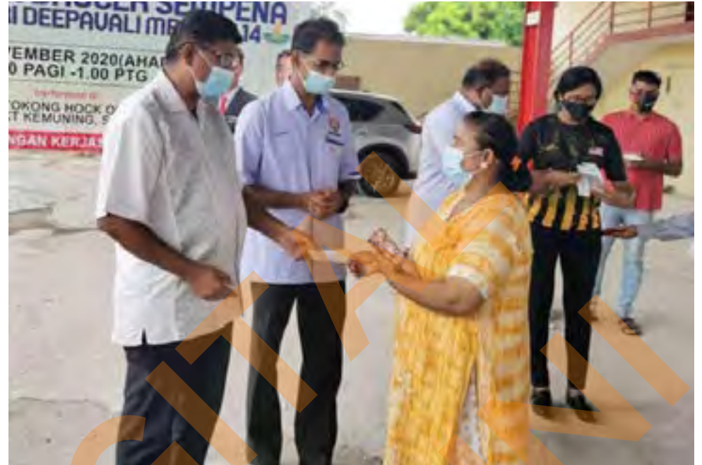
ADN KOTA KEMUNING Ganabairau Veraman

Menyerahkan sumbangan sempena Deepavali kepada penduduk Taman Mutiara, Kuala Langat