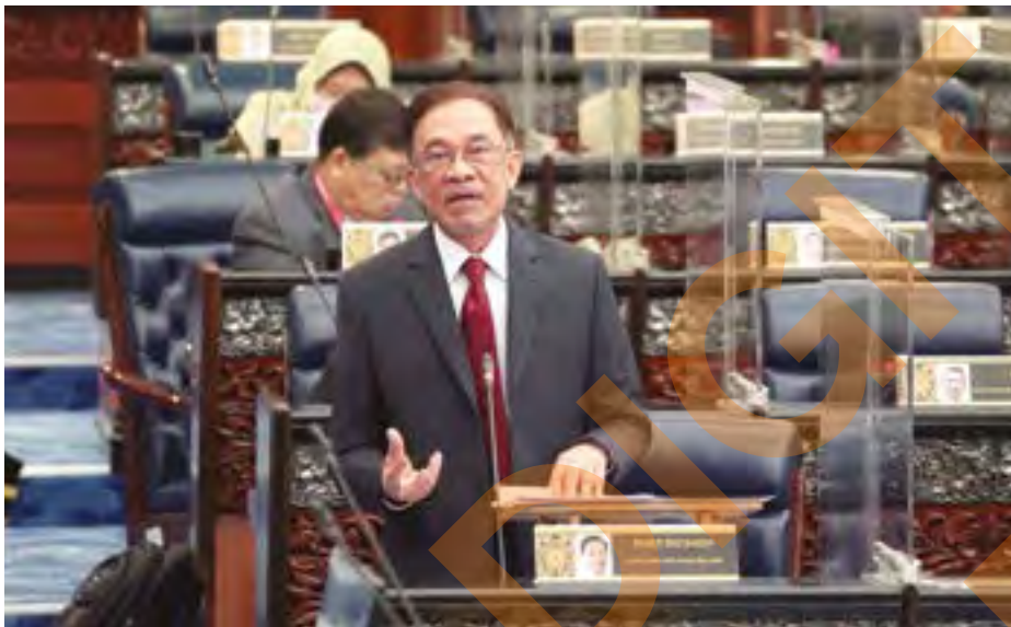
Anwar membahaskan Belanjawan 2021 di Dewan Rakyat pada 9 November

Naib Presiden Amanah Datuk Seri Salahuddin Ayub pula menyifatkan jumlah peruntukan sebesar itu hanya menguntungkan kelompok tertentu khususnya lantikan politik tetapi ia tidak membantu usaha memerangi wabak Covid-19.