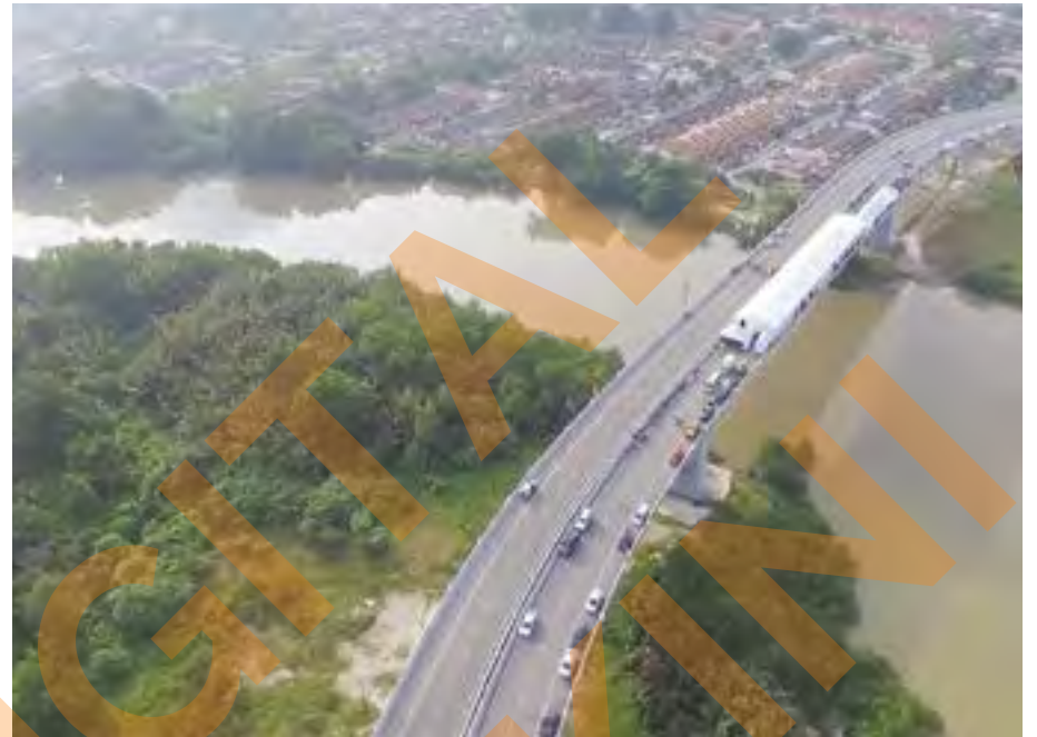
Jambatan Ketiga Klang menyuraikan kesesakan lalu lintas di sekitar Bandar Klang, Jambatan Tengku Kelana dan Jambatan Kota

Kerajaan juga akan memperkasa Orang Asli di Hulu Selangor oleh EPIC Society dan melaksana inisiatif keusahawanan orang ke-lainan upaya (OKU) yang dikendalikan Komuniti Belia Selangor (SAY).