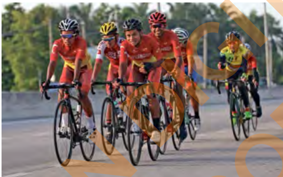
Atlet berbasikal Selangor giat menjalani latihan di Taman Seri Pekan Kapar, Klang pada 4 Julai

Bagaimanapun, Johor diberi tawaran untuk edisi 2022 kerana negeri itu sudah hampir 99 peratus bersedia daripada aspek perancangan, pengurusan, teknikal