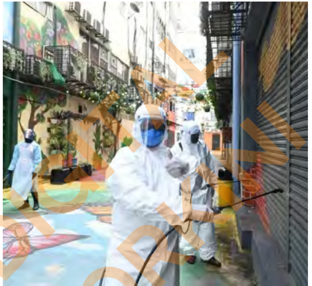
Barisan hadapan MPAJ melakukan operasi nyahkuman di laman santai Ampang dan laluan Senario Ampang pada 5 November

"Saya berpuas hati dengan kaedah kawalan pematuan SOP yang dijalankan seperti penjarakan sosial dalam premis, penyediaan cecair nyahkuman dan pemeriksaan suhu badan," katanya.