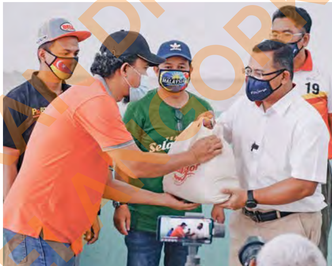
Dato' Menteri Besar Dato' Seri Amirudin Shari menyerahkan bantuan makanan sumbangan Team Selangor kepada 282 mangsa banjir di Kampung Batu 16, Hulu Langat pada 7 November 2020. BERITA PENUH MUKA 6