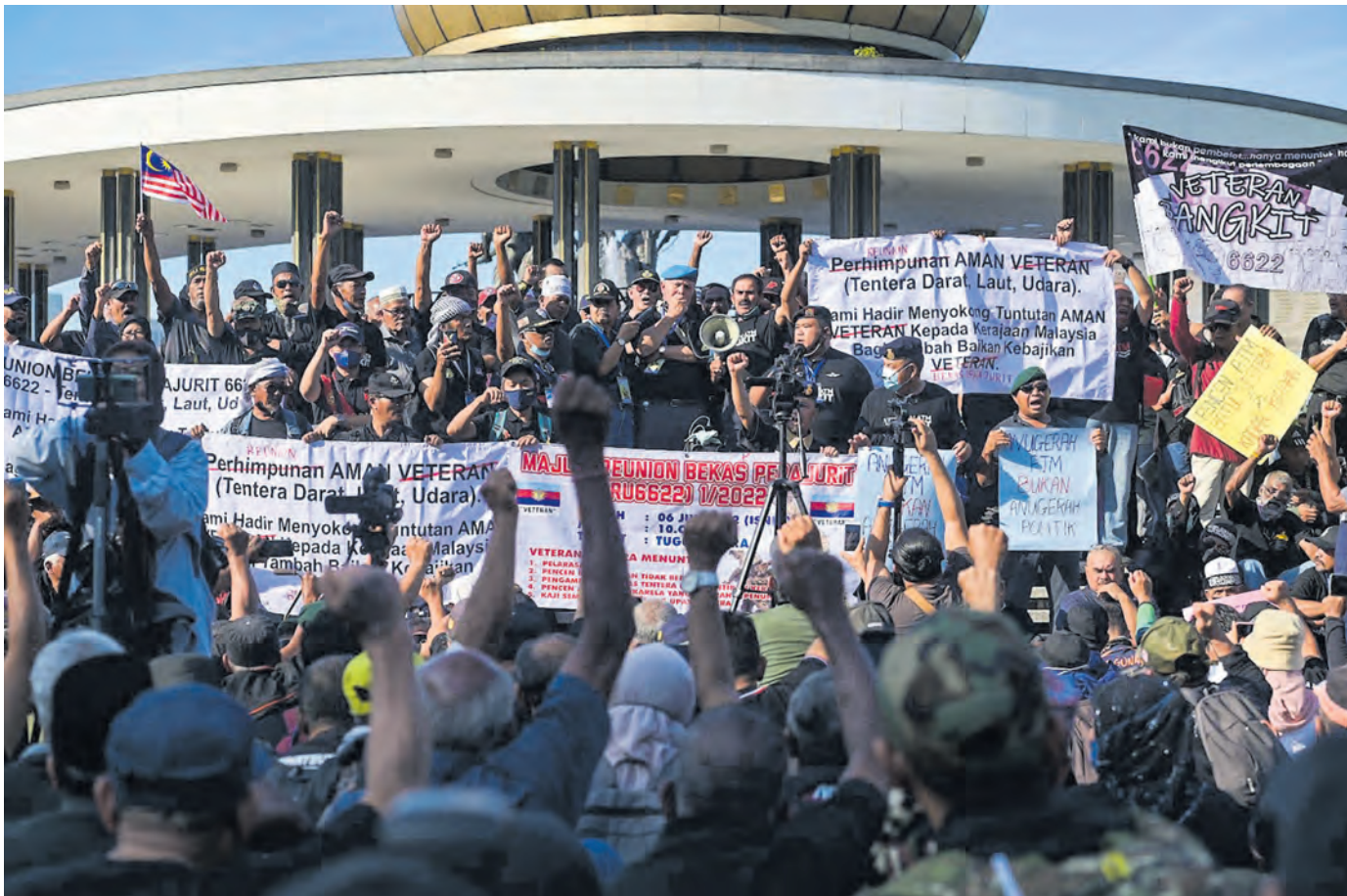
Kumpulan pesara tentera berhimpun membangkitkan isu kebajikan termasuk pencen di Tugu Negara, Kuala Lumpur pada 6 Jun.