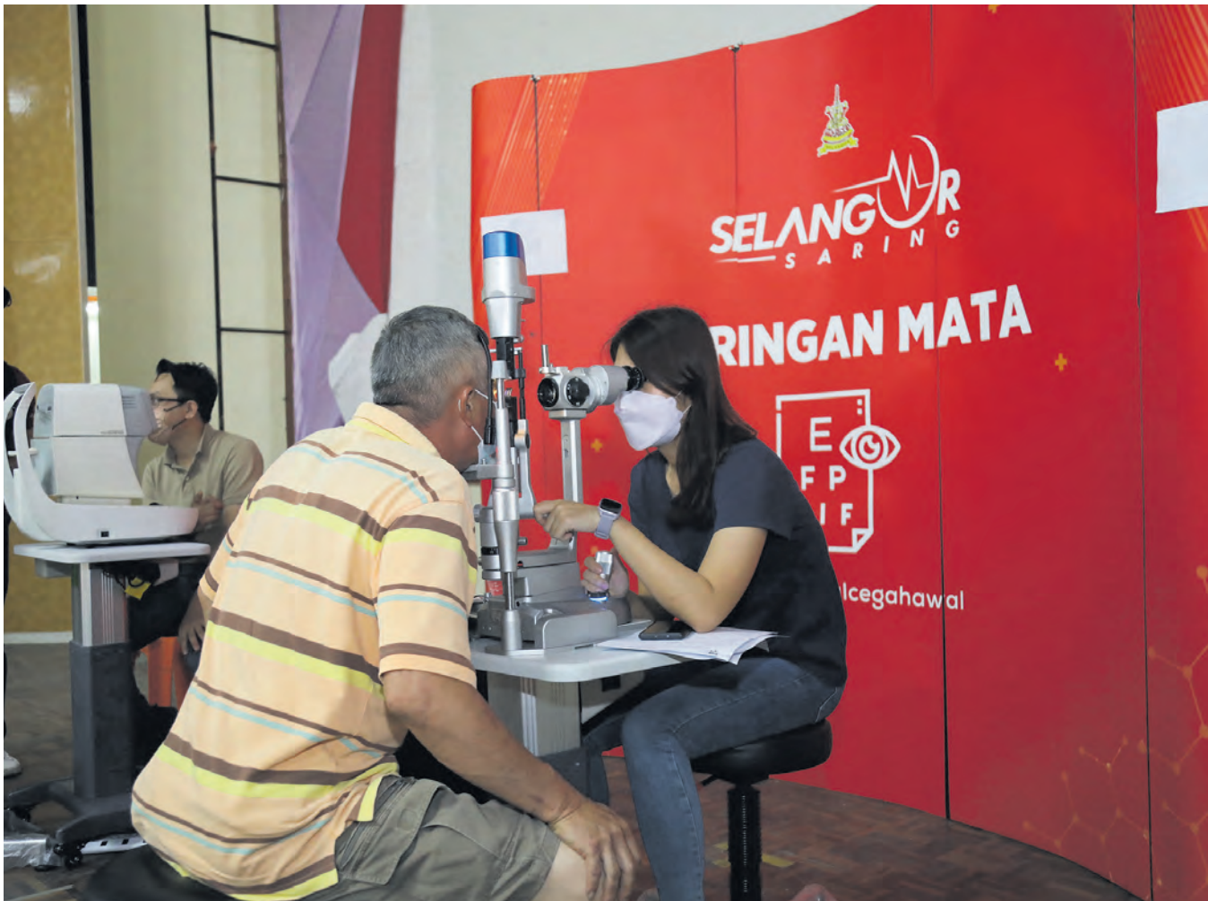
Petugas kesihatan melakukan pemeriksaan mata ke atas peserta program Selangor Saring di Sekolah Rendah Jenis Kebangsaan Cina (SRJKC) Yoke Kuan, Sekinchan, Sabak Bernam pada 5 Jun.