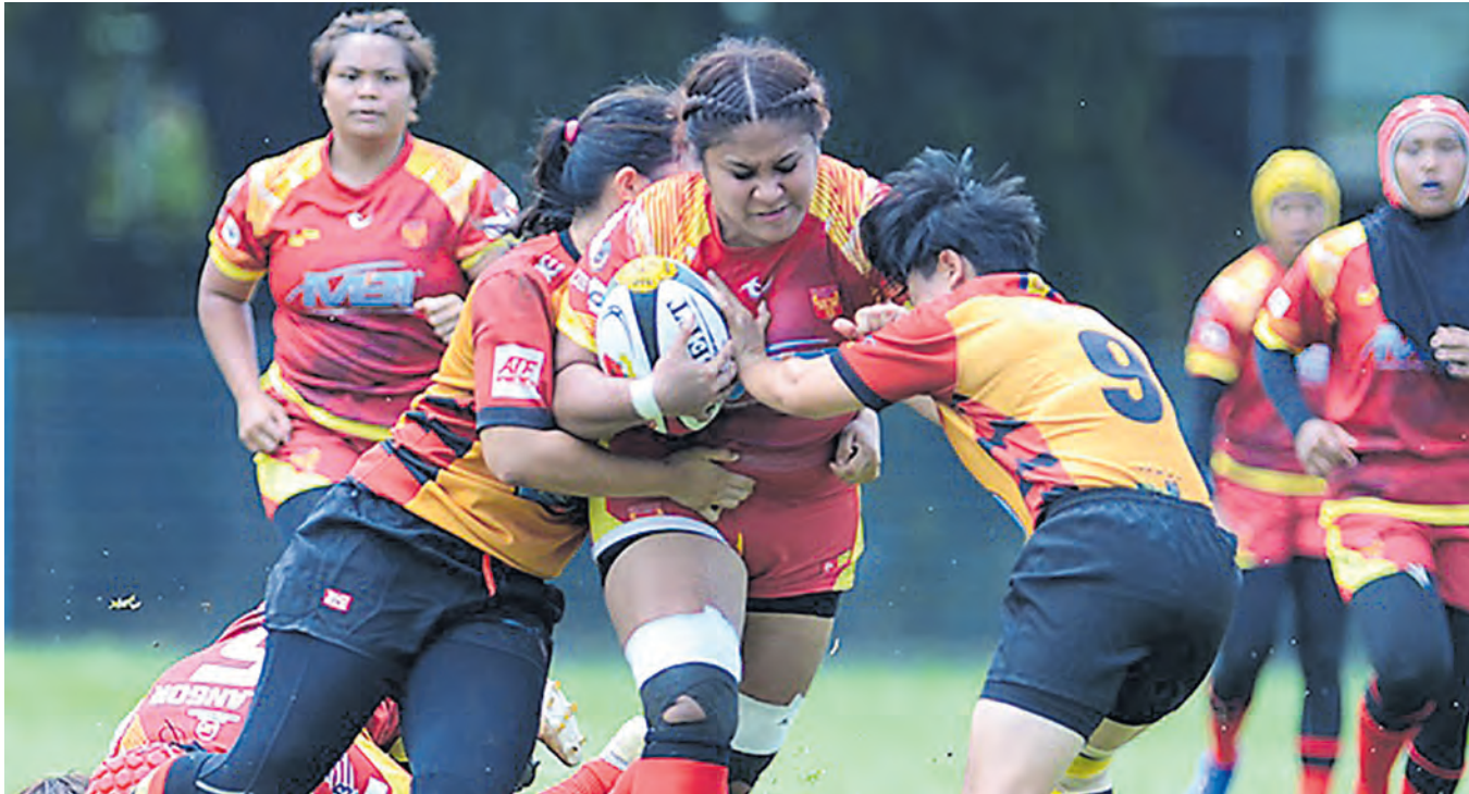
REMPUH... Pemain ragbi wanita Selangor (tengah) cuba melepasi asakan pemain Putrajaya ketika melakar kemenangan 36-7 dalam aksi Kejohanan Wanita 2022 di Padang Utara, Petaling Jaya pada 4 Jun.

Sasar kutip tujuh mata peringkat kumpulan