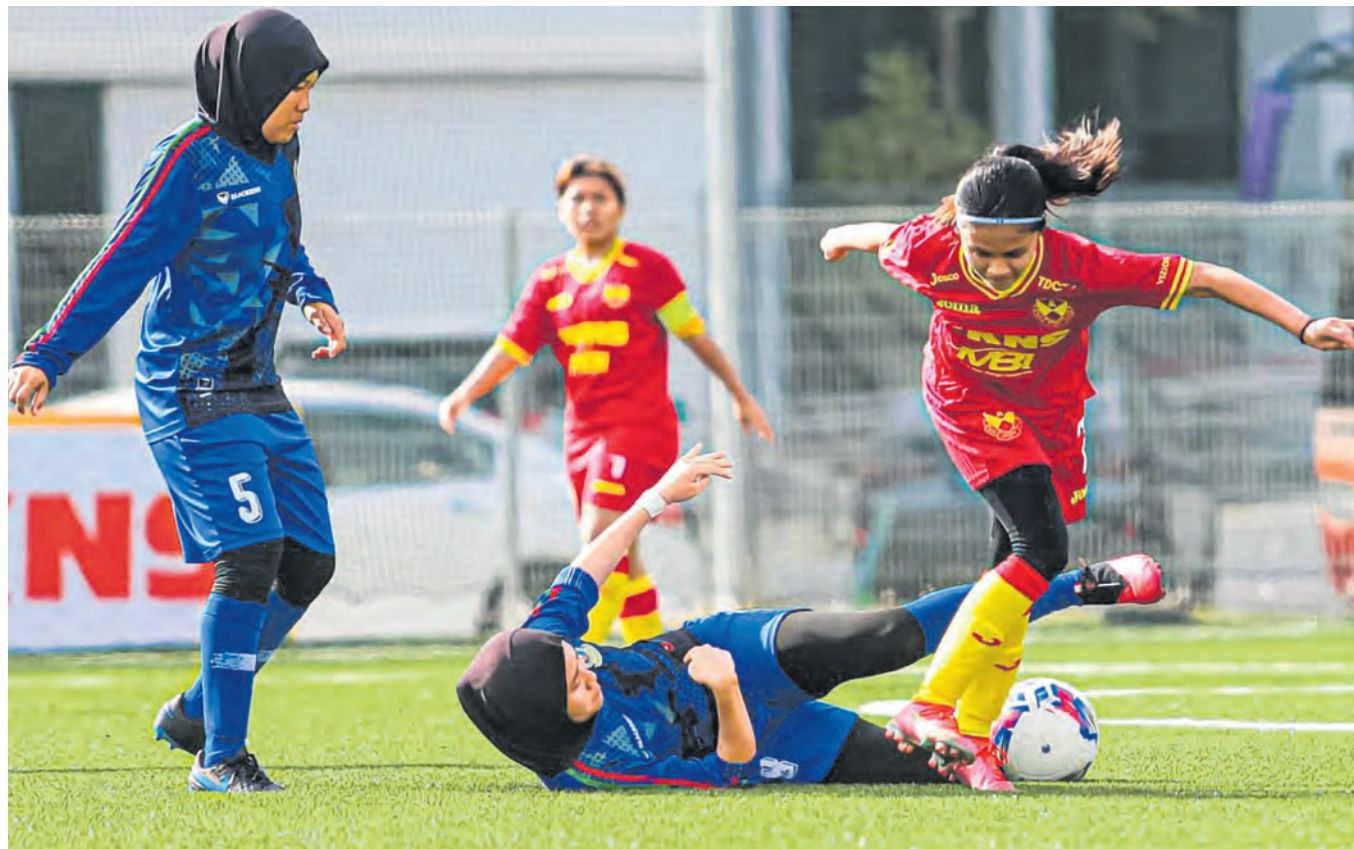
Pemain Selangor FC (kanan) melepasi kawalan pemain ATM ketika aksi pembukaan Liga Wanita Nasional di JSA Arena Setia Alam, Shah Alam pada 4 Jun.

"Rumusan keputusan melalui sistem pesanan ringkas dengan menaip SPMNoKPAngka-Giliran dan hantar ke 15888 yang diaktifkan mulai 16 hingga 22 Jun dari 10 pagi hingga 6 petang," kata kenyataan itu pada 7 Jun.