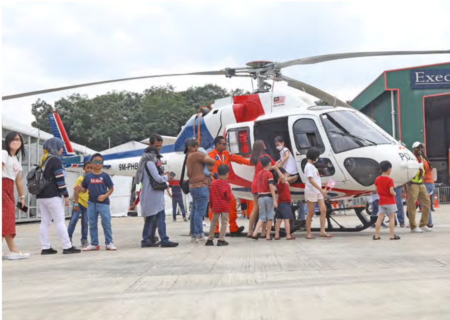
Pengunjung menaiki helikopter Agusta Westland AW 139 milik Polis Diraja Malaysia. Memuatkan 15 penumpang, pesawat itu digunakan bagi memantau trafik dan operasi menyelamat