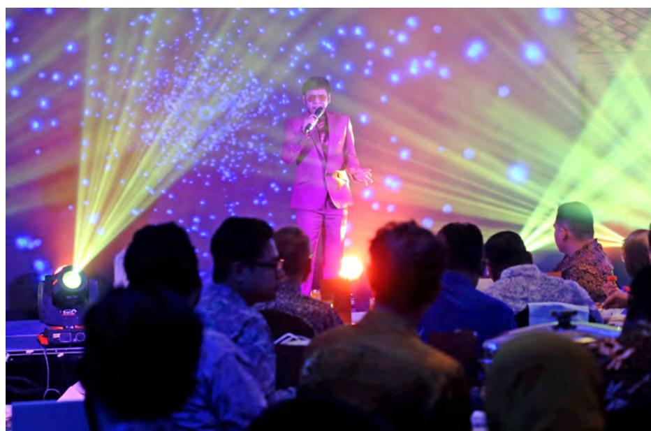
Penyanyi terkenal Datuk Jamal Abdillah mendendangkan empat lagu kegemaran ramai bermula klasik Lancang Kuning sebelum ditutup Kekasih Awal dan Akhir