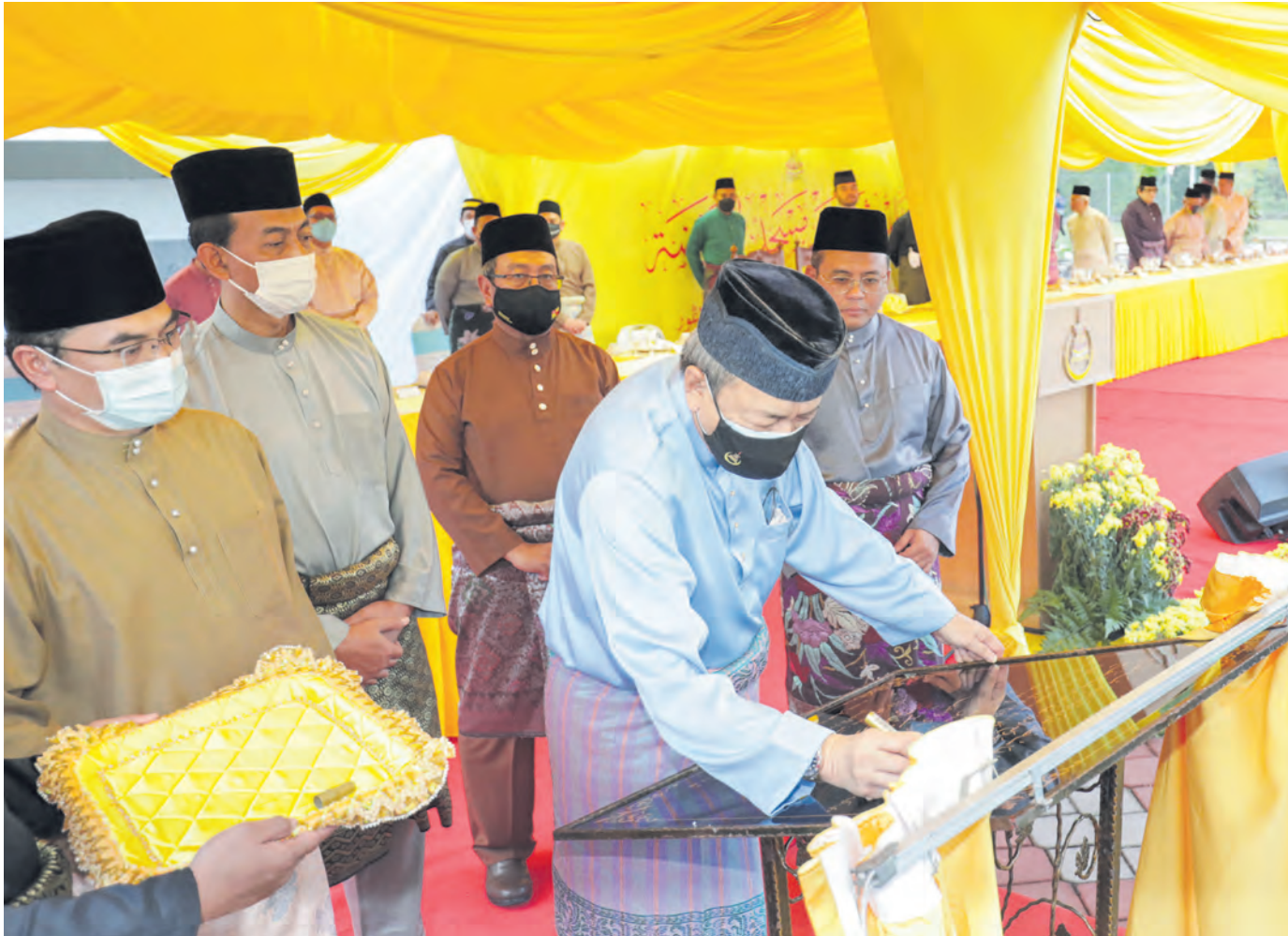
Sultan Sharafuddin berkenan menandatangani plak perasmian Masjid Ar-Raudhah, Shah Alam pada 12 September.