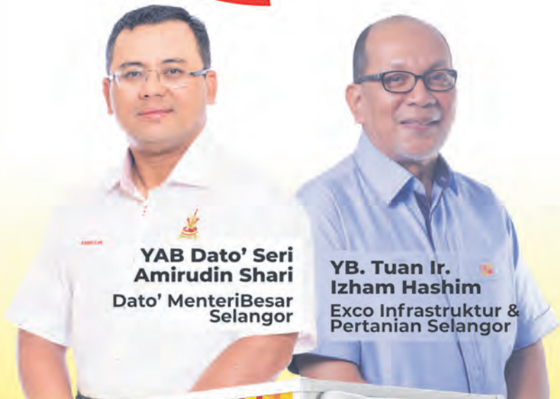
YAB Dato' Seri Amirudin Shari Dato' Menteri Besar Selangor