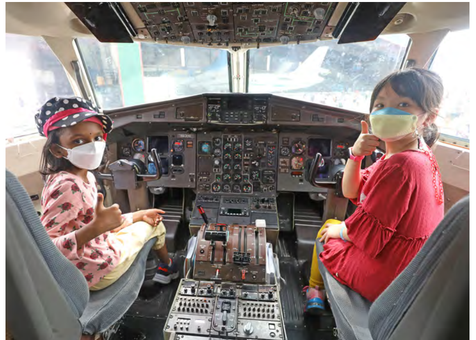
Dua kanak-kanak bergambar di kokpit pesawat ATR 42-500. Milik syarikat Berjaya Hotel & Resorts, pesawat itu membawa penumpang ke penginapan di Pulau Redang, Terengganu