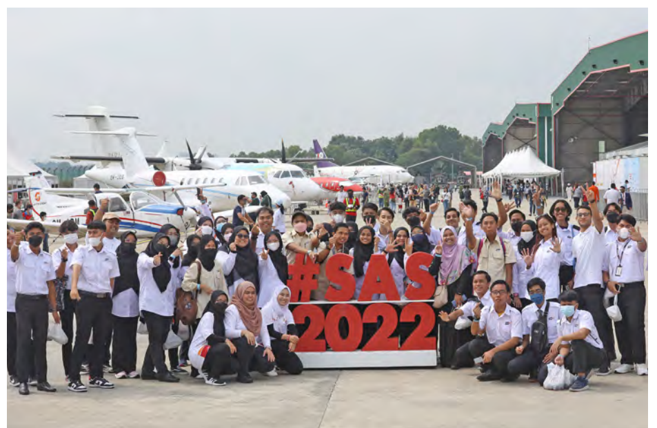
Pelajar Universiti Kuala Lumpur bergambar di tapak Pameran Udara Selangor di Subang, Shah Alam. Dianjurkan kali pertama pada 2021, pameran tahun ini menerima sambutan luar biasa