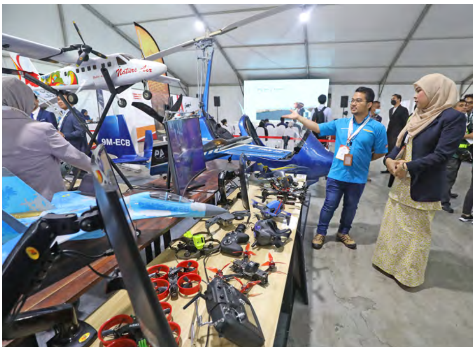
Pengunjung melihat model pesawat di ruang pameran. Model yang disediakan termasuklah TI-BBQ (atas, kiri) yang diguna Nature Air dan Extra MX (kanan) keluaran Precision Aerobatics