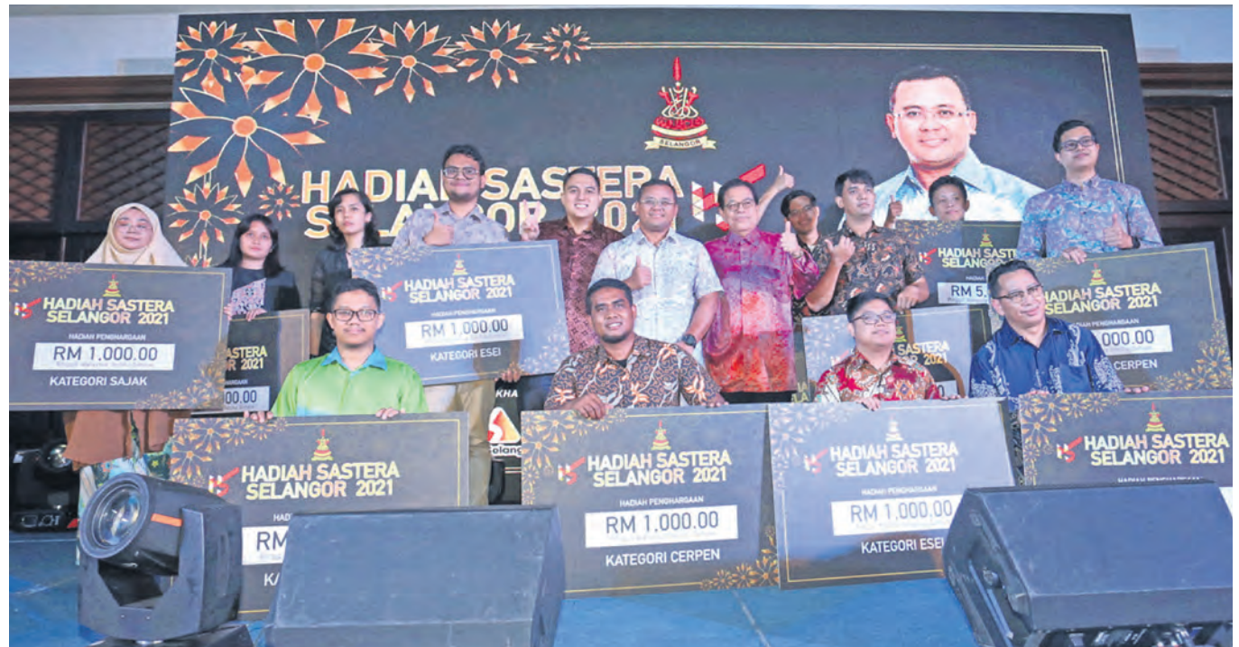
TAHNIHAH... Dato' Menteri Besar Dato' Seri Amirudin Shari (berdiri, tengah) bersama 12 pemenang anugerah Hadiah Sastera Selangor 2021 di The Saujana Hotel, Shah Alam pada 10 September. ▶ BERITA MUKA 4 & 5

"PKPS menggerakkan warga kerja dan aset untuk memastikan program pada setiap hari kecuali Isnin, bermula 9 pagi hingga 1 petang berjalan seperti yang diumumkan," katanya.