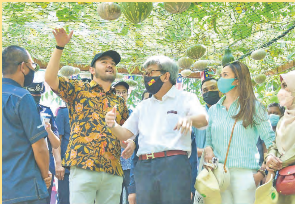
Sultan Sharafuddin diiringi DYMM Tengku Permaisuri Selangor Tengku Permaisuri Norashikin dan Tengku Amir Shah di Pameran Pertanian Hortikultur dan Agropelancongan Malaysia (MAHA) di MAEPS, Serdang pada 9 Ogos