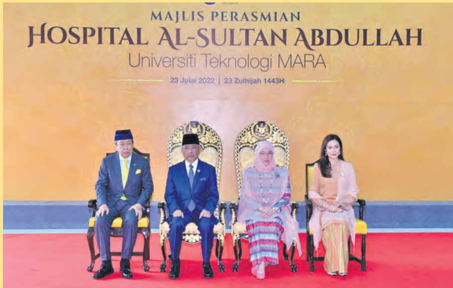
Sultan Sharafuddin mengiringi Yang di-Pertuan Agong Al-Sultan Abdullah Ri'ayatuddin Al-Mustafa Billah Shah ketika majlis perasmian Hospital Al-Sultan Abdullah di Puncak Alam, Kuala Selangor pada 23 Julai