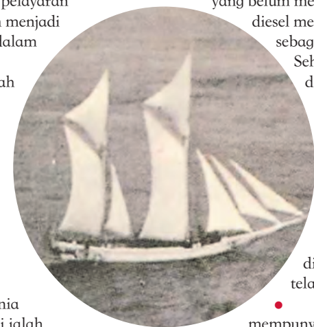
Foto ihsan artikel Perahu-perahu Tradisional Nusantara oleh Horst H Liebner (2005)