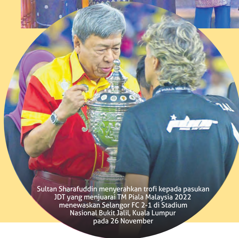
Sultan Sharafuddin menyerahkan trofi kepada pasukan JDT yang menjuarai TM Piala Malaysia 2022 menewaskan Selangor FC 2-1 di Stadium Nasional Bukit Jalil, Kuala Lumpur pada 26 November