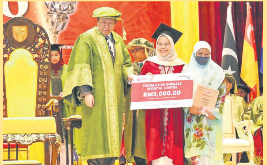
Sultan Selangor selaku Tuanku Canselor Universiti Putra Malaysia (UPM) menyampaikan Anugerah Graduan Terbaik ketika Majlis Konvokesyen ke-46 di UPM Kampus Bintulu, Sarawak pada 2 November