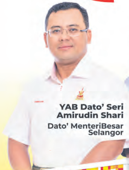
YAB Dato' Seri Amirudin Shari Dato' Menteri Besar Selangor