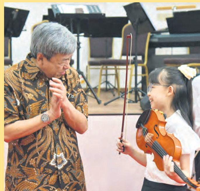
Sultan Sharafuddin tersenyum ketika berbual dengan ahli kumpulan Selangor Symphony Youth Orchestra selepas merasmikan Dewan Serbaguna Tengku Ampuan Rahimah di Subang Jaya pada 4 Ogos