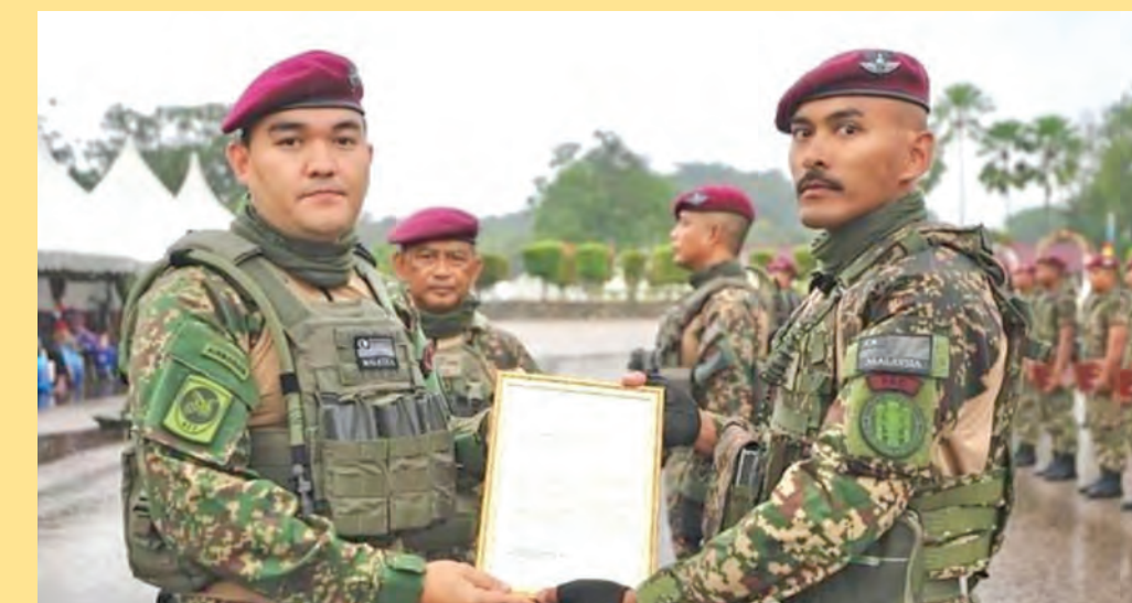
DYTM Raja Muda Selangor berkenan berangkat menyertai Perbarisan Hari Ulang Tahun 10 Briged (Para) Ke-28 di Padang Kawad 17 RAMD (Para), Kem Terendak, Melaka