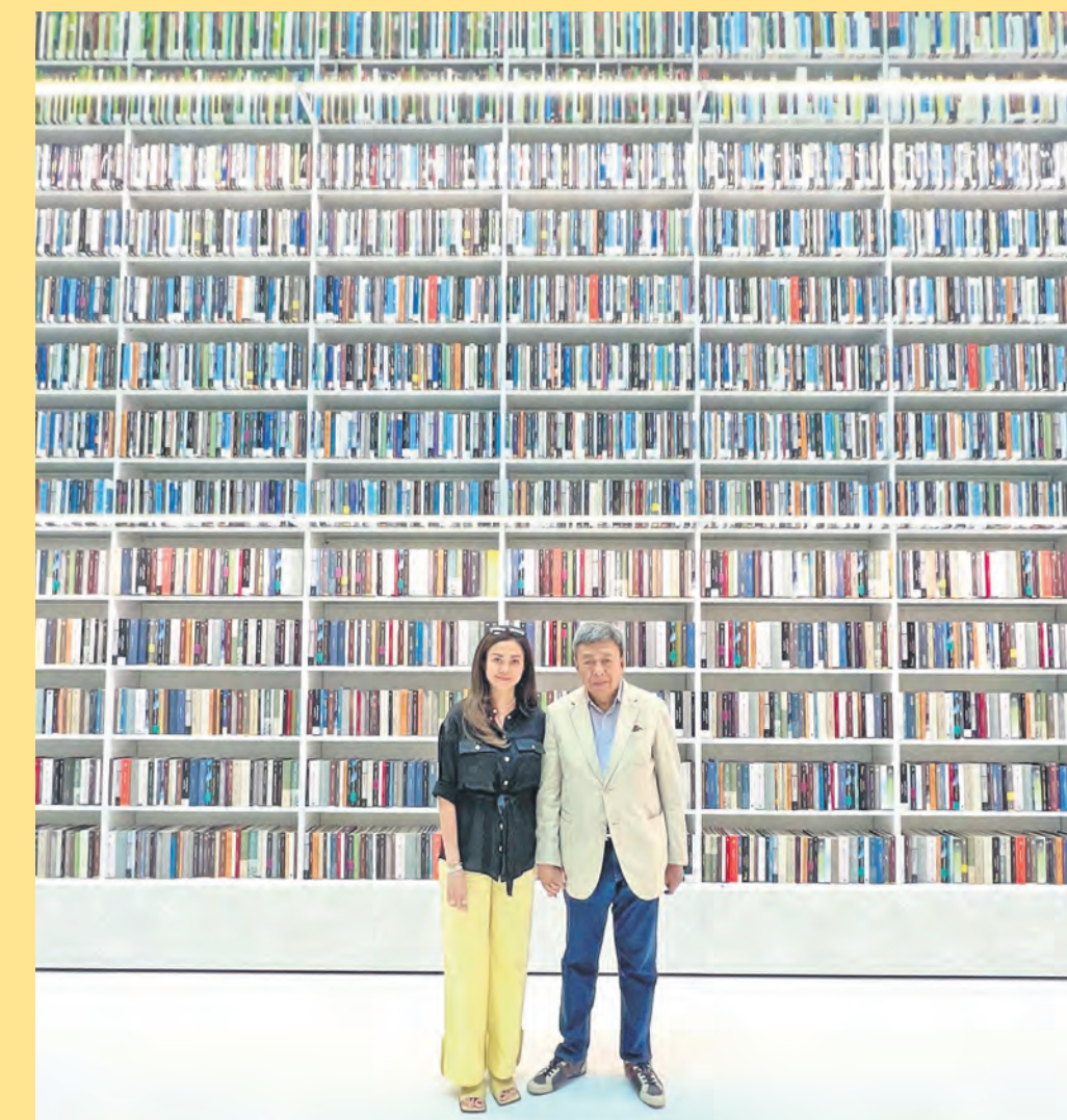
Sultan Sharafuddin dan Tengku Permaisuri Norashikin bergambar di hadapan rak buku Perpustakaan Mohammed Bin Rashid di Dubai, Emiriah Arab Bersatu yang menempatkan 1.1 juta koleksi buku pada 4 September