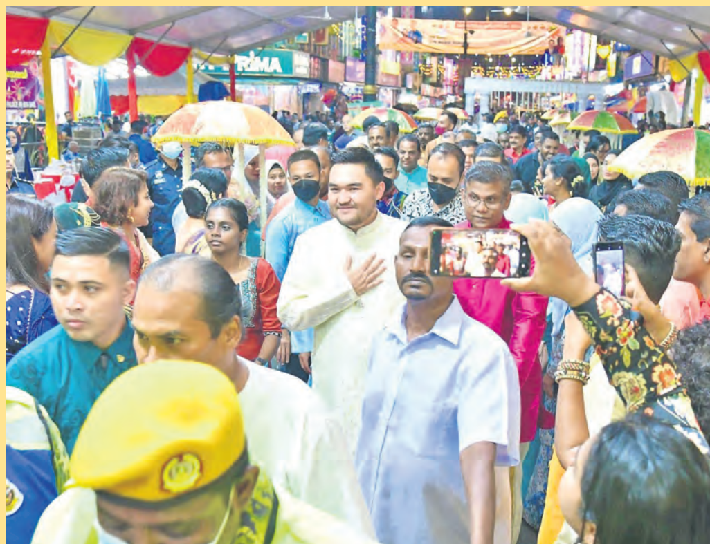
DYTM Raja Muda Selangor berkenan merasmikan sambutan Deepavali peringkat Selangor di Jalan Tengku Kelana, Klang pada 24 Oktober