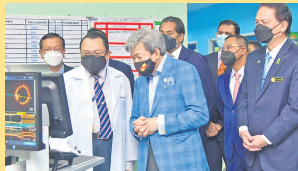
Ketua Pengarah Kesihatan Tan Sri Dr Noor Hisham Abdullah (kanan) mengiringi Sultan Selangor ketika melawat Makmal Invasif Kardiologi (ICL) di Hospital Serdang pada 28 Mac