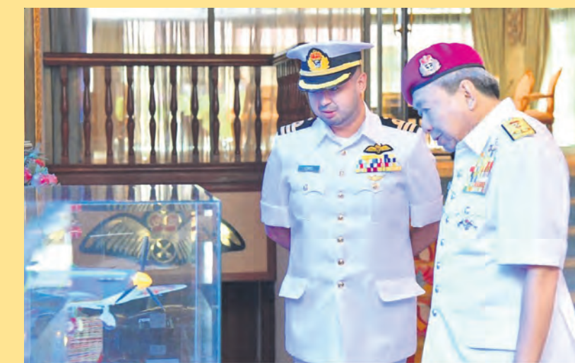
Tunku Temenggong Johor Komander Tunku Idris Iskandar Al-Haj, juruterbang TLDM menghadap Sultan Sharafuddin selaku Kapten Yang Dipertua TLDM di Istana Bukit Kayangan, Shah Alam pada 11 April