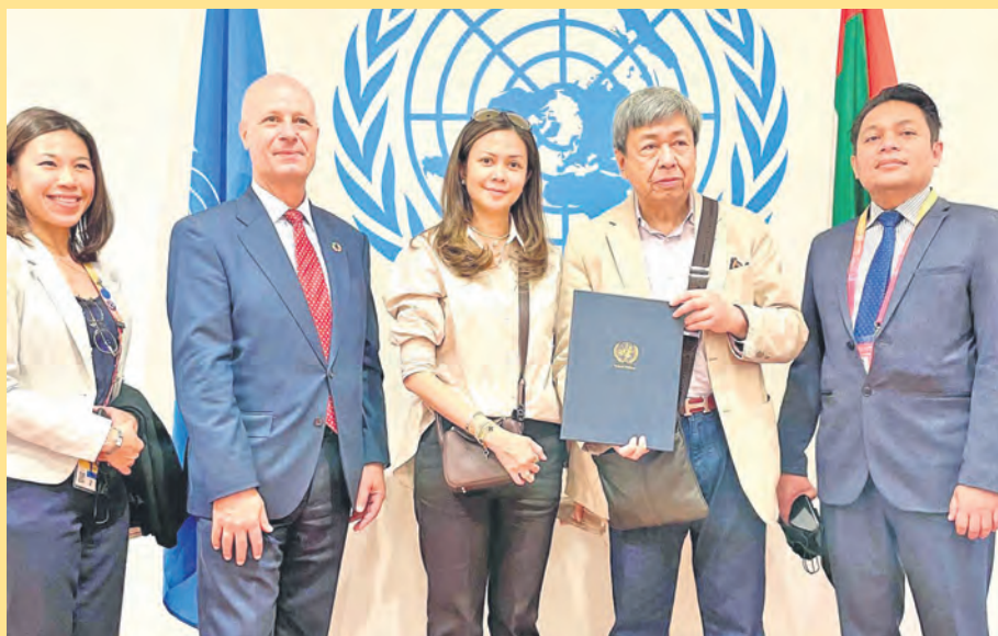
Sultan Selangor dan Tengku Permaisuri bergambar selepas melawat Ekspo 2020 Dubai pada 23 Januari. Ekspo berlangsung di UAE itu bermula 1 Oktober tahun lalu hingga 31 Mac tahun ini