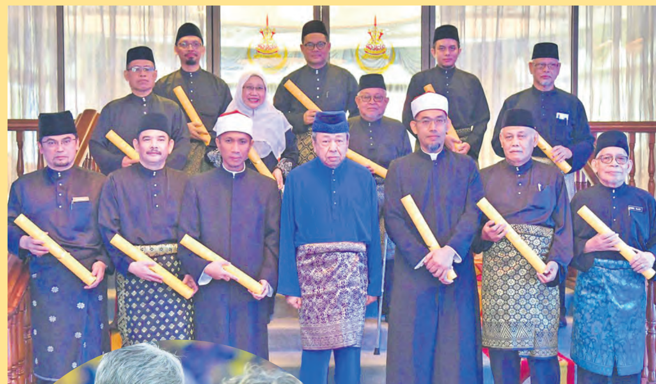
Sultan Sharafuddin bersama penerima watak pelantikan hakim dan Ahli Jawatankuasa Fatwa Negeri Selangor di Istana Bukit Kayangan, Shah Alam pada 26 September