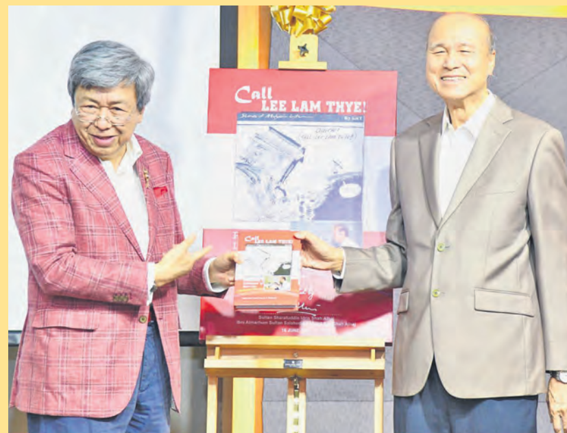
Baginda Sultan berkenan merasmikan buku biografi aktivis sosial Tan Sri Lee Lam Thye bertajuk 'Call Lee Lam Thye - Recalling a Lifetime of Service' di Hotel Concorde Shah Alam pada 16 Jun