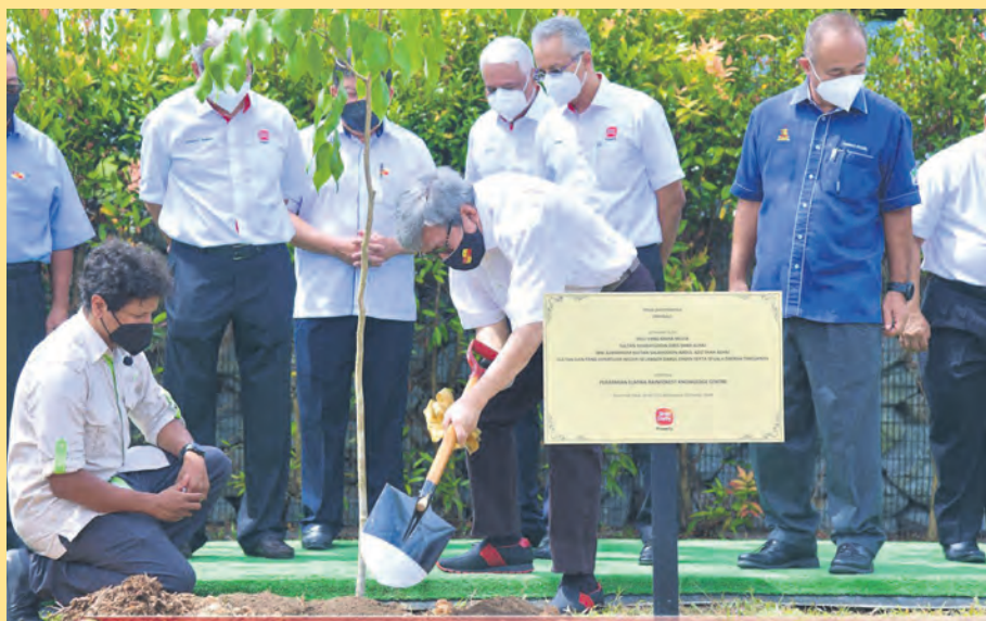
DYMM Sultan Sharafuddin Idris Shah Alhaj menanam anak pokok merbau sebagai simbolik pelancaran Pusat Ilmuan Hutan Hujan Tropika Elmina di Bandar Elmina, Shah Alam pada 31 Mei