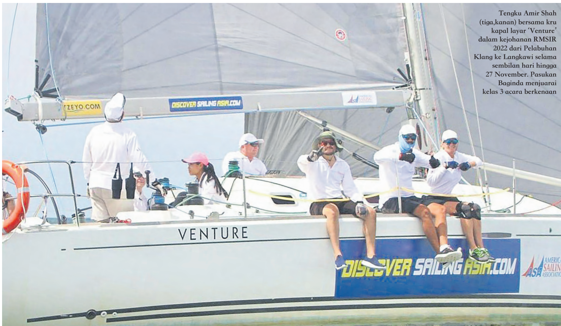
Tengku Amir Shah (tiga,kanan) bersama kru kapal layar 'Venture' dalam kejohanan RMSIR 2022 dari Pelabuhan Klang ke Langkawi selama sembilan hari hingga 27 November. Pasukan Baginda menjuarai kelas 3 acara berkenaan