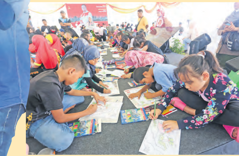
Kanak-kanak berpeluang mempamerkan bakat masing-masing dalam pertandingan mewarna, antara aktiviti yang boleh disertai pengunjung sempena JKSP Klang