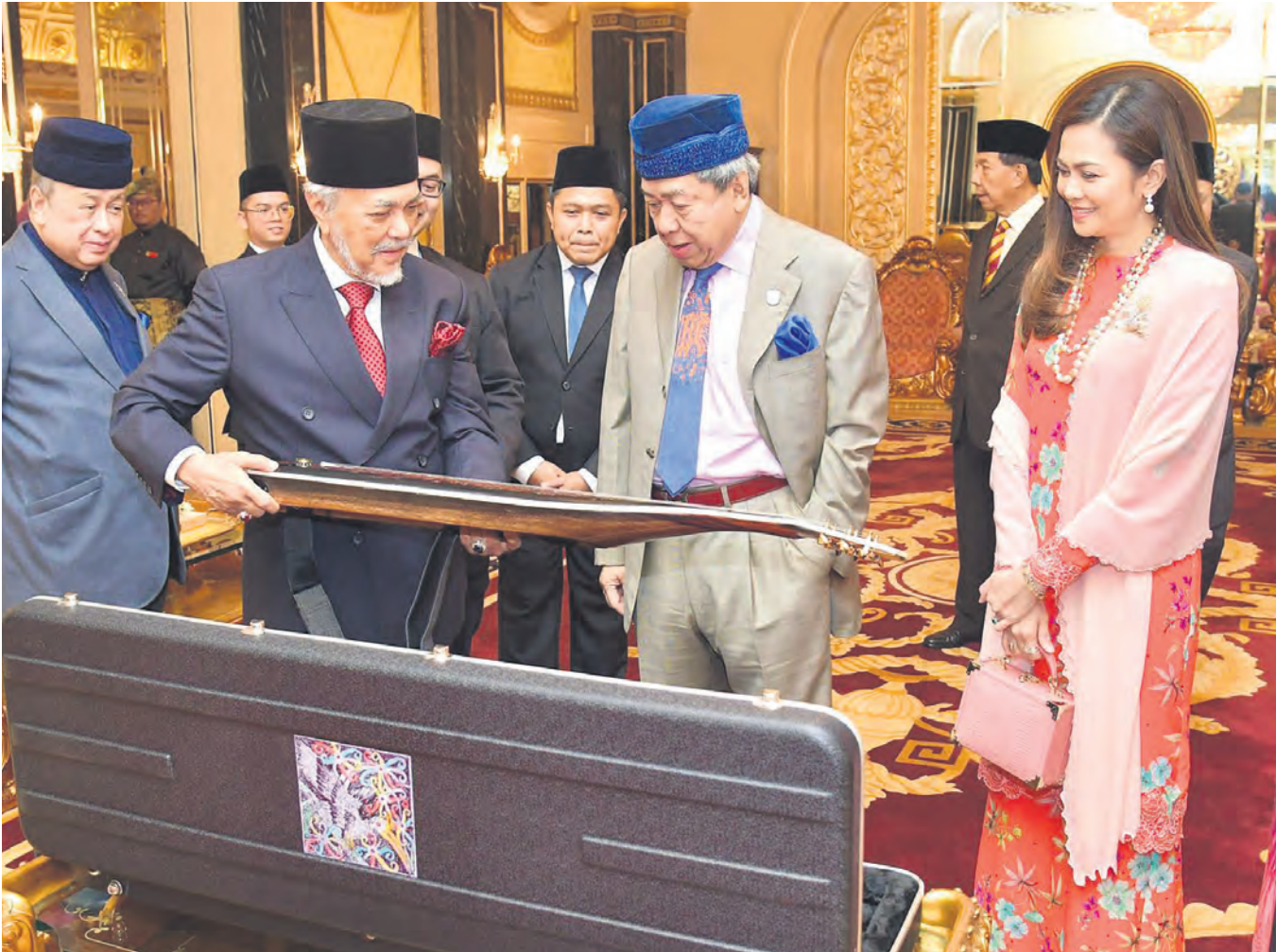
CERIA... Duli Yang Maha Mulia Sultan Selangor Sultan Sharafuddin Idris Shah Alhaj (tiga, kanan) menunjukkan alat muzik sape di Istana Alam Shah, Klang kepada Speaker Dewan Undangan Negeri (DUN) Sarawak Tan Sri Mohamad Asfia Awang Nassar pada 18 Februari.