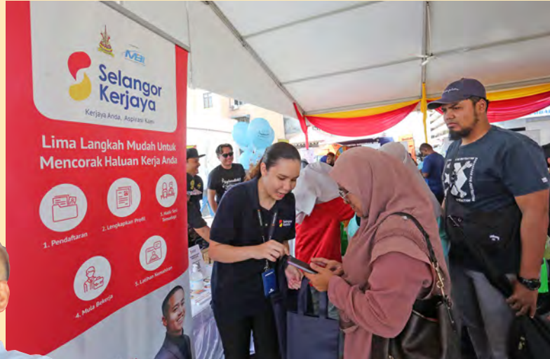
Petugas menjelaskan program Selangor Kerjaya kepada pengunjung JKSP di Klang. Program ini menyediakan 10,000 peluang kerja menerusi sistem profil digital