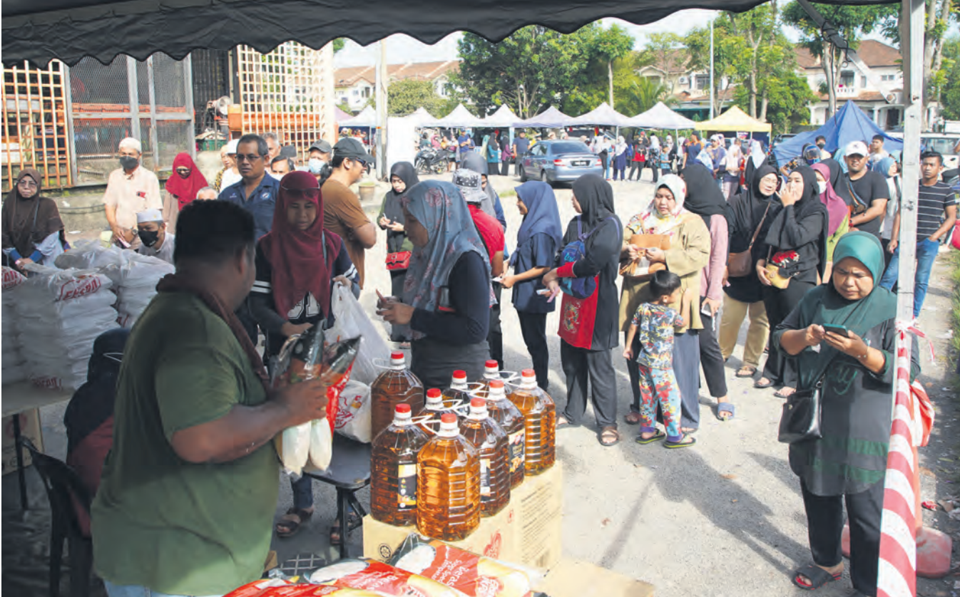
SABAR... Penduduk sekitar Puncak Alam tidak melepaskan peluang mendapatkan barangan keperluan asas di Jelajah Ehsan Rakyat peringkat Dewan Undangan Negeri (DUN) Jeram di tapak pasar malam Alam Jaya, Kuala Selangor pada 25 Februari.