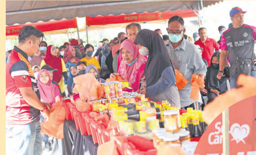
Orang ramai membeli barangan asas lebih murah di reruai Jelajah Ehsan Rakyat di Hulu Selangor. Program itu dianjurkan Perbadanan Kemajuan Pertanian Selangor