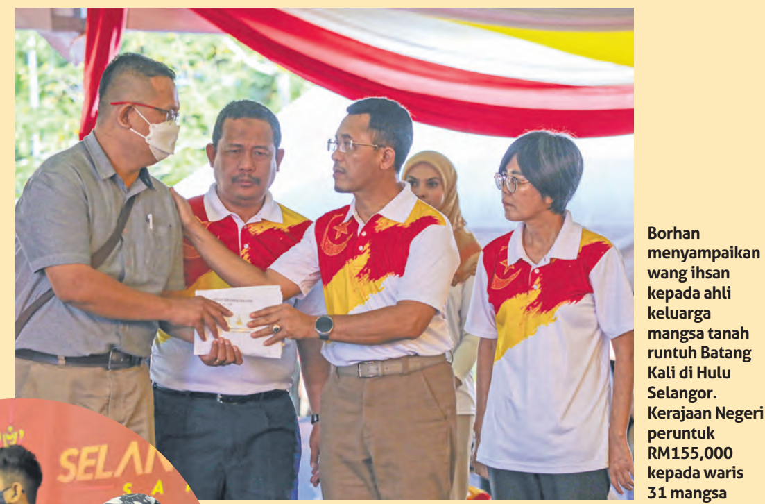
Borhan menyampaikan wang ihsan kepada ahli keluarga mangsa tanah runtuh Batang Kali di Hulu Selangor. Kerajaan Negeri peruntuk RM155,000 kepada waris 31 mangsa