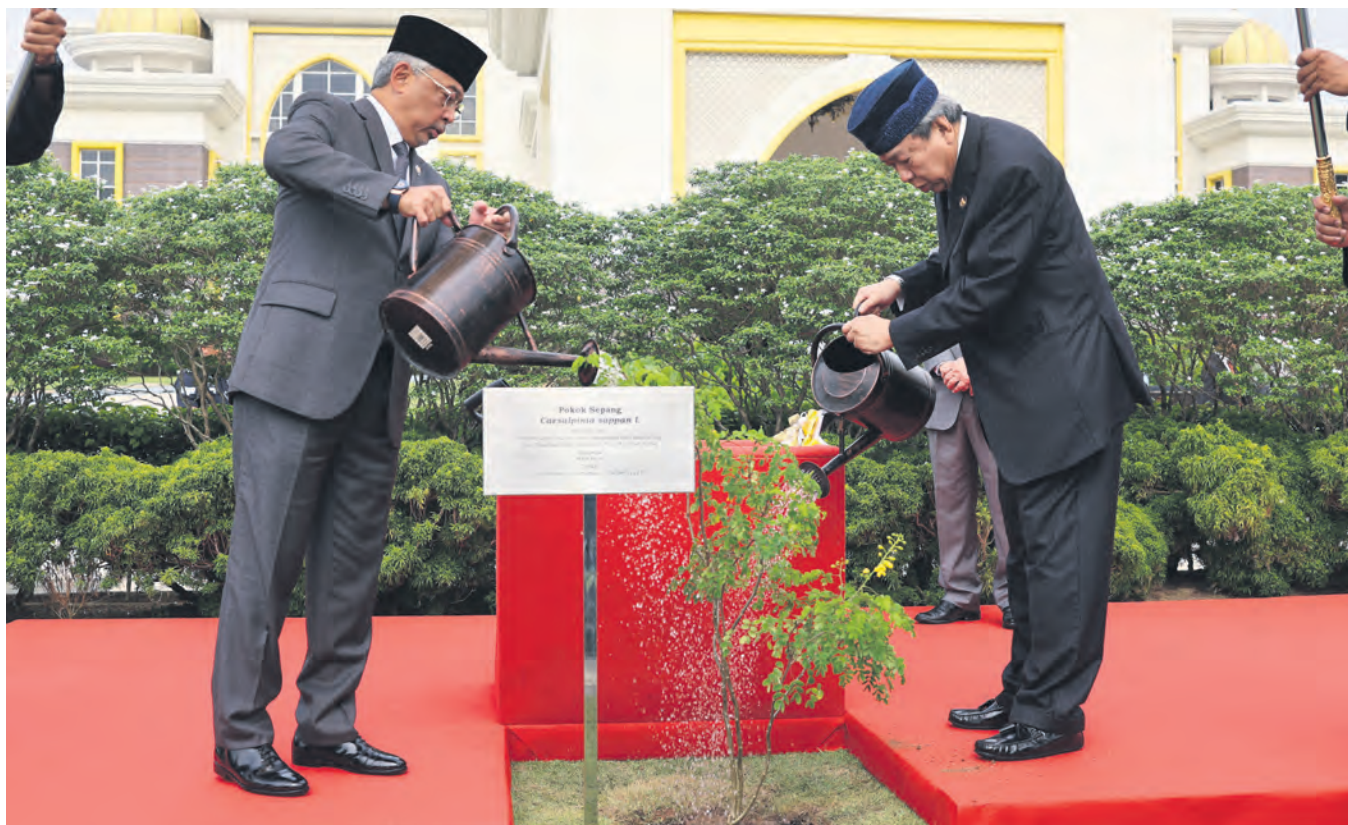
SUBUR... Duli Yang Maha Mulia (DYMM) Yang di-Pertuan Agong Al-Sultan Abdullah Ri'ayatuddin Al-Mustafa Billah Shah (kiri) dan DYMM Sultan Selangor Sultan Sharafuddin Idris Shah Alhaj berkenan menyempurnakan penanaman Pokok Sepang sempena Mesyuarat Majlis Raja-Raja ke-261 di Istana Negara, Kuala Lumpur pada 22 Februari.