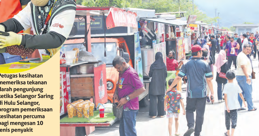
Kendera saji yang menjual pelbagai makanan dan minuman enak menjadi tarikan pengunjung di JKSP Hulu Selangor