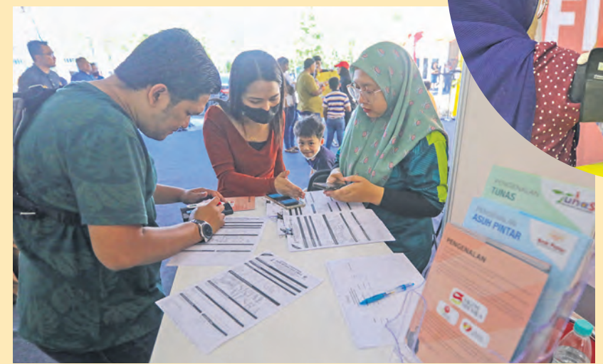
Pengunjung membantu mendaftar ibu bapa untuk program Skim Mesra Usia Emas di Hulu Selangor. Tahun ini kerajaan menaikkan baucar kepada RM150 dan had pendapatan isi rumah kepada RM3,000 sebulan