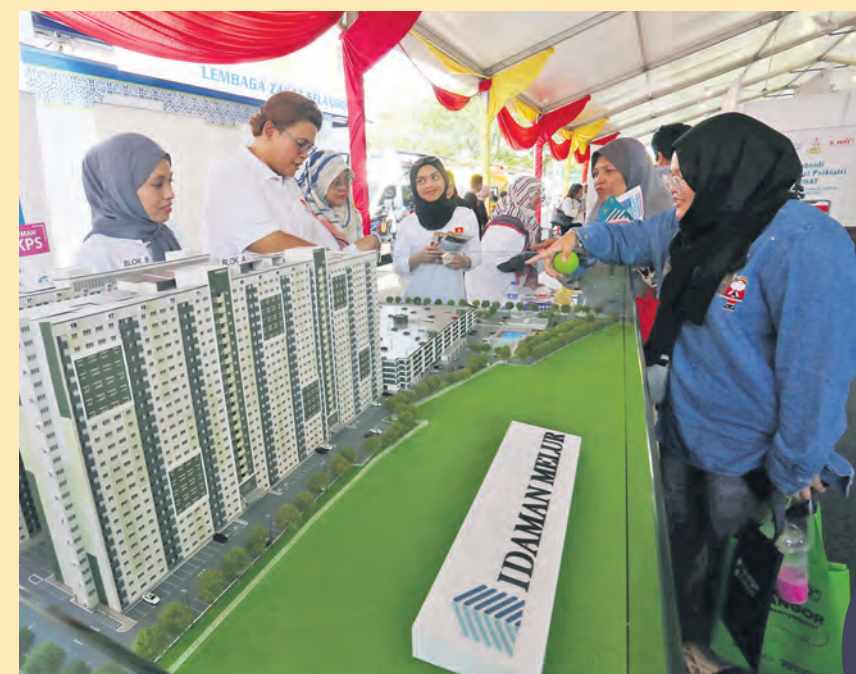
Orang ramai melihat model Rumah Selangorku kategori Idaman di JKSP Klang. Projek itu memberi peluang rakyat memiliki kediaman sendiri

Penyanyi Azlan Typewriter mendendangkan lagu popularnya Jangan Khianati Aku dalam persembahan di Klang