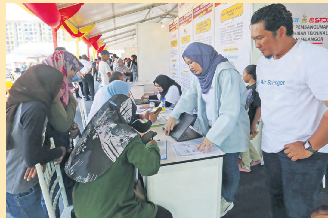
Kakitangan Pengurusan Air Selangor Sdn Bhd membantu pengunjung mengisi borang pendaftaran air percuma. Keluarga berpendapatan bulanan RM5,000 ke bawah layak menikmati skim tersebut