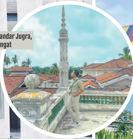
Istana Bandar Jugra, Kuala Langat