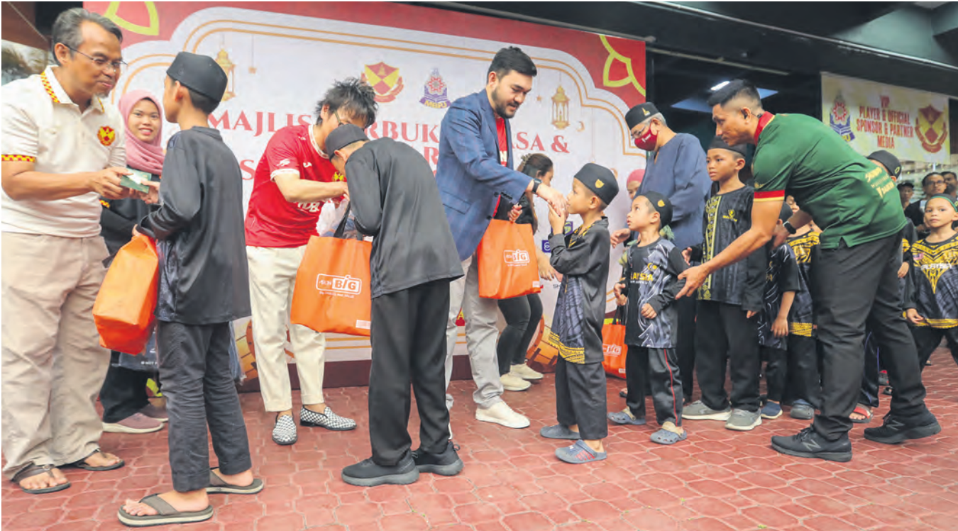
Tengku Amir Shah (tengah) menyantuni anak yatim daripada tiga pusat jagaan ketika majlis berbuka puasa sempena perlawanan Piala FA di Stadium MBPJ, Petaling Jaya pada 15 April.