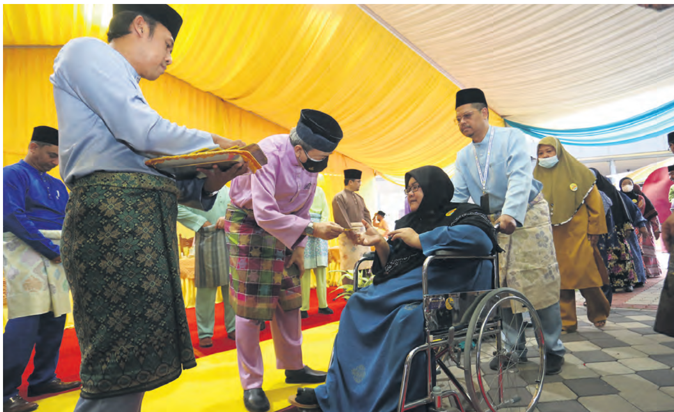
Sultan Sharafuddin berkenan menyampaikan sumbangan kepada asnaf ketika merasmikan Masjid Taman Alam Jaya sempena program berbuka puasa di Puncak Alam, Kuala Selangor pada 8 April.