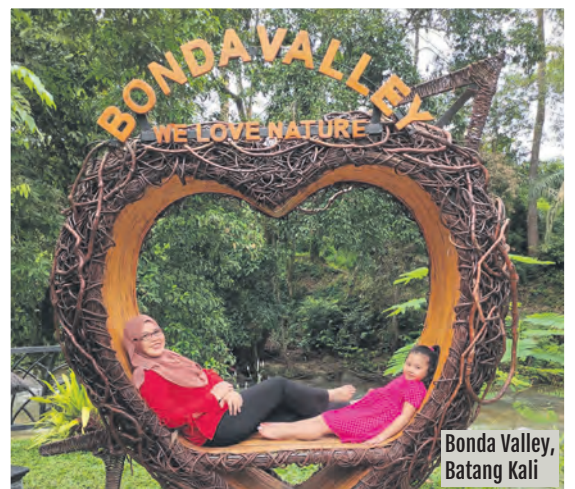
Bonda Valley, Batang Kali