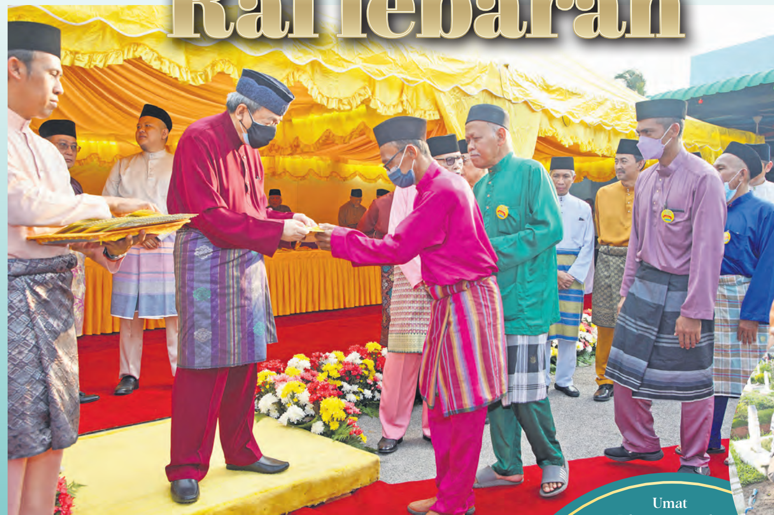
Duli Yang Maha Mutia (DYMM) Sultan Selangor Sultan Sharafuddin Idris Shah Alhaji menghulur sumbangan raya di Masjid Ma'arufiah, Sabak Bernam pada 14 April. Seramai 478 asnaf menerima bantuan