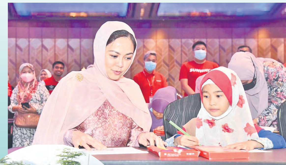
DYMM Tengku Permaisuri Selangor Tengku Permaisuri Norashikin meraikan anak yatim selepas menyerahkan sumbangan Aidilfitri di Bandar Sunway, Petaling Jaya pada 6 April