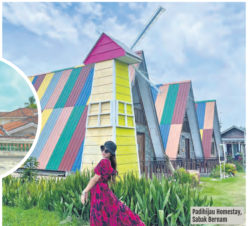
Padihijau Homestay, Sabak Bernam