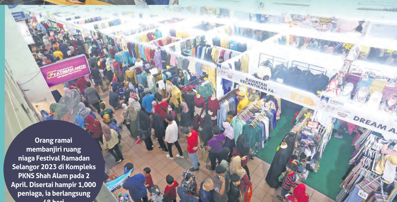
Orang ramai membujiri ruang niaga Festival Ramadan Selangor 2023 di Kompleks PKNS Shah Alam pada 2 April. Disertai hampir 1,000 peniaga, ia berlangsung 48 hari