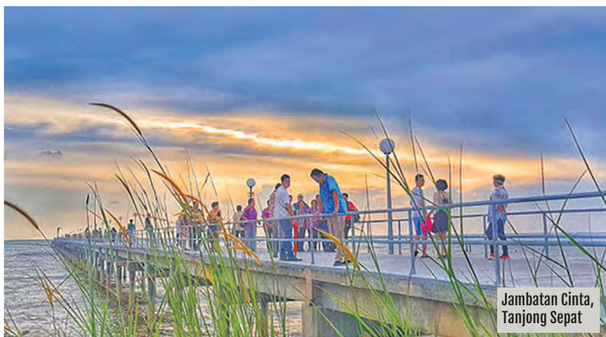
Jambatan Cinta, Tanjung Sepat