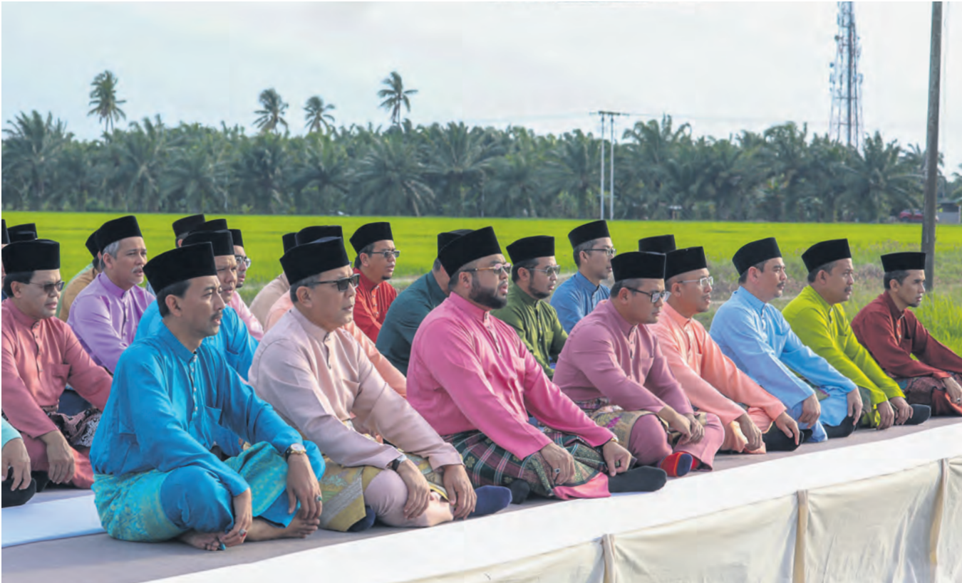
KEAGUNGAN ILAHI... Dato' Menteri Besar Dato' Seri Amirudin Shari bersama pimpinan Kerajaan Negeri ketika rakan takbir raya di Kampung Sungai Leman, Sabak Bernam pada 2 April.