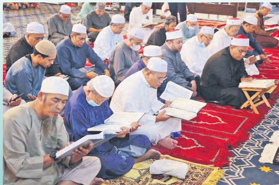
Dato' Menteri Besar Dato' Seri Amirudin Shari bersama jemaah Masjid Sultan Salahuddin Abdul Aziz Shah, Shah Alam ketika program Qiamulail Perdana pada 12 April