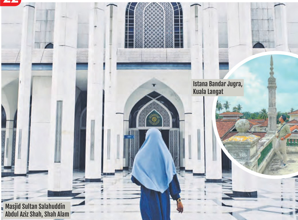
Masjid Sultan Salahuddin Abdul Aziz Shah, Shah Alam