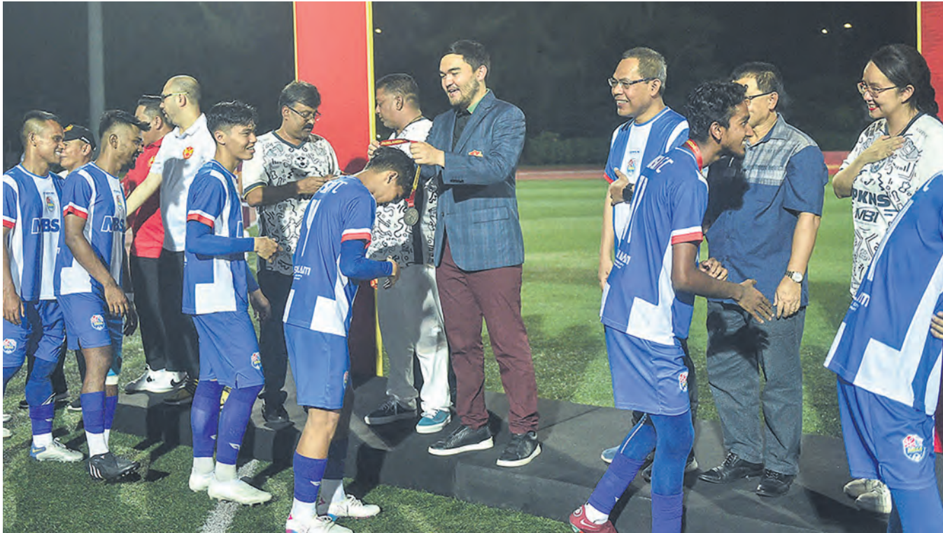
Tengku Amir Shah (tengah) menyampaikan hadiah kepada pemain MBSA FC yang menjuarai Liga Super FAS 2023 di Stadium MBSJ, Subang Jaya pada 20 Ogos.