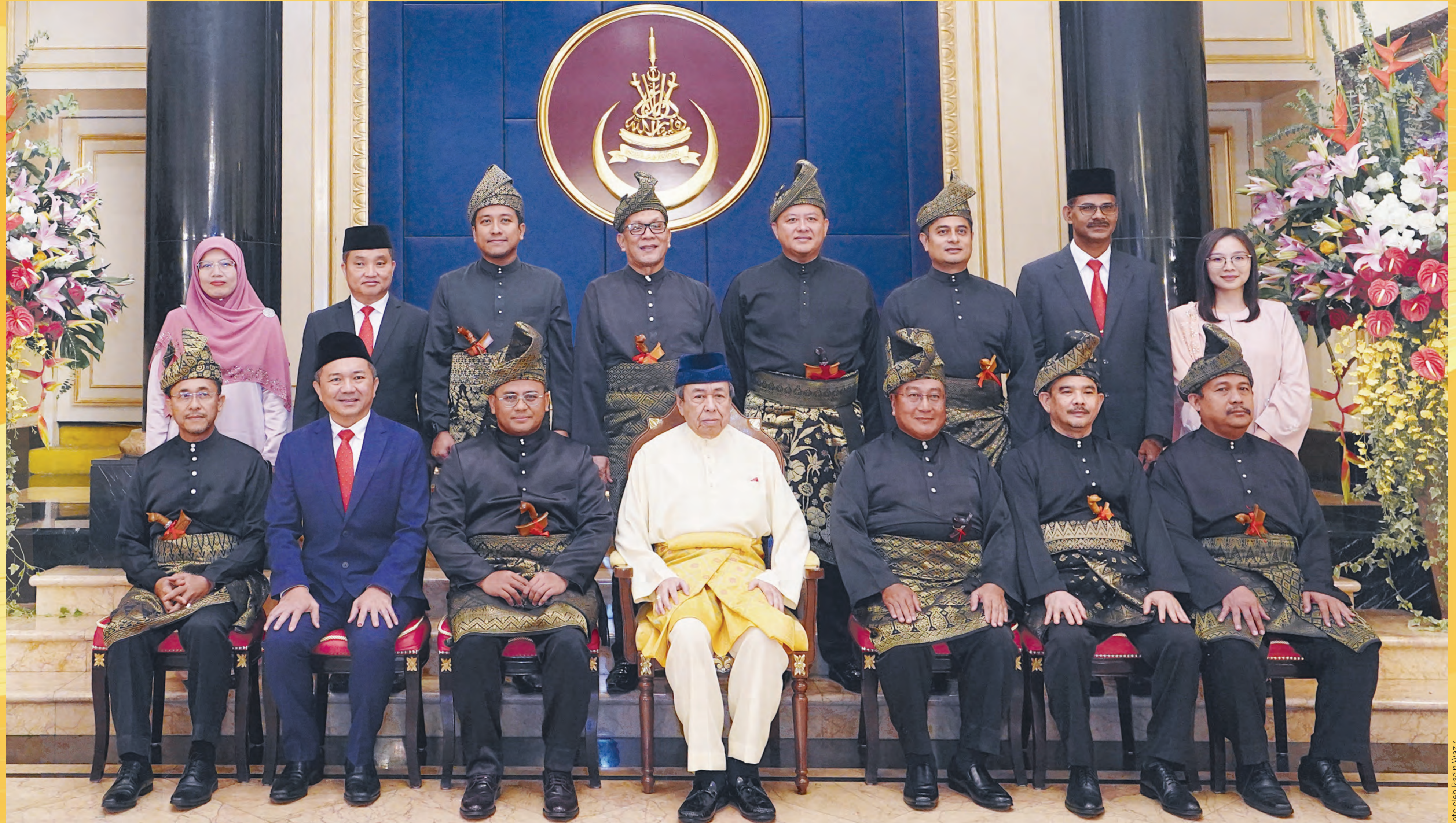
Duli Yang Maha Mulia Sultan Selangor Sultan Sharafuddin Idris Shah Alhaj bersama Dato' Menteri Besar Dato' Seri Amirudin Shari dan