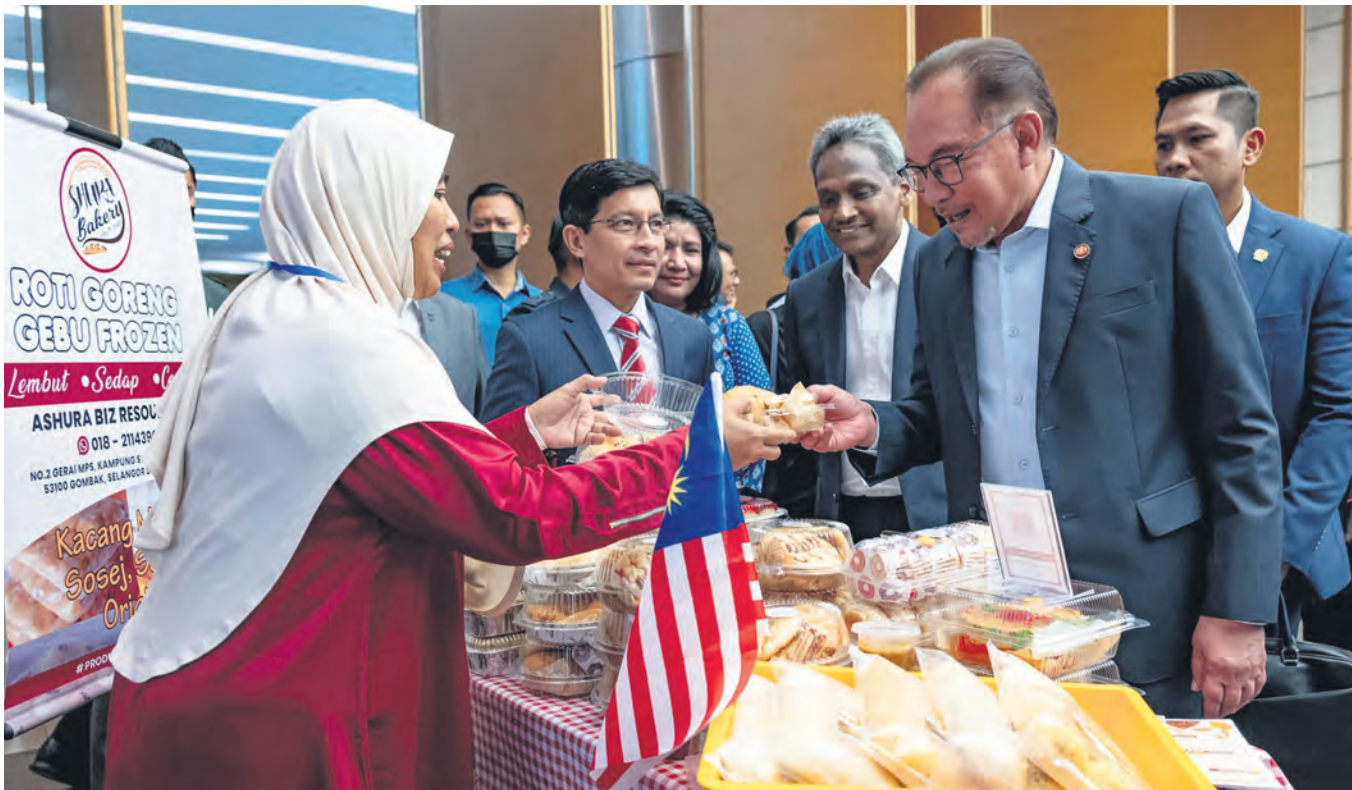
MESRA... Perdana Menteri Datuk Seri Anwar Ibrahim menyapa usahawan ketika Majlis Jalinan Kerjasama iTekad di Sasana Kijang, Kuala Lumpur pada 22 Ogos. ▶ BERITA MUKA 20